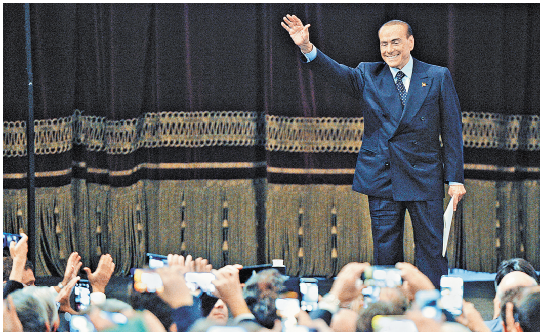
Берлускони и его союзники могут получить от 34 до 38 процентов голосов избирателей.

Предсказать исход голосования не берутся даже самые матерые эксперты, называя будущие результаты не иначе как лотерей. Свои прогнозы они строят лишь на основе опросов общественного мнения, единогласно предрекающих победу правоцентристской коалиции во главе с экс-премьером Берлускони, которого многие его политические оппоненты, судя по всему, преждевременно списали со счетов.