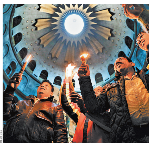
Храм Гроба Господня в Иерусалиме вновь открыл двери для прихожан. Надолго ли?

Как пишут местные СМИ, решение обложить налогом церкви мэрия приняла после удачного опыта по взаимному городскому налогу с расположенных в Иерусалиме учреждений ООН. В свою очередь, руководство христианских конфессий напомнило чиновникам о международных обязательствах еврейского государства, гарантировавшего привилегии, в том числе финансового характера, религиозным учреждениям.