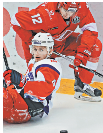
В матче с «Локомотивом» хоккеисты «Спартака» (в темном) не смогли гарантировать себе место в плей-офф.

22.55. «Баскония» (Испания) — «Химки». Прямая трансляция.