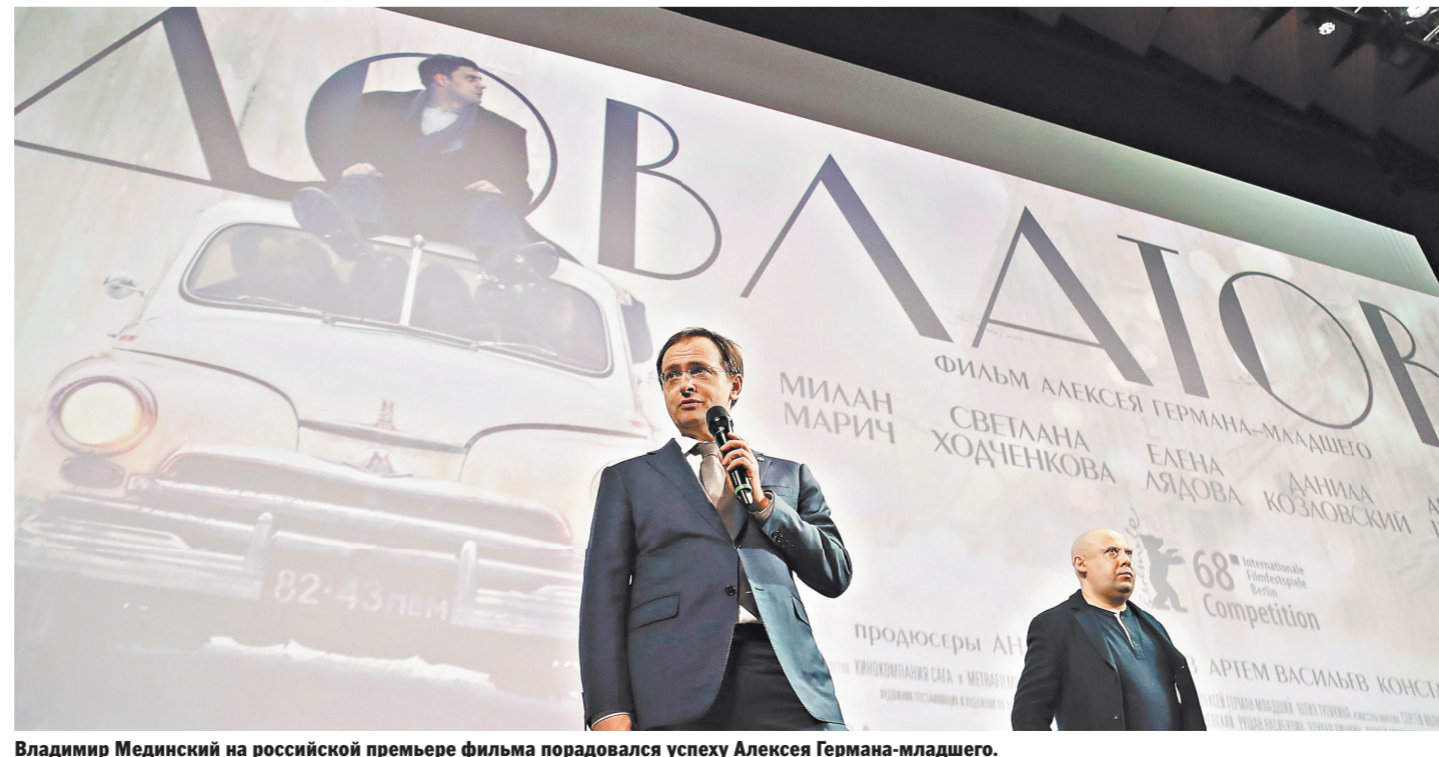
Владимир Мединский на российской премьеры фильма порадовался успеху Алексея Германа-младшего.

Кстати, «Довлатов» уже куплен для показа вездесущим сервисом Netflix. Писателя в картине сыграл сербский актер Милан Марич.