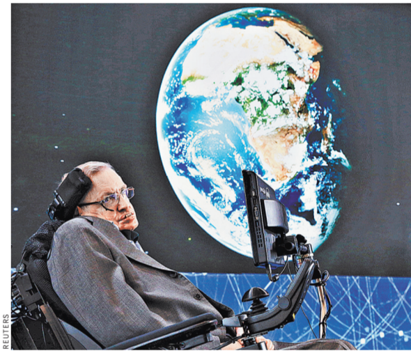
Стивен Хокинг стал одним из инициаторов проекта по отправке мини-аппаратов к звездной системе Альфа Центавра.