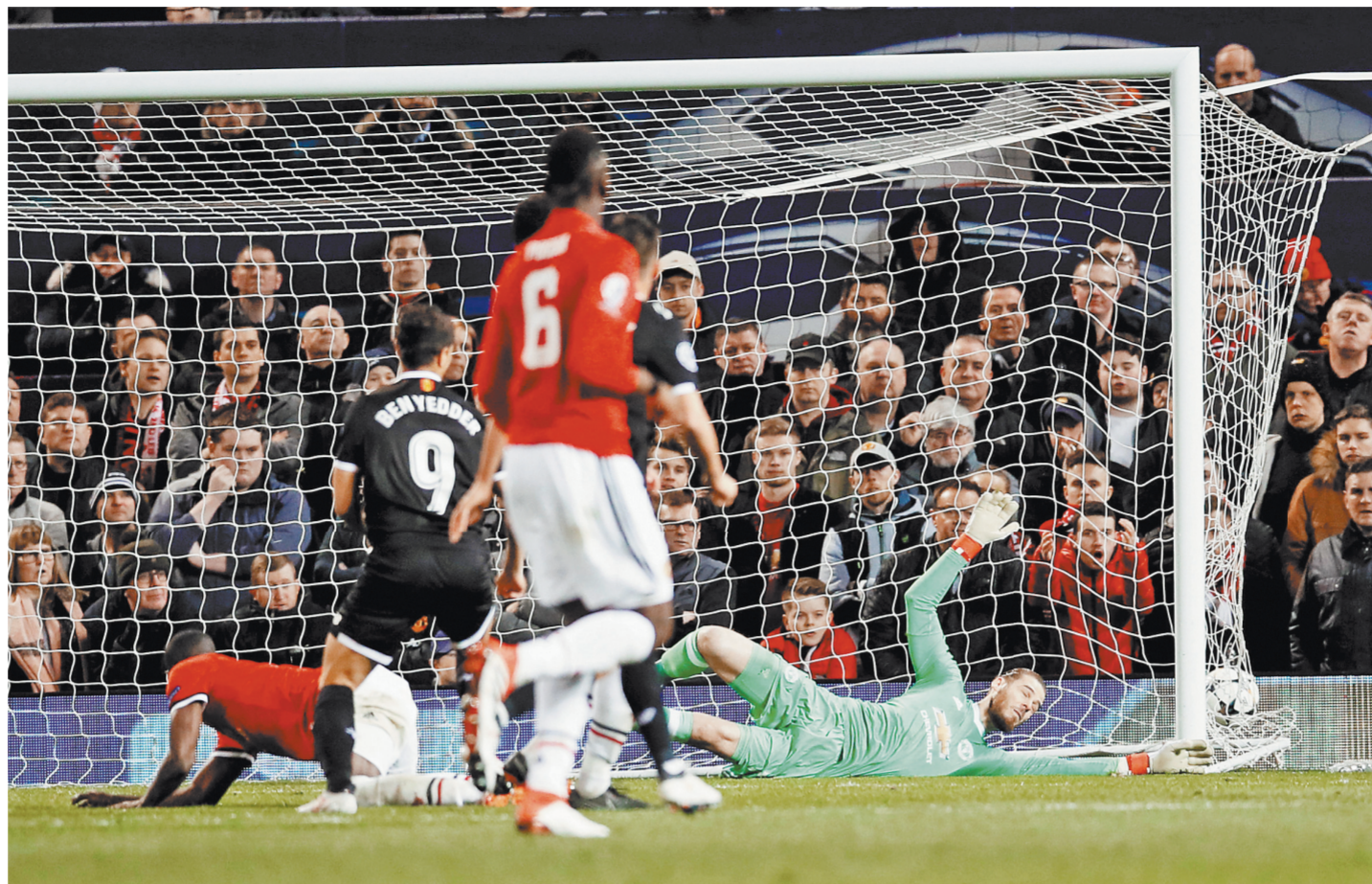
Игра, которую показал «МЮ» в матче с «Севильей», не вызвала ничего, кроме разочарования.

— Сегодня Жозе — тренер, который потратил почти миллиард фунтов за карьеру, и его команды