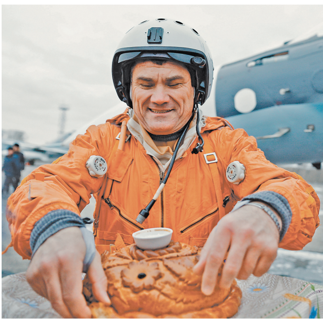
Суточная норма потребления йода содержится всего в 150 граммах хлеба, приготовленного с йодированной солью.

мкг). Проведение массовой профилактики йоддефицитных заболеваний за счет производства и продажи йодированной соли — наиболее эффективный метод, рекомендованный Всемирной организацией здравоохранения (ВОЗ). Подсчитано, что в 150 граммах хлеба, изготовленного с использованием йодированной соли (по рецептуре 1,5 процента соли на 100 граммов муки), суще-