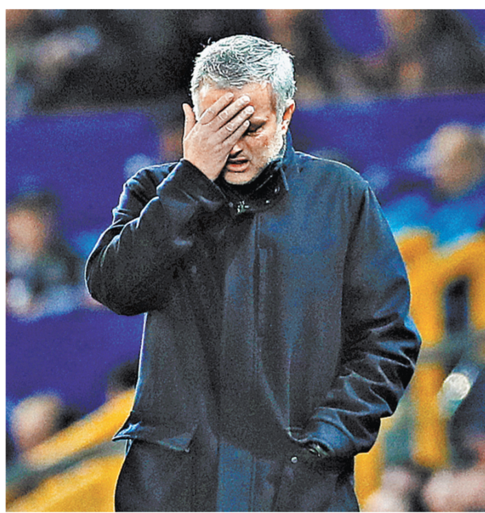
Пожоже, методы Жозе Моуринью уже не работают.

«МЮ» четвертый год подряд остался без 1/4 финала Лиги чемпионов