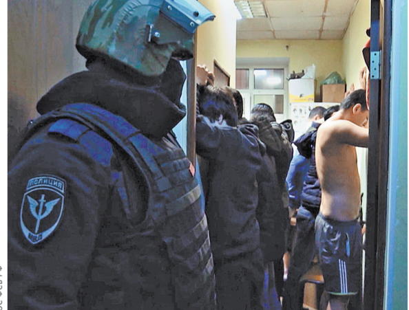
Задержаны сразу 60 человек, организовавших через Россию канал переправки жителей стран СНГ в Сирию и Ирак.

Оперативно-следственные мероприятия по делу продолжатся, личности задержанных в интересах следствия не разглашаются, отметили в ФСБ.