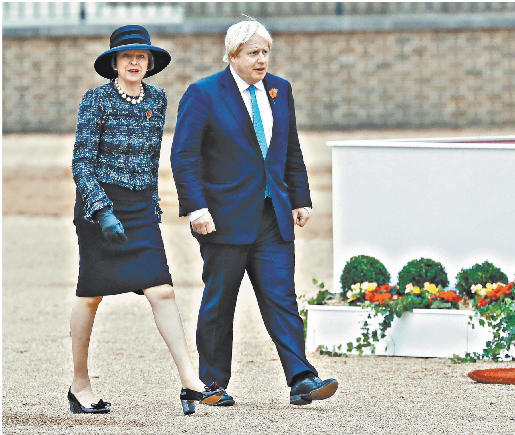
Совсем не сладкая парочка. Премьер Британии Тереза Мэй и ее министр иностранных дел Борис Джонсон шагают в ногу.

1 «Все, что было сделано британским правительством, совершенно неприемлемо, и мы считаем это провокацией», — подтвердил дипломат телеканалу Sky News. Как сообщило РИА Новости со ссылкой на британские источники, в настоящее время в дипломатическом списке посольства РФ находится 58 дипломатов. Таким образом, после высылки 23 человек штат дипмиссии сократится почти на 40 процентов.