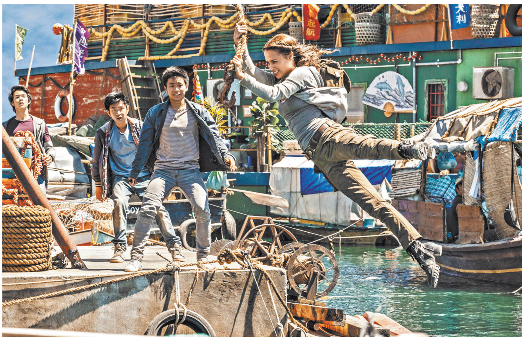
Страсть к приключениям Алисия Викандер вполне разделяет со своей героиней Ларой Крофт.