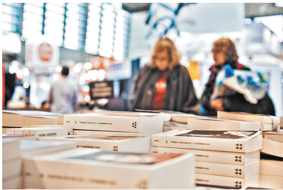
На Парижском книжном салоне-2018 презентуют первые книги 100-томной «Библиотеки русской литературы на французском языке».