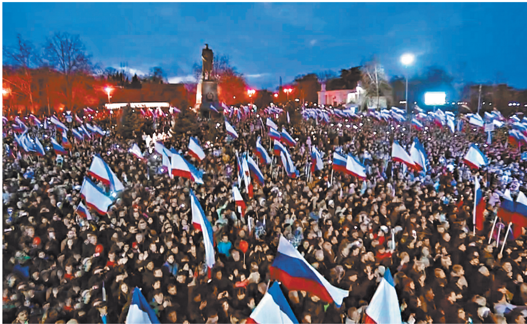
Около 40 тысяч человек приняли участие в митинге-концерте по случаю четвертой годовщины воссоединения Крыма и Севастополя с Россией.