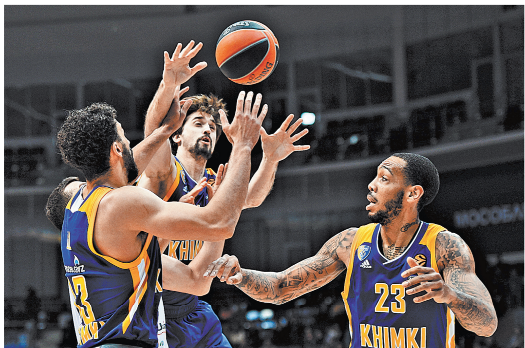
От результата игры с «Маккаби» во многом зависит, попадут ли «Химки» в плей-офф Евролиги.

22.00 «Маккаби» (Израиль) — «Химки» (Россия). Прямая трансляция.