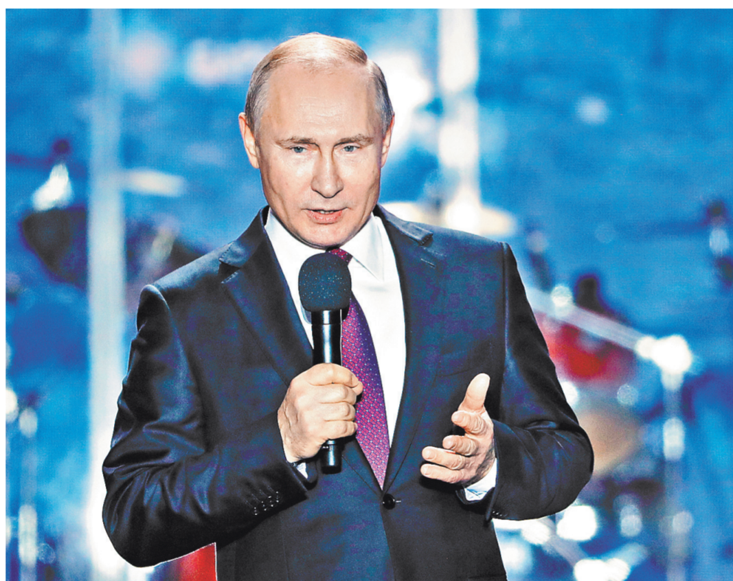
Владимир Путин принятое жителями полуострова в 2014 году решение назвал историческим.

Президент поблагодарил крымчан за восстановление нарушенной в советские времена справедливости