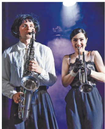
Фабула фильма «В джазе только девушки» — шапур для динамичного театрального рева.

Обе классические вещи адаптировала для учебной сцены Жанна Жердер. Сюжет «Баядера» перенесла в Голливуд 30-х годов, где по знаменитой оперетте ставят фильм, и мы в кинематографическом закулисье с его интригами, ревностью, коварными поджогами сопернице и упрямым восхождением к славе ценой любых жертв. Фабула «В