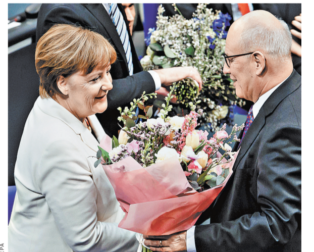
Главной задачей Меркель будет сохранить правящую коалицию и подготовить себе достойную смену.

Муж Ангелы Меркель Йоахим Зауэр впервые за 13 лет пришел поддержать ее на выборах в бундестаге.