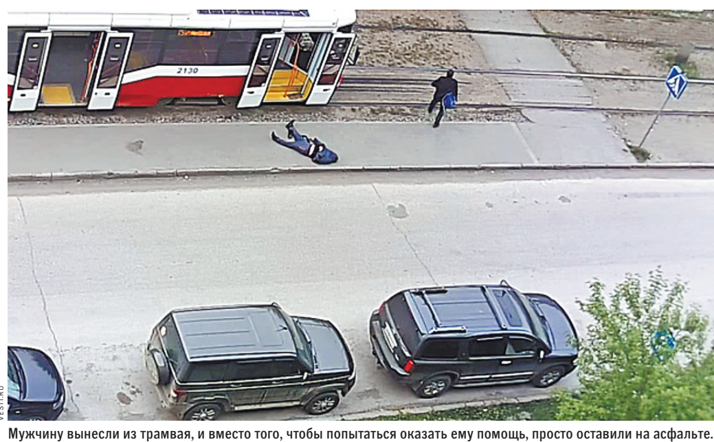
Мужчину вынесли из трамвая, и вместо того, чтобы попытаться оказать ему помощь, просто оставили на асфальте.

Работники трамвая и очевидцы происшествия пояснили стражам порядка, что «высажен-