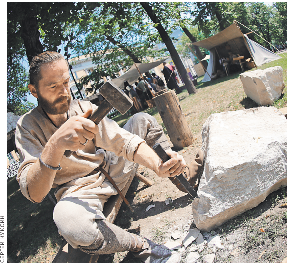
На фестивальных площадках можно встретить камнетесов, кузнецов, писцов и обладателей других древних профессий.

Вход на все площадки бесплатный, работают они с 12.00 до 21.00 в будни и с 11.00 до 21.00 по выходным. Узнать адреса, расписание мероприятий и другие подробности можно на сайтах moscowseasons.com и historyfest.ru. Доступно и мобильное приложение.