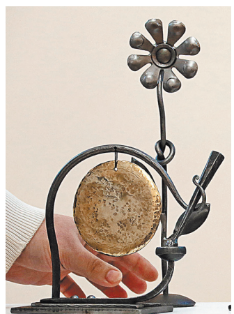
Перед ударом гонга. Призы — в ожидании «Неистового Виссариона».

Литературная критика оказалась профессией отнюдь не вымирающей: на конкурс (который поддержали все толевские литературные журналы, выдвинув своих номинантов) было прислано более ста заявок, в шорт-лист вошло 12 фамилий.