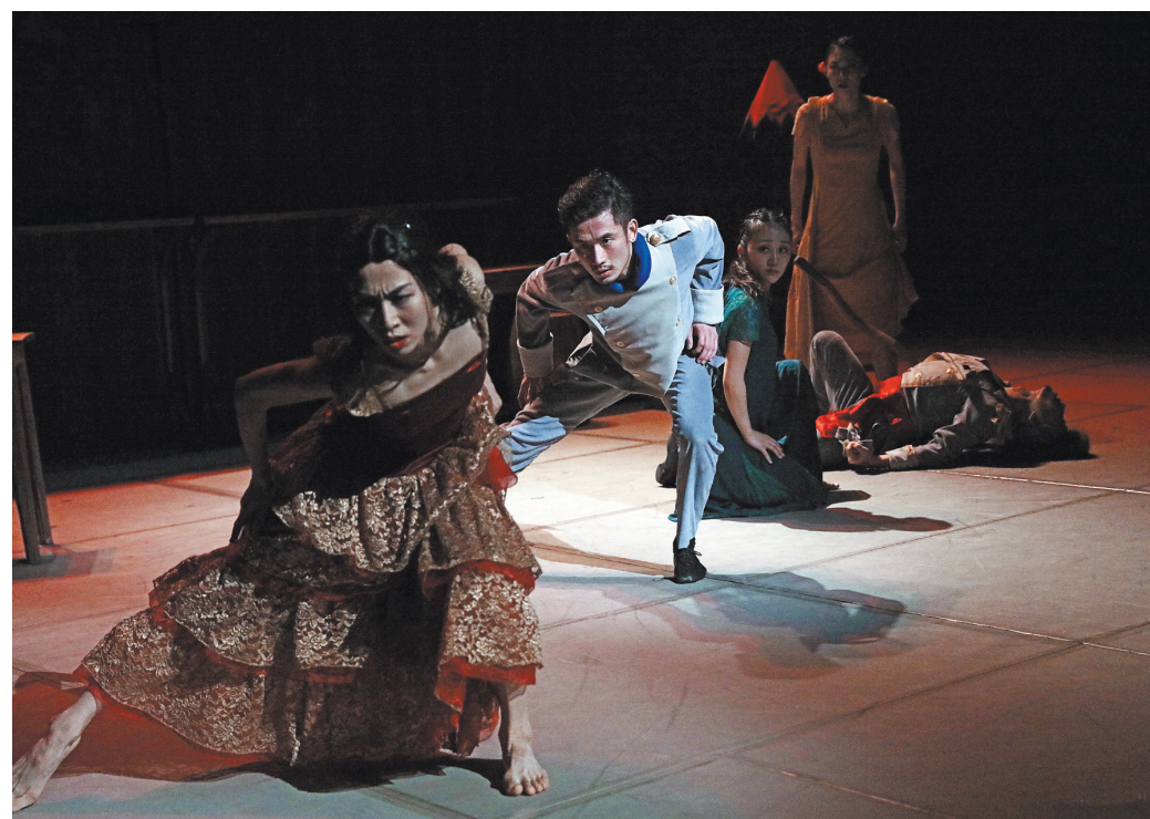
Японский хореограф Дзе Канамори в постановке «Кармен» соединил традиции театра Но и классического балета.