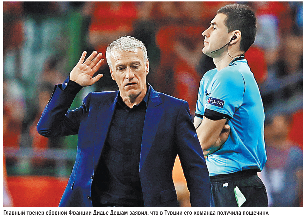
Главный тренер сборной Франции Дидье Дешам заявил, что в Турции его команда получила пощечину.

В группе I, где выступает сборная России, состоялись еще два поединка. Лидер мирового рейтинга Бельгия довольно спокойно справилась дома с Казахстаном — 3:0. Голы забил Мертенс, Кастань и Лукаку. А шотландцы в Глазго лишь на 89-й минуте смогли дожать следующего соперника россиян Кипр — 2:1. Таким образом, британская