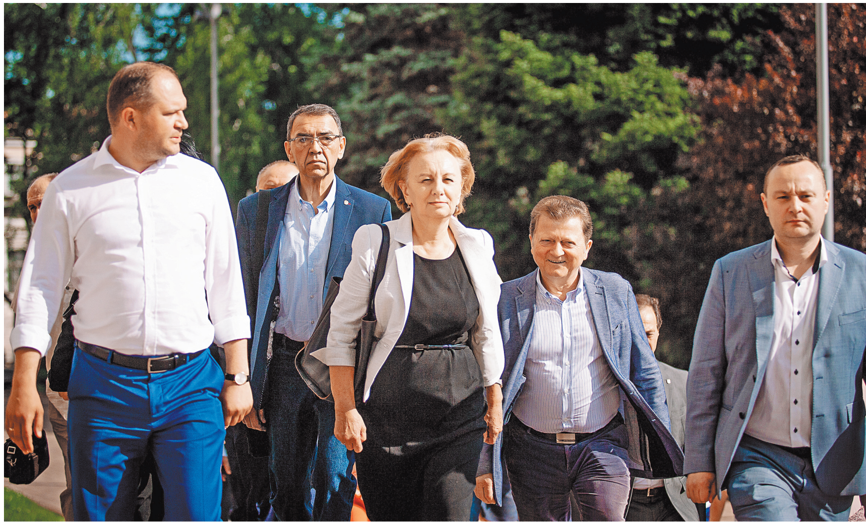
ПАВЕЛ ДУЛЬМАН / ТАСС