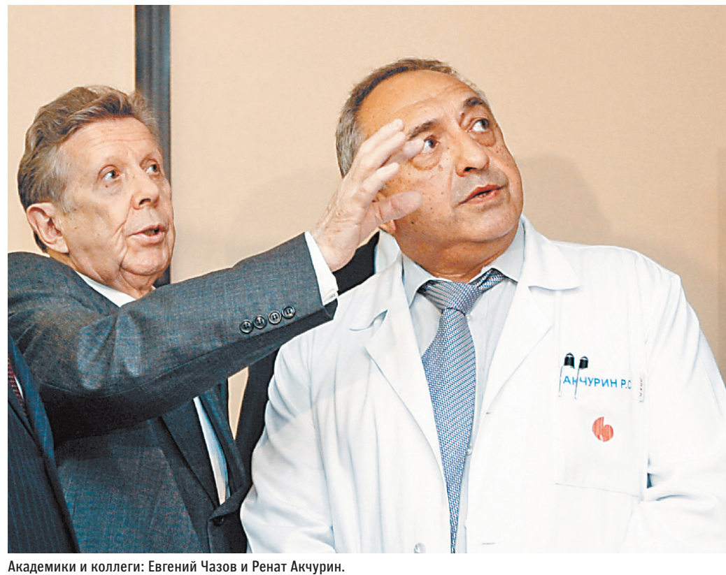
Академики и коллеги: Евгений Чазов и Ренат Акчурин.