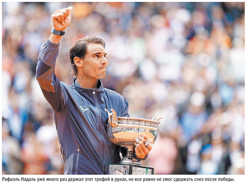
Рафаэль Надаль уже много раз держал этот трофей в руках, но все равно не смог сдержать слез после победы.

ТИТУЛА Рафаэль Надаль завоевал Рафаэль Надаль за свою карьеру.