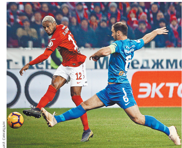
«Зенит» и «Спартак» в первом туре прозакрамяют новичков Премьер-лиги — «Тамбов» и «Сочи».

Что касается первого тура, то в нем сложно выделить одну конкретную игру. Пожалуй, наибольший интерес вызывают матчи чемпиона страны «Зенита» и московского «Спартака». Оба клуба примут дебютантов элитного дивизиона: «Тамбов» и «Сочи» соответственно. ●