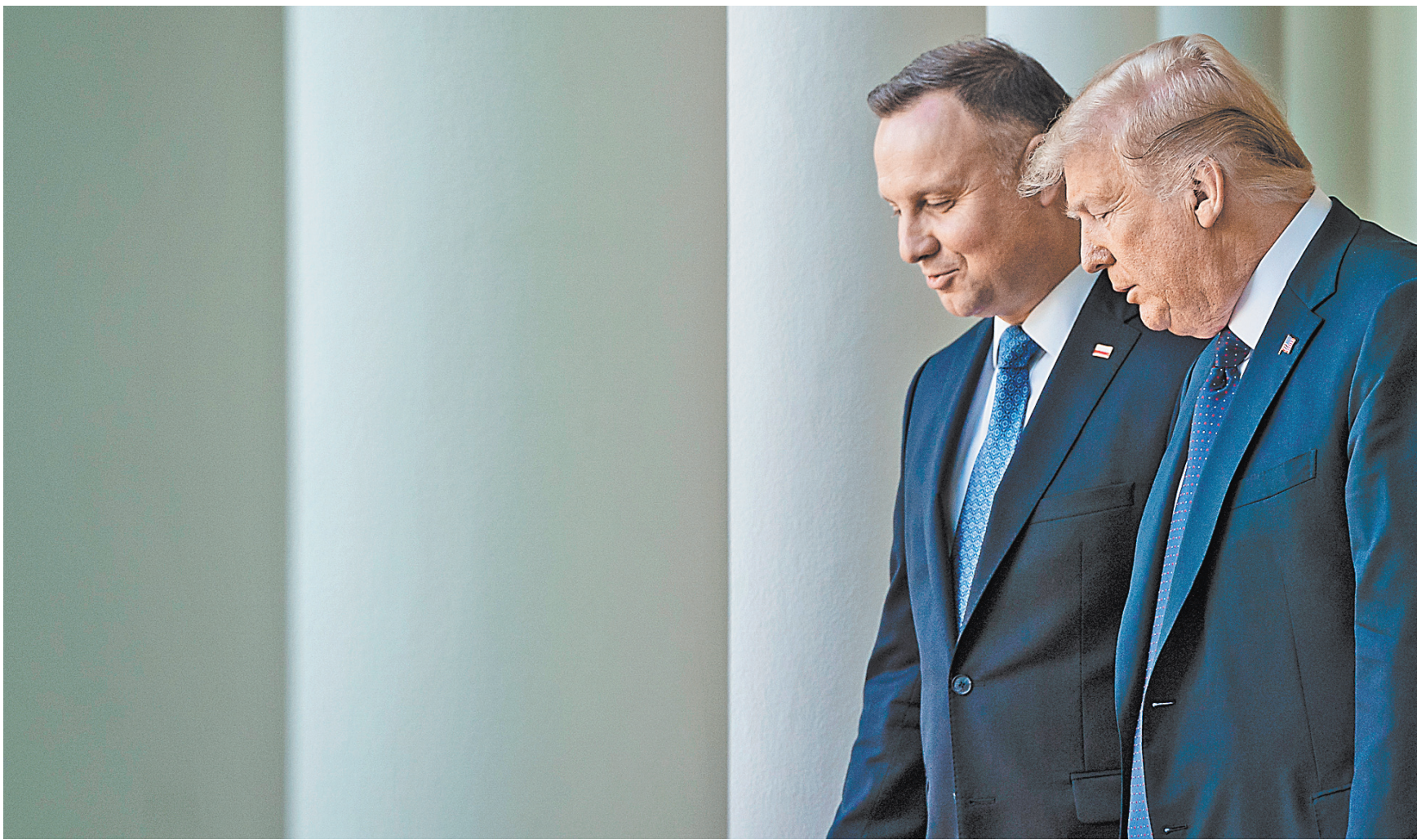
Президенты Дональд Трамп и Анджей Дуда провели переговоры в Белом доме, по итогам которых заявили: часть контингента США из Германии могут перебросить в Польшу.

1 ← Лоббирующий интересы американских добывающих компаний Трамп