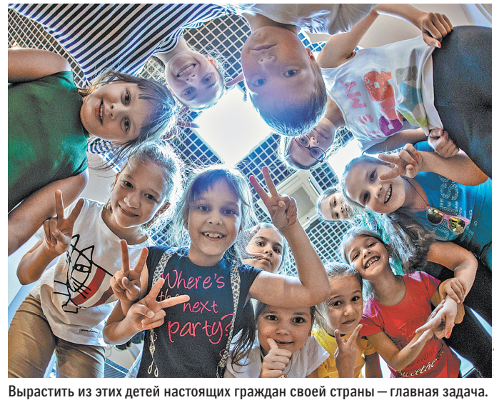
Вырастить из этих детей настоящих граждан своей страны — главная задача.

— Все об авто на сайте: цены, тест-драйвы, ПДД rg.ru/auto