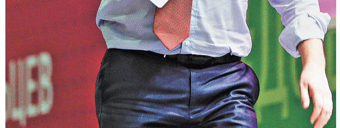
Назначенный главой Россотрудничества Евгений Примаков пообещал большие перемены в работе ведомства.

Евгений Примаков родился 29 апреля 1976 года в Москве. В 1999 году он окончил историко-филологический факультет Российского государственного гуманитарного университета по специальности «история». Много лет он работал в журналистике. В 2018 году был избран депутатом Госдумы. ■