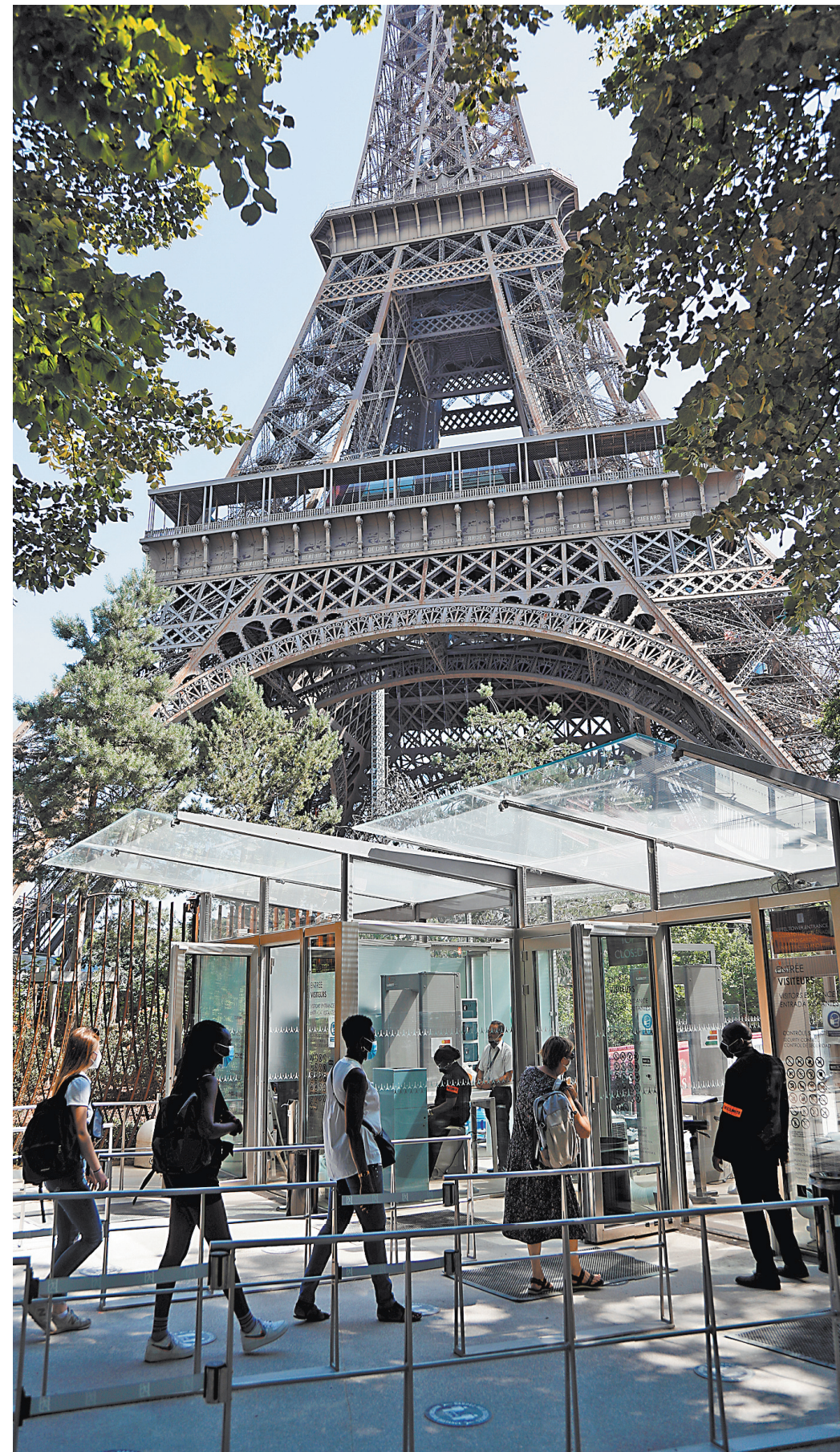
Сто дней Эйфелева башня была на карантине, и вот наконец-то это вынужденное затворничество закончилось. В четверг туристы, как местные, так из соседних стран, заранее забронировавшие билеты на сайте Общества по эксплуатации Эйфелевой башни, начали восхождение на ее вертолету. А если точнее, то сначала на первый ярус, а далее на второй, что находится на высоте 115 метров. Причем администрация предупредила, что лифты до 1 июля будут отключены, а потому всем пришлось самостоятельно преодолеть без малого 700 лестничных ступеней. О том, чтобы подняться на последний третий уровень этой архитектурной «легенды», а это уже 276 метров над земной поверхностью, пока и речи нет. Судя по всему, «поднебесная» смотровая площадка, с которой открывается захватывающий вид на Париж, станет доступной лишь в начале августа.

Италия для Евросоюза — это большая головная боль. В принципе немцам интересен только север: Милан, Турин... Вся остальная часть «сапожка» не