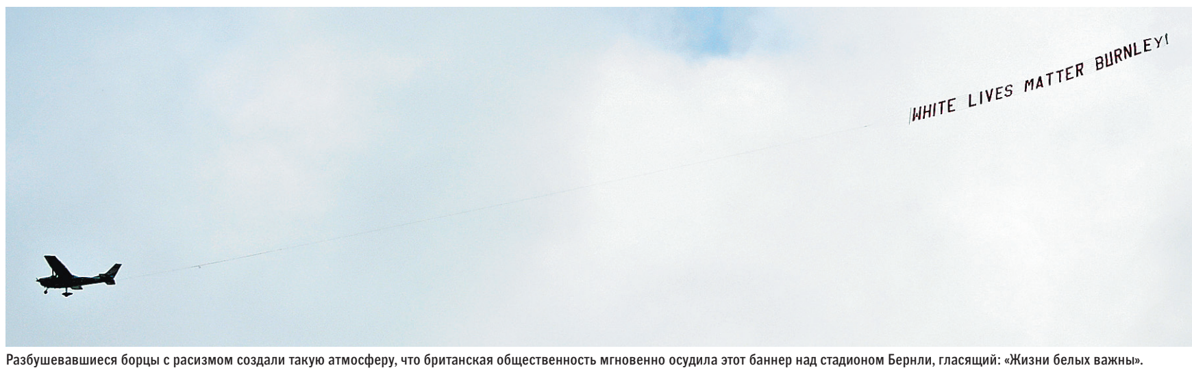
Разбушевавшиеся борцы с расизмом создали такую атмосферу, что британская общественность мгновенно осудила этот баннер над стадионом Бернли, гласящий: «Жизни белых важны».