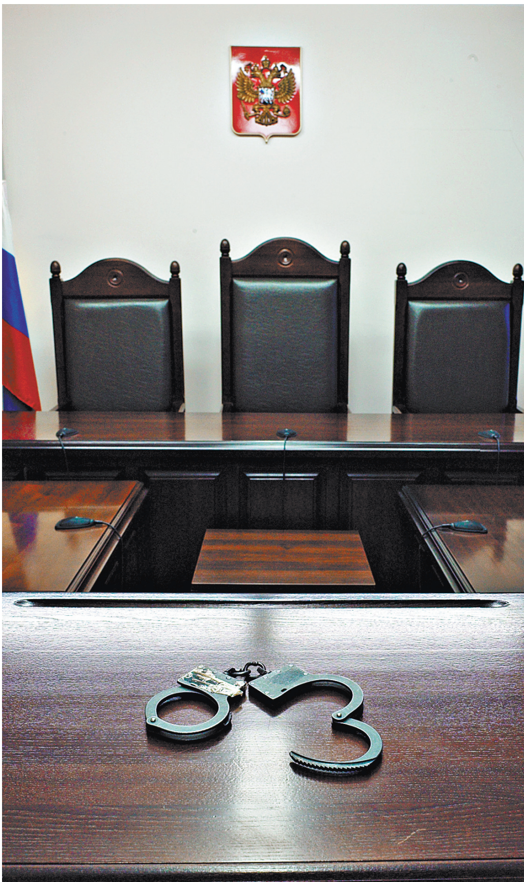
Пленум Верховного суда России напомнил, что арест исключительная мера и должна применяться только в случае, когда иное не подойдет. Но сегодня можно, например, назначить человеку залог и установить набор запретов.

имеет постоянного места жительства на территории нашей страны, его личность не установлена, он скрывался от органов предварительного расследования или от суда и т.п. А если человек уже оказался в СИЗО, арест нельзя продлевать автоматически. Следователь, желающий подержать в казенном доме обвиняемого еще какое-то время, обязан подробно отчитаться перед судом: что было сделано, пока гражданин сидел в камере. Если следствие раз за разом просит продлить арест, ссылаясь на необходимость провести какие-то следственные действия, например, очные ставки, суд должен разбираться, а что помешало сделать это раньше? К тому же сама по себе необходимость проведения новых допросов не может быть достаточным основанием для продления ареста.