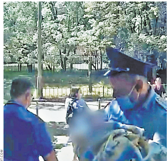
Всех пятерых младенцев полиция отправила в детские больницы.

В этот раз, как и в предыдущем случае, о «заказных» детях стало известно совершенно случайно. По одним сведениям, полицию вызвали соседи, когда за стеной не прекращался детский плач, по другим — доктор пошел посмотреть младенца, только что выписанного из роддома, застал вместо одного сразу пятерых и вызвал полицию.