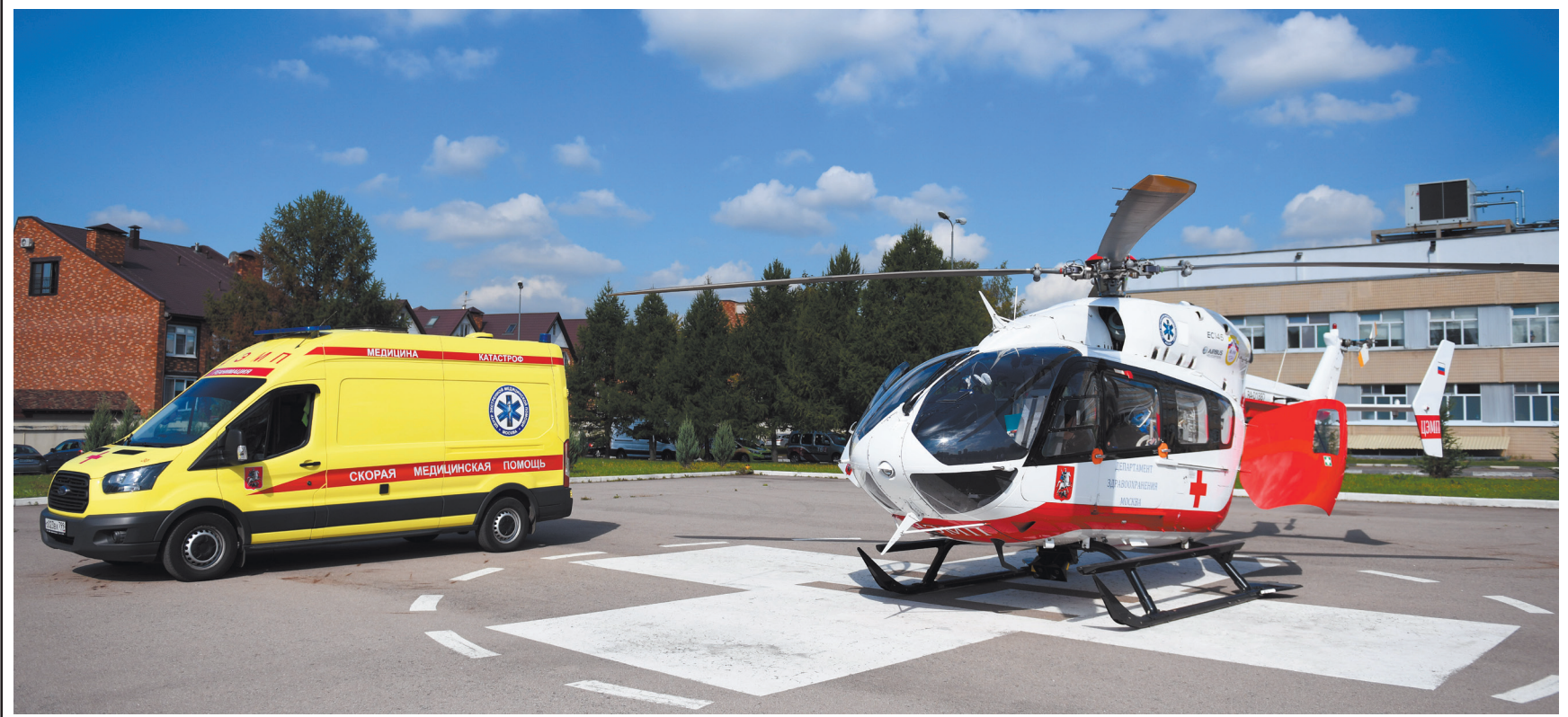
На место ДТП вертолет прилетит в течение 15 минут с момента получения сигнала.

Материал подготовлен в рамках реализации федерального проекта «Безопасность дорожного движения» национального проекта «Безопасные и качественные автомобильные дороги».