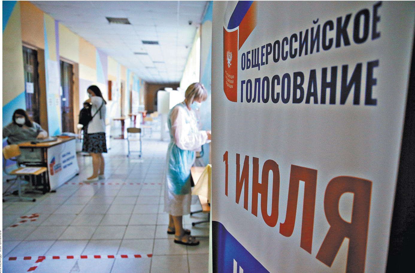
Санитарные правила действуют на всех избирательных участках, а их в России почти 100 тысяч.

Основной день голосования, определенный указом президента, — 1 июля, но для удобства и безопасности граждан участки решено открыть раньше — с 25 июня. Отдать свой голос