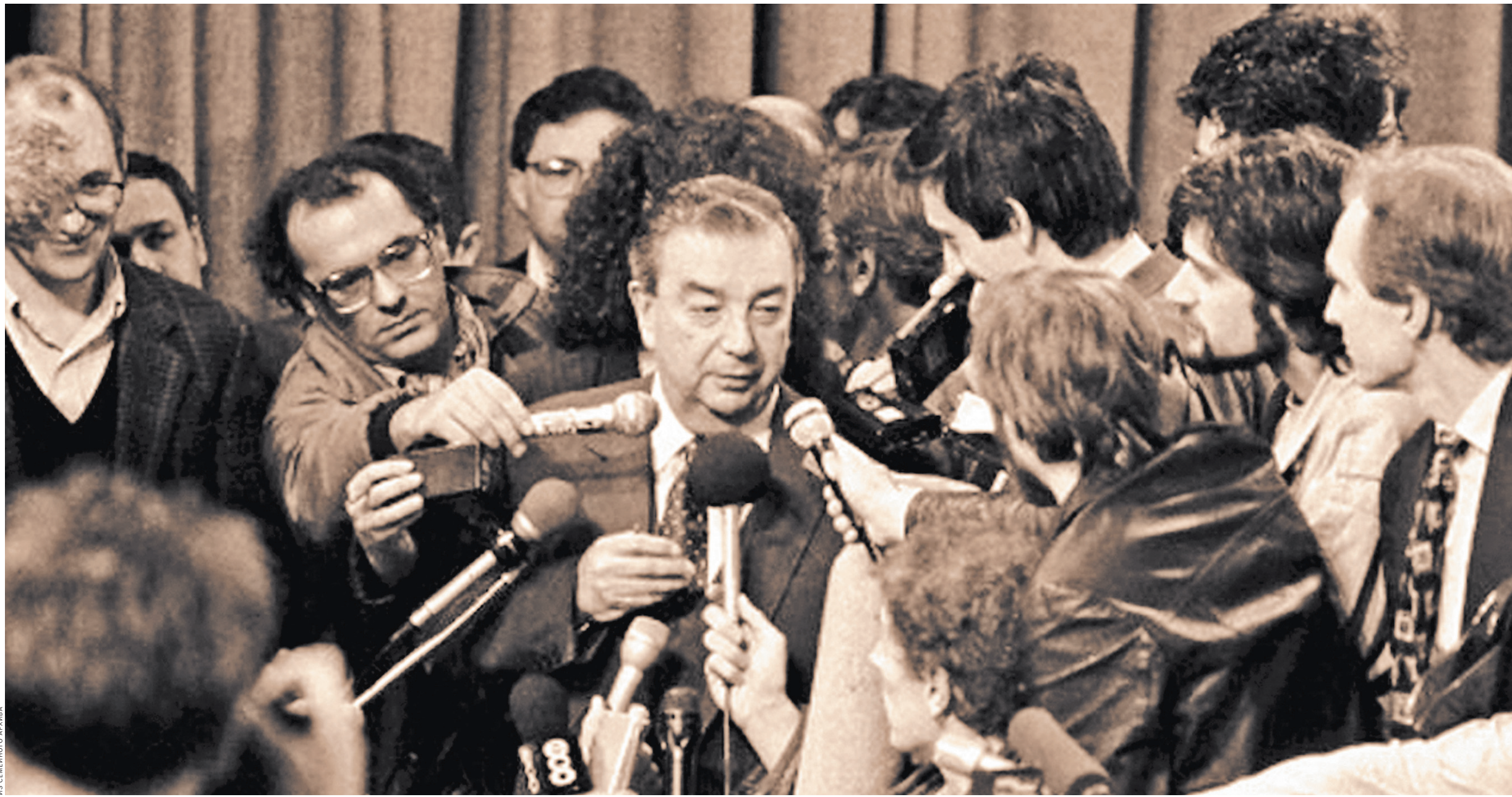
Евгений Примаков всегда был в центре внимания. Особенно журналистов — на его пресс-конференциях неизменно был аншлаг. И мы гордимся, что последние десять лет самые важные свои статьи Евгений Максимович публиковал в «Российской газете».

Пять лет нет с нами Евгения Примакова. Вернее — его нет на этой земле. А с нами, с теми, кто его знал, он остался. Как учитель, ученый, мудрец, политик. И конечно, как друг. Продолжает жить и развиваться то, о чем он писал и что делал. Для экономики страны — когда был премьер-министром, возглавлял Торгово-промышленную палату РФ. С него начинались законы о промышленной политике и малом бизнесе, которые наполняются новыми нормами, необходимыми сегодня. Для международного сотрудничества — когда руководил Советом внешней разведки России, был министром иностранных дел. Благодаря ему нашей стране удалось совершить прорыв во взаимоотношениях со странами Ближнего Востока. И конечно, для науки — 10-томник трудов академика Примакова не вместил и половины его статей и работ. И сейчас по этим книгам учатся будущие экономисты и дипломаты. Они есть во многих вузовских библиотеках. Подлинная ценность наследия заключается в том, насколько востребовано оно потомками. Часто ли к нему обращаются как к практической рекомендации для сегодняшней жизни. И в этом смысле Примаков будет еще долго оставаться нашим современником. «Люди говорят: уходит время. Время говорит: уходят люди. Давайте же успевать ценить и то, и другое», — писал Евгений Примаков. И мы ценим. И он не ушел.