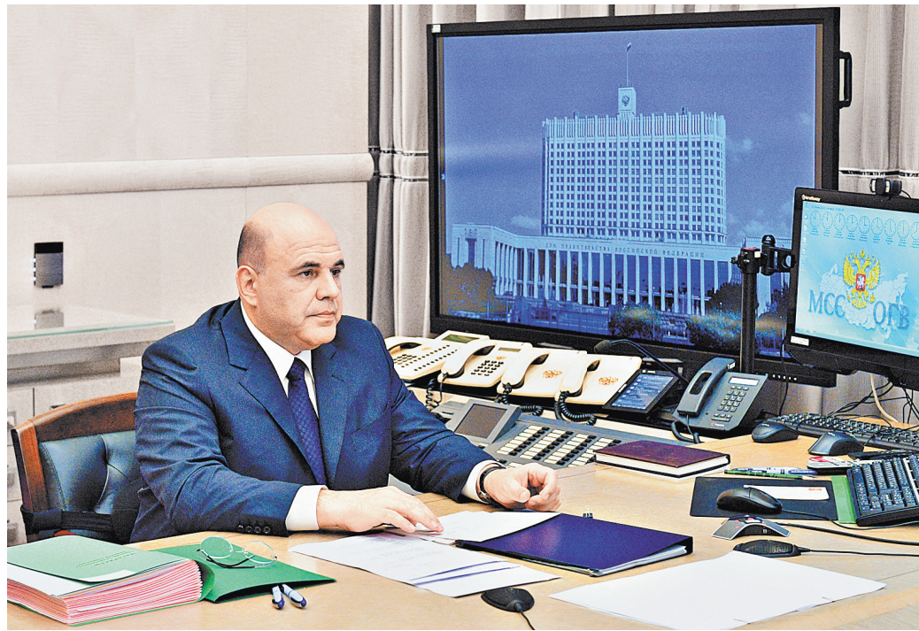
Михаил Мишустин призвал как можно быстрее проработать нормативную базу для реализации инициатив президента.

Чтобы это исправить, предлагается законодательно закрепить, что территориальные общественные самоуправления являются некоммерческими корпоративными организациями и их деятельность приравнена к деятельности социально ориентированных НКО, — сообщил он. — При этом, как и другие НКО, они смогут рассчитывать на поддержку государства, в том числе финансовую, имущественную и консультационную.