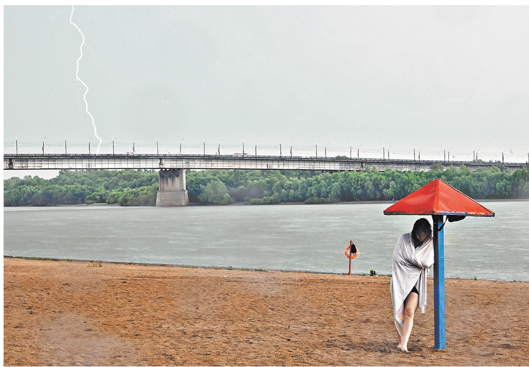
Избыток дождей в июле прогнозируется в основном на севере страны.

Почему климат России теплее быстрее всех в мире rg.ru/art/1807945