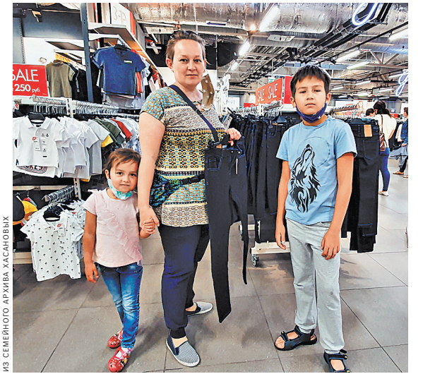
Деньги пришли весьма кстати: родители купили мебель в детскую комнату, одежду к школе и детскому саду.

— Мы получили в общей сложности выплаты на двоих детей в 40 тысяч рублей — это существенная поддержка для нашей семьи. Сразу пошли тратить в магазин. Ведь нужно одеть сына и дочери купить к школе и детскому саду, — поделилась радостью Наталья.