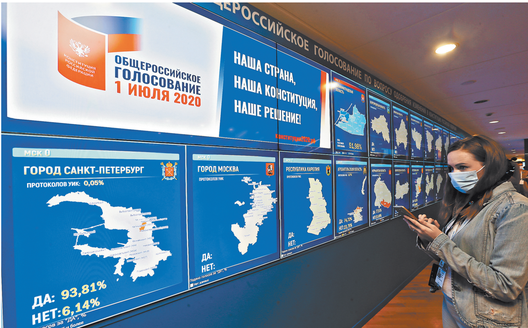
Ход голосования в регионах отображался на видеостене в Центризбиркоме в режиме реального времени.

«Высокая явка свидетельствует о том, что предоставленная возможность голосовать в течение нескольких дней, порядок, форма голосования оказались для людей очень удобными», — считает Элла Памфилова. Ведь принять участие в плебисците можно было в разных форматах — не только на обычных участках, но и на дому, во дворе, а в двух регионах (Москве и Нижегородской области) — и по интернету. Конечно же, предпринятые меры безопасности также сыграли свою роль для повышения явки. Активность граждан оказалась «очень достойной» —