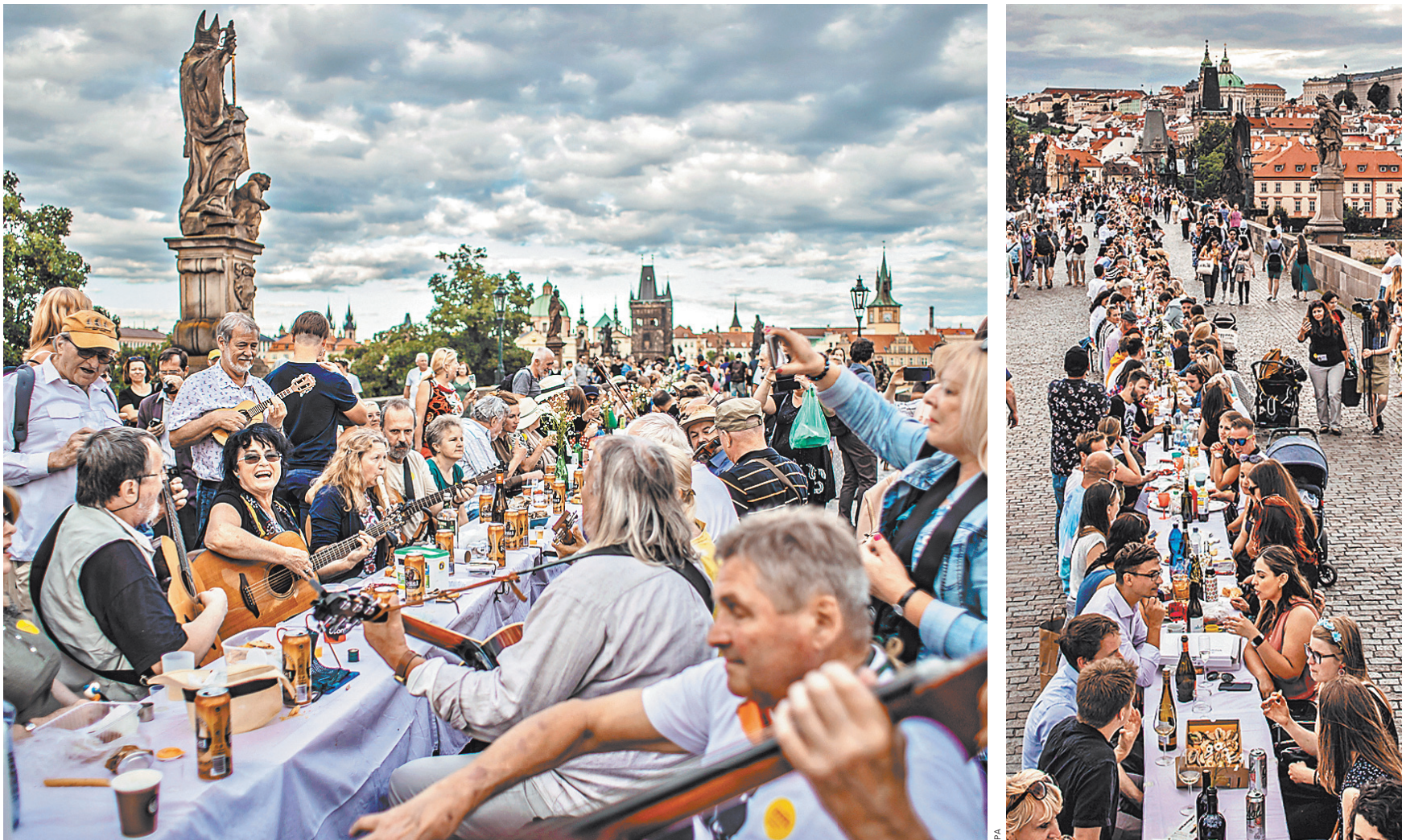
В необычном ужине на мосту, по предварительным оценкам, приняли участие около двух тысяч человек.

Владимир Снегирев, «Российская газета», Прага