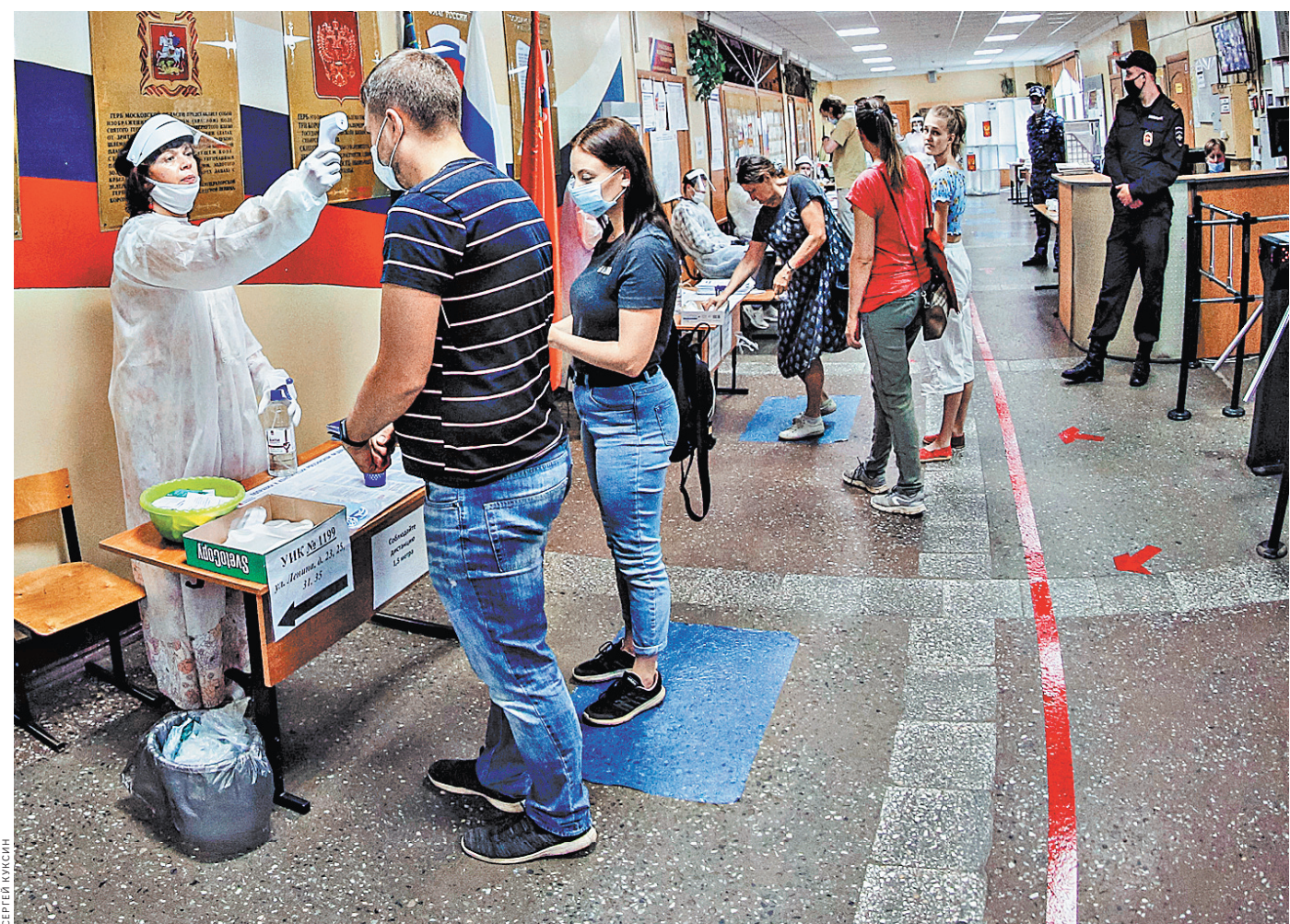
Голосование было организовано с соблюдением рекомендаций Роспотребнадзора: всем участникам измеряли температуру, выдавали маски и перчатки.