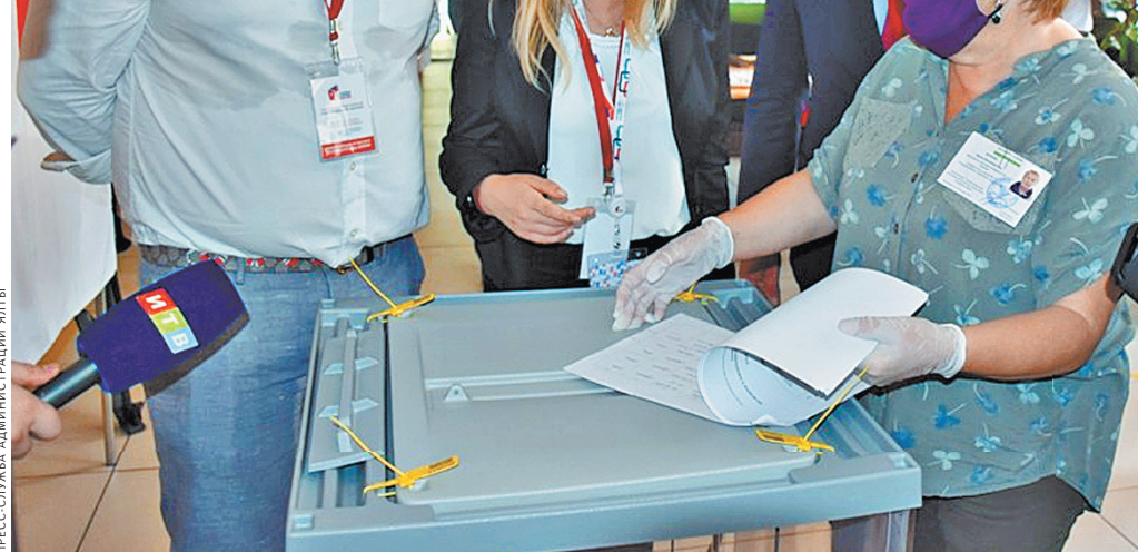
Депутаты Европарламента, прибывшие в Крым в качестве международных наблюдателей, посетили избирательные участки в Симеизе, Алушке и Ялте.

На Черноморском флоте рассказали, что в голосовании по поправкам в Конституцию РФ приняли участие 100 процентов военнослужащих, включая личный состав, находящийся в командировках или выполняющий боевые задачи. ●