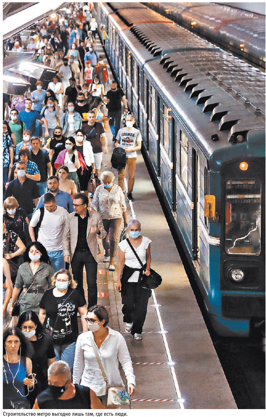
Строительство метро выгодно лишь там, где есть люди.