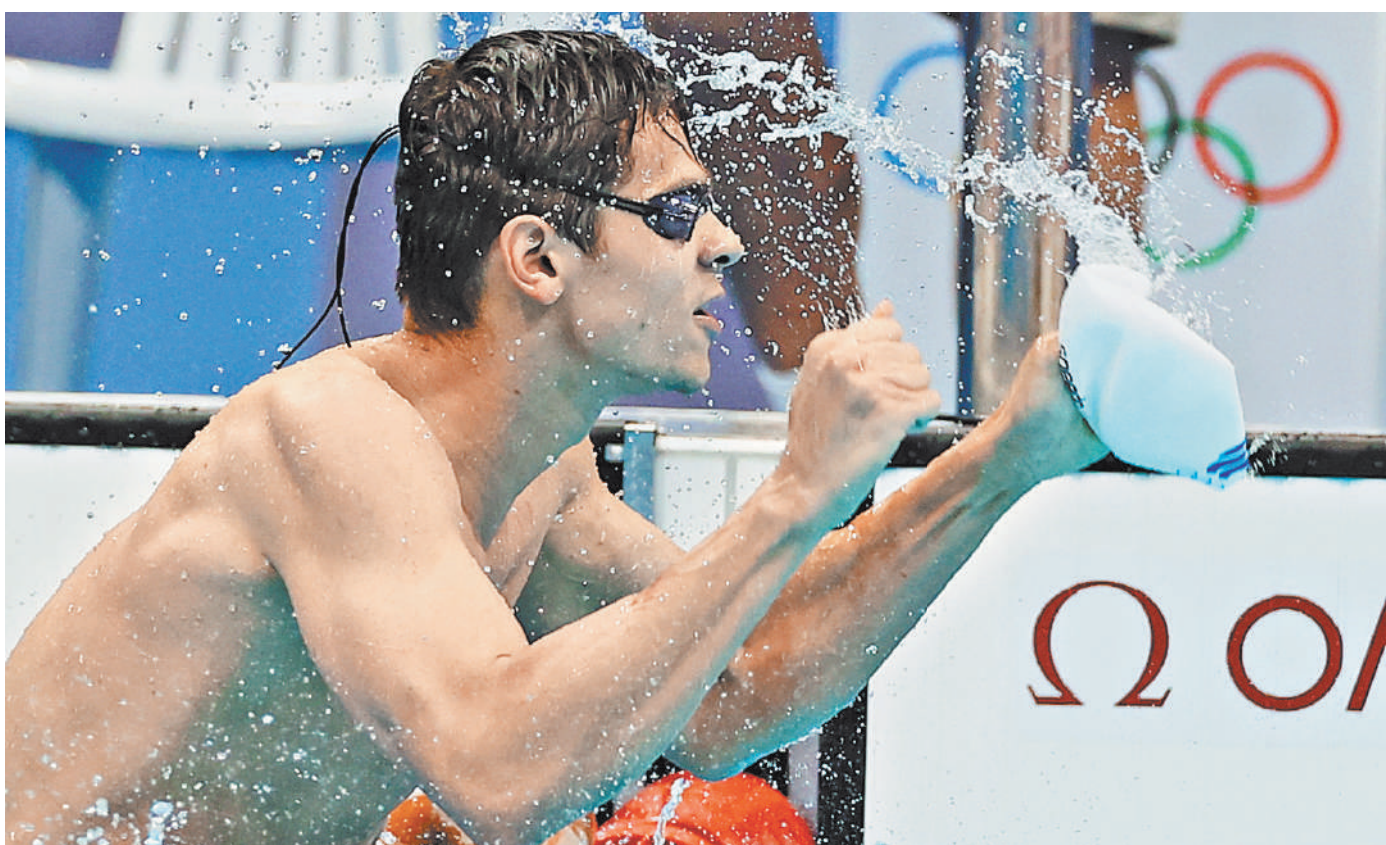
На Играх в Токио Евгений Рылов победил на дистанции 100 метров на спине с рекордом Европы — 51,98 секунды!

Гимнастки сборной России взяли золото в многоборье, опередив американок. с. 14