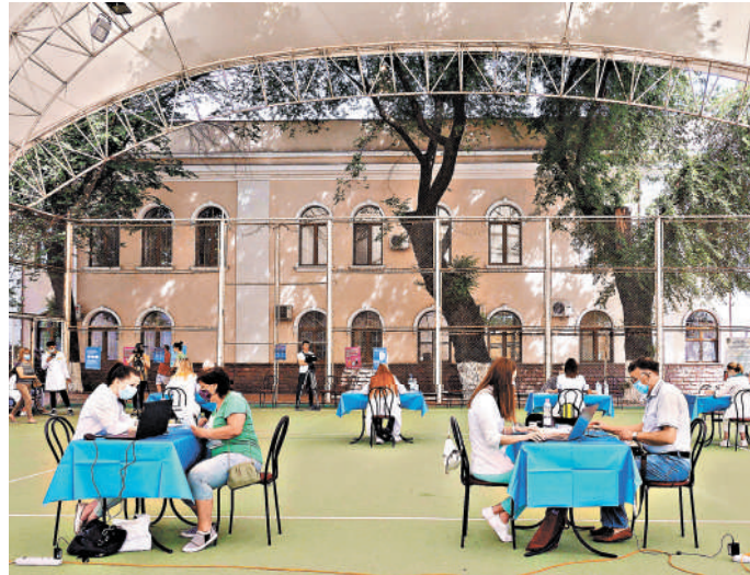
Одесса, июль 2021-го, центр вакцинации. Украине, как и другим слабо развитым странам, компания Pfizer разрешила хранить вакцину в простом холодильнике и продлила срок годности открытого флакона с 5 дней до месяца.

Что важно понимать: Украина далеко не чемпион по проводимым клиническим испытаниям на 100 тысяч населения. По этому показателю в лидерах как раз страны Запада. Но есть качественное различие — на Украине, а также в Грузии глобальные игроки фармацевтического рынка проводят испытания тех лекарств, которые не рискуют испытывать на своих согражданах. В чем несложно убедиться на том же украинском сайте: из пяти десятков зарегистриро-