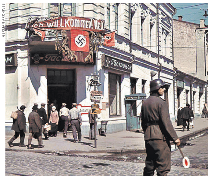
Житомир. Над магазином транспарант с надписью по-немецки: «Добро пожаловать!» Фотодокумент отравить в спецхран?