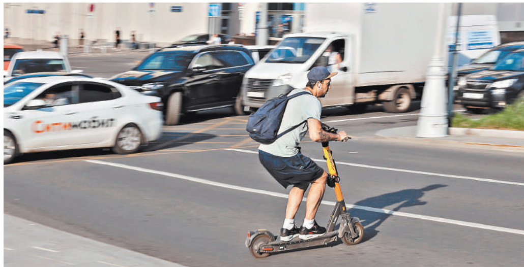
В первой половине 2021 года в России произошло 180 ДТП с участием самокатов.

Большинство же ДТП происходят с участием более мощных электросамокатов, которые могут развивать скорость до 100 километров в час. ●