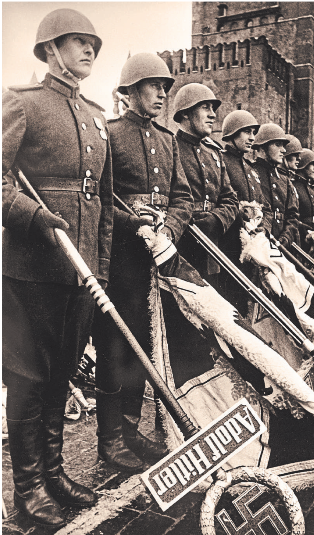
Важно, чтобы фотографию советских солдат, швыряющих фашистские знамена, не сочли за пропаганду нацизма.

был повешен, кто-то успел совершить самоубийство. Запрещая в любом виде публиковать их изображения и цитаты, мы нарушаем внятную логическую цепочку, которая должна быть в голове наших молодых: вот эти люди участвовали в создании нацистского режима и государства, они развязали войну, осуществляли геноцид, уничтожали города и села, жили в концлагерях военнопленных и мирное население. И следующее звено этой цепи — вот их ответственность, которая выразилась приговором. И рассказ об этих антигероях не пропаганда, а четкое понимание явления. Предстоит очень сложная задача отделить первое от второго.