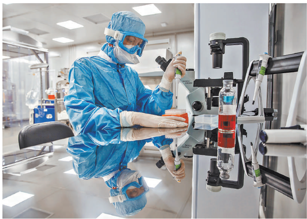
Комбинация вакцин может дать преимущество при появлении новых штаммов коронавируса.