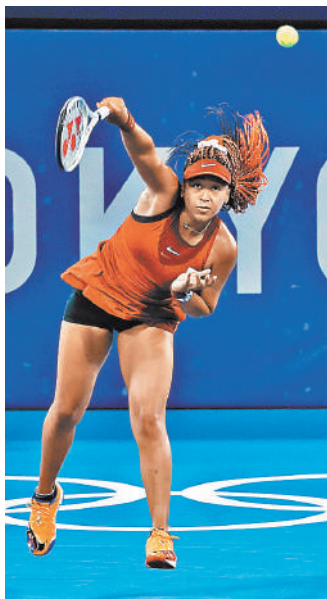
Наоми Осака продолжает скандальничать, что сказывается на ее результатах.

Хотя ничего удивительного в том, что Осаку ничуть не испугали денежные санкции, нет. Японка — самая богатая спортсменка мира. За последний год она заработала 55,2 миллиона долларов. Это больше, чем получает от коммерческих проектов одна из лучших теннисисток в истории американка Серена Уильямс и даже превышает рекорд Мари Шараповой в 2015 году (29,7 миллиона).