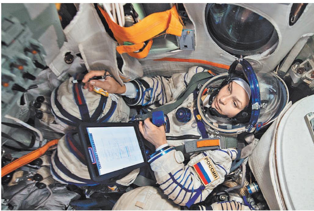
Актрисе Юлию Пересильд на главную роль выбрали из трех тысяч претенденток.

«РГ», можно поспорить — проект невероятно и нам, и нашим читателям интересен. А вот что касается западных СМИ — мы прочитали интервью, которое дала Юлия Пересильд агентству France-Press в начале июля. «Нам придется снимать в космосе то, что невозможно снять на Земле», — сказала в нем актриса и призналась, что, в отличие от многих других советских детей, выросших на фоне грандиозных подвигов Гагарина, она никогда не мечтала отправиться в космос. Юлия призналась также, что почувствовала «страх», когда ее выбрали на эту работу из 3000 кандидатов. ●