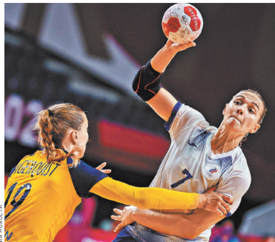
Российские гандболистки приехали в Токио защитить титул, но пока результаты оставляют желать лучшего.