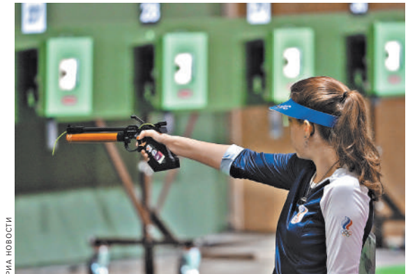
Всего за несколько дней Бацарашкина сначала выиграла «золото» Игр, а затем и «серебро».

Напомним, что Каримова является двукратной чемпионкой Европы (2020), а также чемпионкой мира (2018). В активе же Каменского две победы на первенстве планеты (2018) и семь на чемпионатах Европы. ●