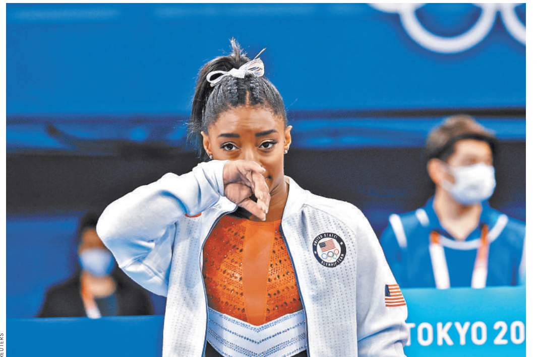
Лидером и звездой быть непросто. Симона Байлз призналась, что испытывает психологические проблемы.

ВИКТОРИЯ ЛИСТУНОВА: Да, перенос Игр мне помог. Когда стало понятно, что смогу выступить в