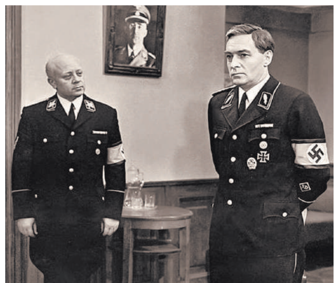
Штирлиц и Мюллер. Неужели придется ретушировать кадры из любимого фильма «Семнадцать мгновений весны»?