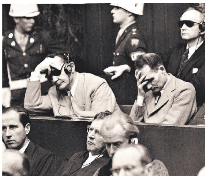
По заявлению какого-нибудь беспокойного гражданина публикация кадров с Нюрнбергского процесса может быть теперь наказуема?