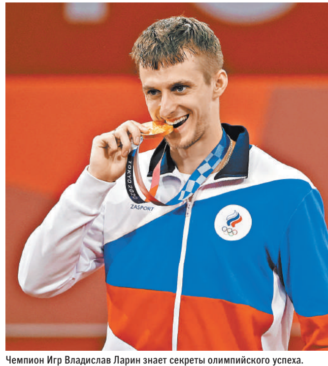
Чемпион Игр Владислав Ларин знает секреты олимпийского успеха.