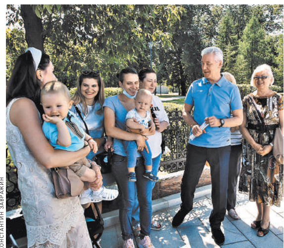
Мэр Москвы Сергей Собянин обсудил планы по благоустройству с жителями Пресненского района.

Отметив, что сейчас уже выполнено 60 процентов намеченных работ, мэр оценил их темпы: «Раньше на благоустройство такого масштаба нам требовалось два года, а сейчас хватает нескольких месяцев». В целом по Москве до конца текущего года будет обустроено 20 общественных пространств, а также 110 знаковых объектов, парковых и озелененных территорий. Самые масштабные из них — набережные острова Балчуг — Софийская, Раушская, Садовническая и Космодамианская, а также прилегающие к ним улицы Садовническая, Комиссарятские, Фалеевский и Раушские переулочки. ●