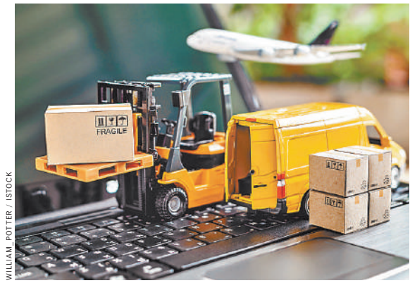
Рост цен на грузоперевозки объясняется увеличенным спросом, дефицитом водителей, высокой стоимостью запчастей.