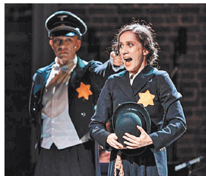
Спектакль «Кабаре Терезин», основанный на музыке и текстах заключенных концлагеря, идет во многих странах мира, в том числе и в Москве. Его афишу снять?