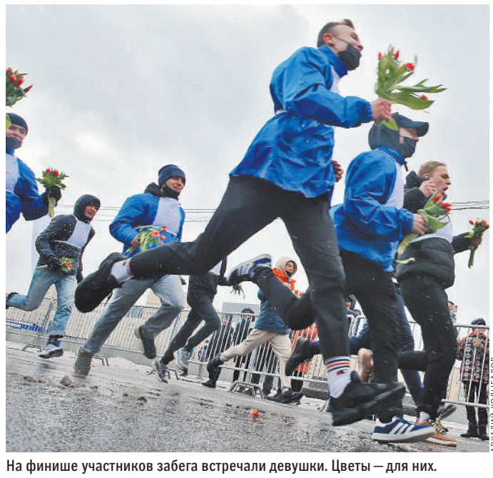
На финише участников забега встречали девушки. Цветы — для них.

Как сообщили «РГ» в пресс-службе «Мосволонтера», женщинам в рамках акции «Вам, любимые» подарили более 300 тысяч тюльпанов. Цветы вчера вручали в парках, на вокзалах, станциях метро, бульварах и площадях. На улицах и в парках несколько дней стоял большой почтовый ящик в форме сердца. Отправить с его помощью поздравительную открытку любимым мамам, девушкам, бабушкам и сестрам мог любой желающий.