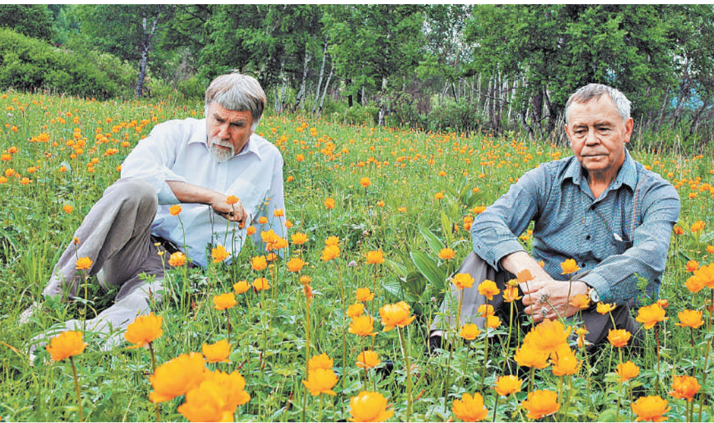
Два Валентина. С Валентином Распутиным во время съемок фильма Сергея Мирошниченко «Река жизни».