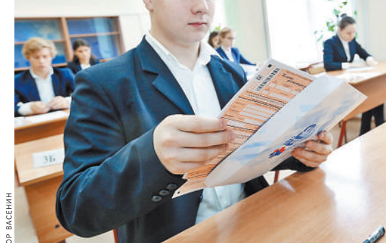
В Рособрназоре допускают создание внешкольных центров оценки качества образования.

Как будут оценивать знания? — Вузы создадут банк заданий, сами будут его модерировать, сами выбирать вопросы. Но располагаться он должен на площадке одного из наших подведомственных учреждений, — пояснил Анзор Музаев.