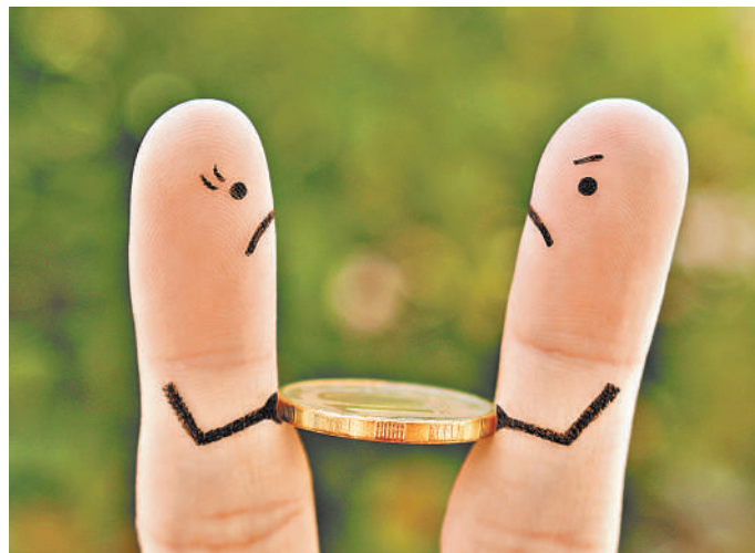
Подарки, сделанные в период романтической связи, в том числе деньги, — это не долг. Получить их назад, после того как связь прервалась, нельзя.

На практике суды иногда стали приравнивать выписки с банковских карт к распискам. Мол, раз деньги переведены и получатель не может объяснить, за что, то это заем, который положено вернуть. Однако на романтические отношения такой подход не распространяется. Теперь это официально признал Первый кассационный суд. Бросить любимой денег на карту или телефон — все