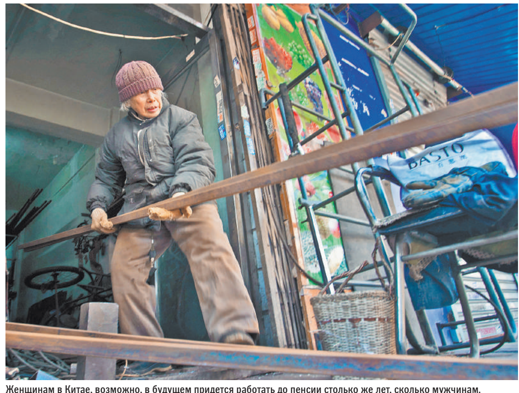
Женщинам в Китае, возможно, в будущем придется работать до пенсии столько же лет, сколько мужчинам.

В Москве состоялась презентация книги «70 лет славному пути отношений между Россией и Китаем», написанной нынешним послом в РФ Нго Дык Манем. Как сообщил дипломат, его книга охватывает все аспекты отношений двух стран на протяжении 70 лет, с момента установления дипотношений 30 января 1950 года — тогда Советский Союз одним из первых признал Демократическую Республику Вьетнам. «Я старался, чтобы в книгу вошло как можно больше архивных материалов, которые искал везде — в российских государственных и частных архивах, в ТАСС, РИА Новости», — рассказал посол. В книге содержится более 700 документов и снимков, собранных Нго Дык Манем в ходе кропотливых поисков. Книга состоит более чем из 600 страниц, написана на двух языках, вьетнамском и русском, и весит 4,2 килограмма. Как отметил присутствовавший на мероприятии глава Комитета Совета Федерации по международным делам Константин Косачев, «СССР и Россия всегда оказывали необходимую помощь братскому вьетнамскому народу... Вьетнам — единственная страна Юго-Восточной Азии, которую президент России Владимир Путин посетил пять раз, что говорит о нашем неподдельном интересе к Вьетнаму и потенциалу дальнейшего сотрудничества».