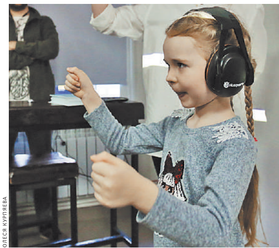
В интерактивных залах музея гости надевают шумозащитные наушники и исследуют «тихий» мир.