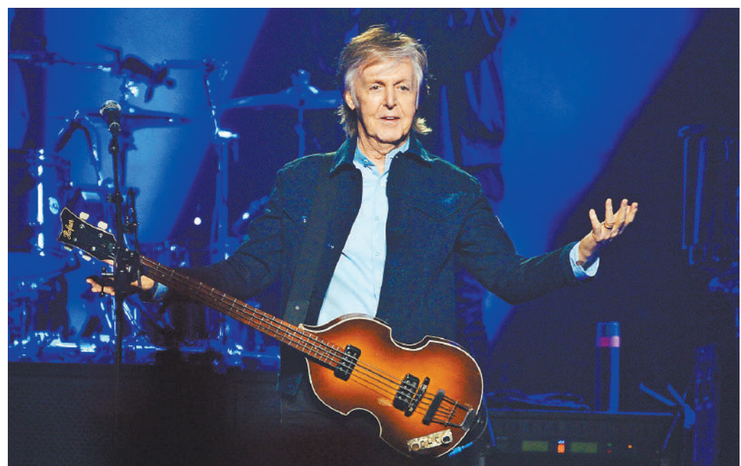
Пол Маккартни: Все, что у меня есть,—сотни песен, которые охватывают всю мою жизнь...