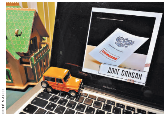
Списывать долги граждан за счет социальных выплат запрещено законом.

Женщина свои требования аргументировала статьей 70 Закона «Об исполнительном производстве» в редакции, которая действовала на день обращения в суд. Эта статья перечисляет случаи, когда банк может не исполнить требования пристава: если на счете нет денег, средства арестованы, операции приостановлены или в других ситуациях, предусмотренных федеральным законом. К последнему случаю относятся социальные выплаты, обращать взыскание на которые запрещает статья 101 Закона об исполнительном производстве.