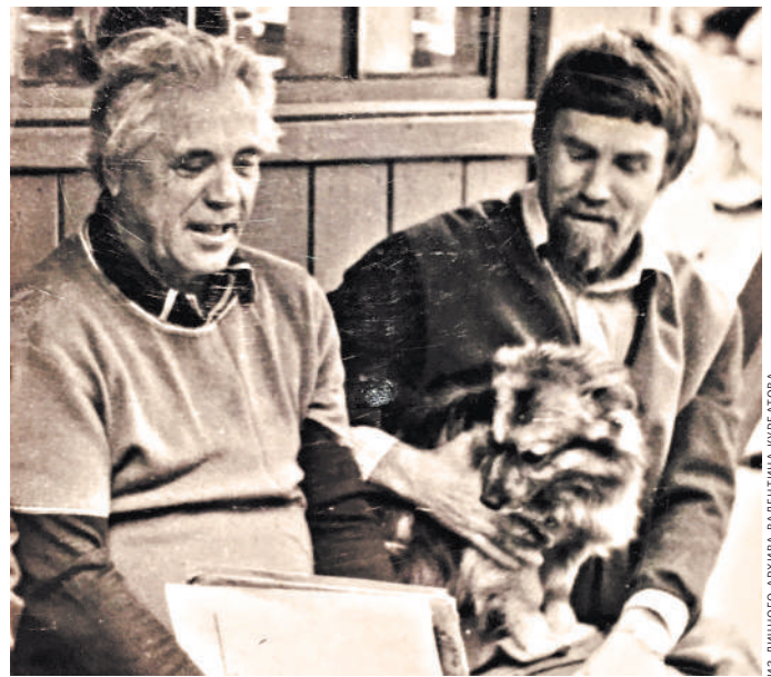
В Овсянке с Виктором Астафьевым.