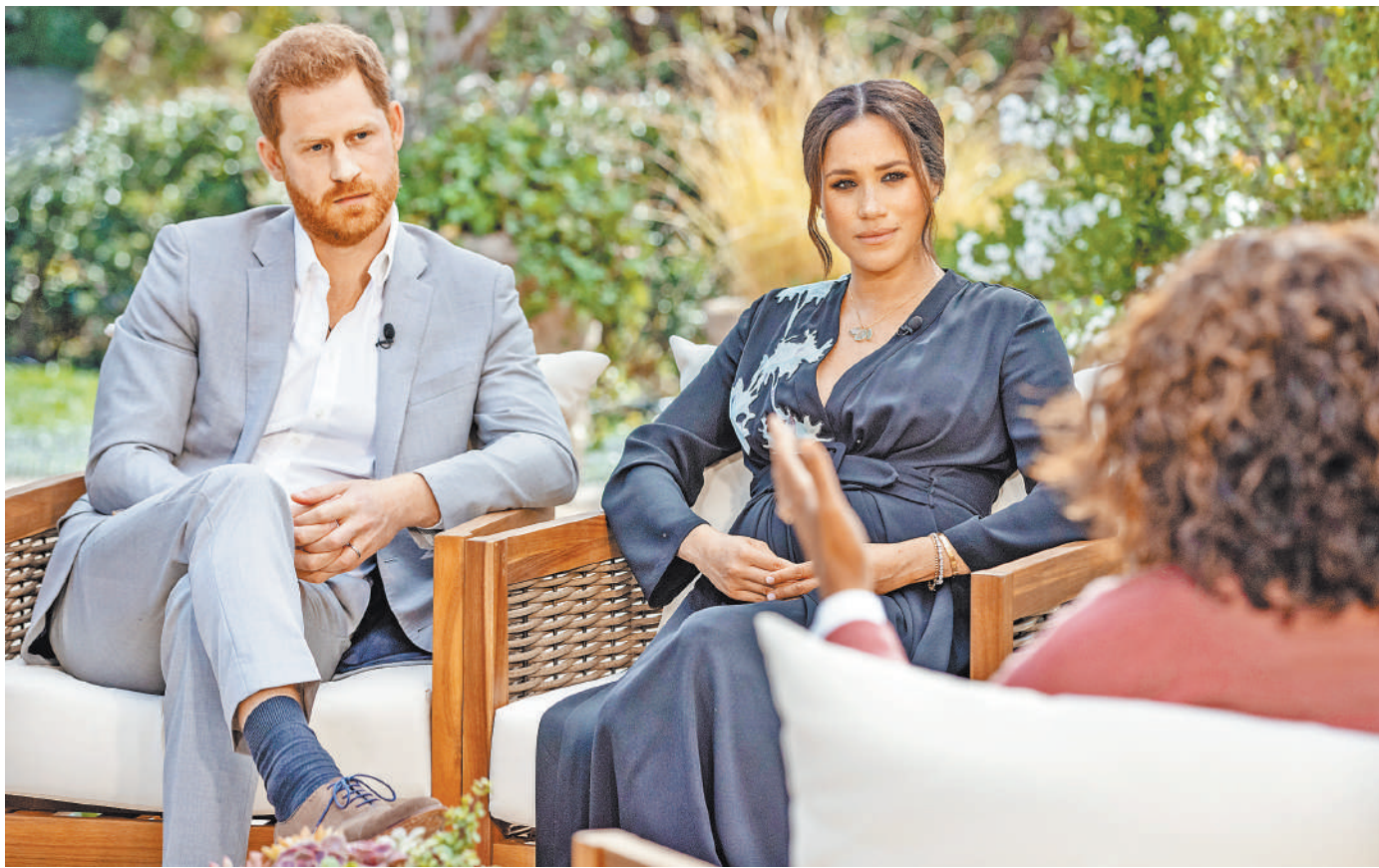
Принц Гарри и Меган Маркл разоткровенничались в первом после разрыва с Букингемским дворцом интервью, которое наделало шума еще до выхода.

«Фирма», как в ходе беседы герцог и герцогиня Сассекские назвали правящую династию, заранее готовилась к этим откровениям и накануне выхода интервью начала расследование очень вовремя появившихся в прессе заявления бывших подчиненных Меган, которые обвинили ее в травле и доведении до слез. «Они с готовностью дали, чтобы защитить других членов семьи, но не хотели говорить правду, чтобы защитить меня и моего мужа», — объяснила в ходе интервью Маркл.