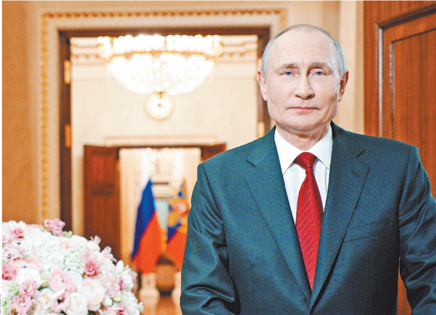
Владимир Путин пожелал российским женщинам здоровья и взаимопонимания с близкими.

Вчера президент Владимир Путин поздравил российских женщин с праздником. «Давние традиции празднования 8 Марта создают у всех особое настроение, символизируют наступление весны, утверждают роль женщин в нашей жизни, в сбережении тех истинных ценностей, которые во все времена были и, уверен, останутся вдохновляющим нравственным ориентиром», — заявил президент. «Вы приносите в этот мир гармонию, нежность, красоту и самое сильное — безусловную материнскую любовь», — подчеркнул он. «Забота о детях, тепло домашнего уюта, которым вы всегда стремитесь окружить своих родных, — все это нелегкий каждодневный труд. Он, конечно же, заслуживает самого высокого признания», — отметил Путин. Отдельно президент поздравил женщин-медработников. «В тяжелейших условиях эпидемии вы проявляете душевную щедрость и профессионализм, продолжаете трудиться с полной отдачей», — оценил он, поблагодарив врачей, фельдшеров, медсестер и нянечек, всех, кто спасает и выхаживает больных в «красных зонах», в составе экипажей скорой помощи, в больницах и поликлиниках. «Давно известно: чуткость, участие, внимательное, доброе отношение порой так же нужны, как лекарства. И вы дарите пациентам именно такую, истинно женскую, душевную поддержку», — сказал Путин. ■