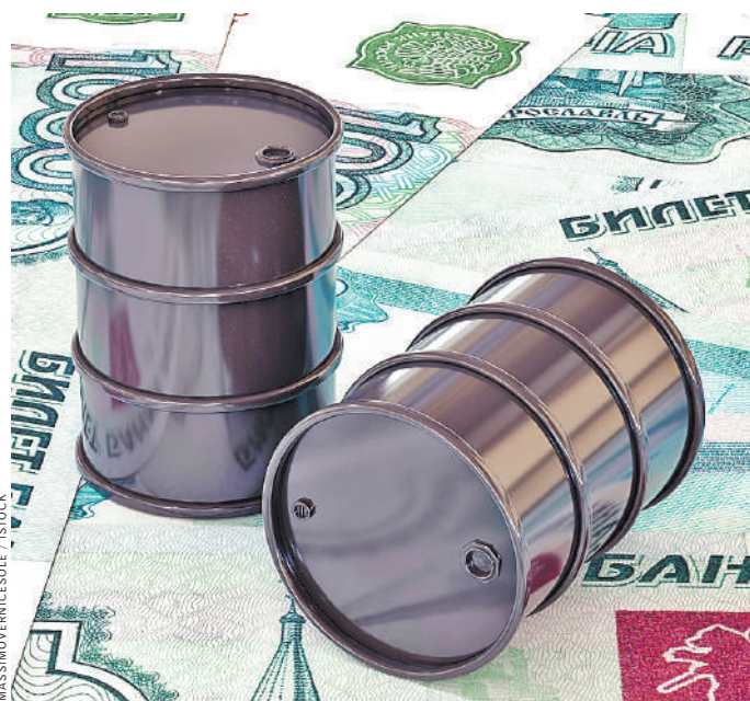
Высокая цена на нефть способствует укреплению курса рубля, но весьма ограниченно.