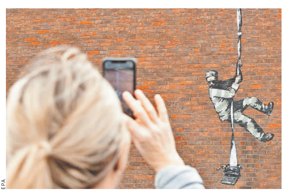
«Холстом» для новой работы Бэнкси стала стена бывшей тюрьмы в Реддинге, где отбывал срок писатель Оскар Уайльд.