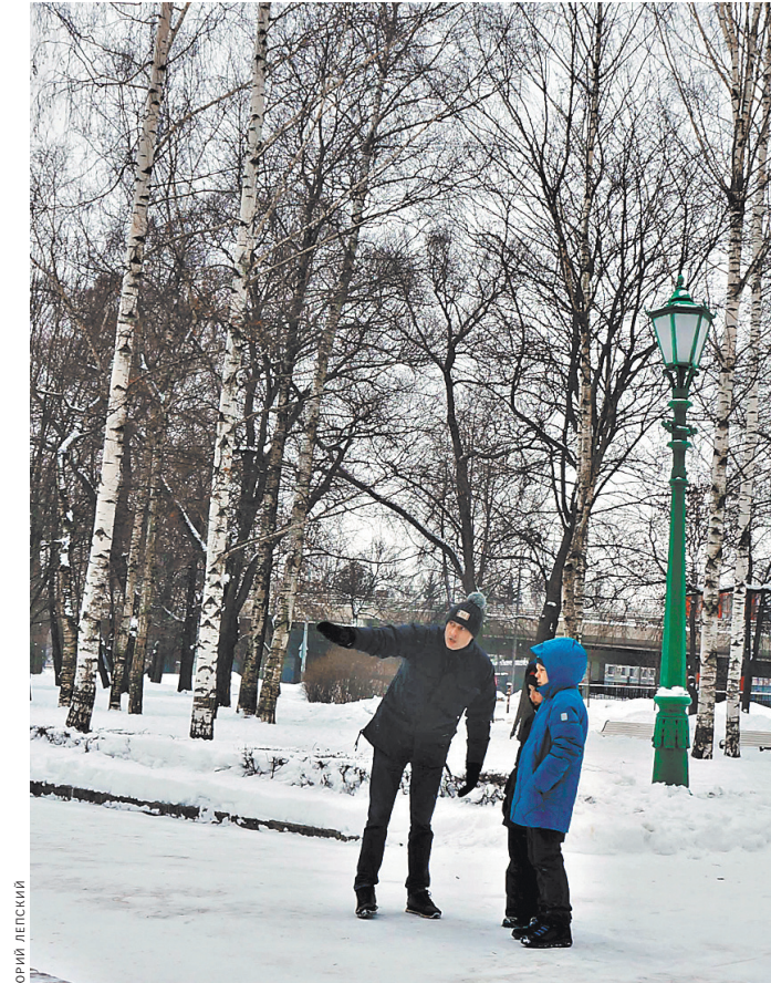
Возле Пушкина — отчаяние.