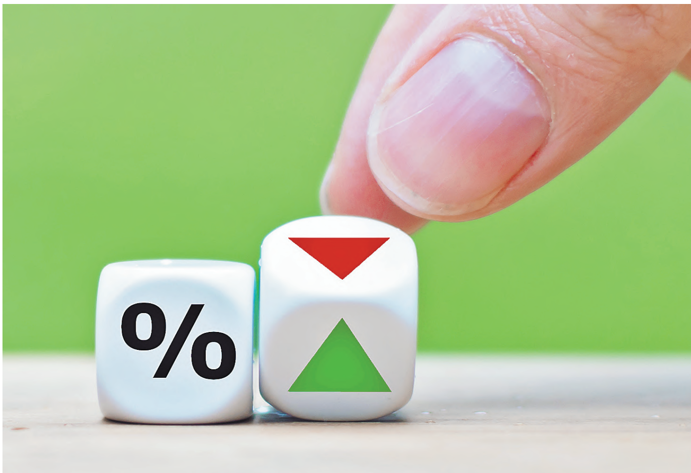
Такой высокой, как сейчас, инфляция в России не была уже шесть лет.