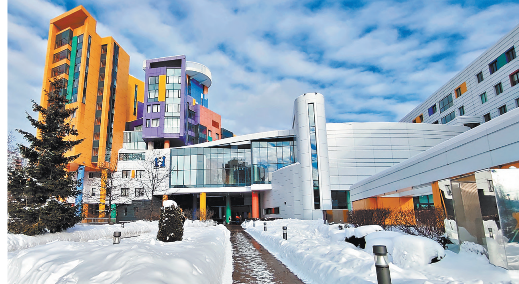
Вот так красив Центр помощи детям имени Димы Рогачева.