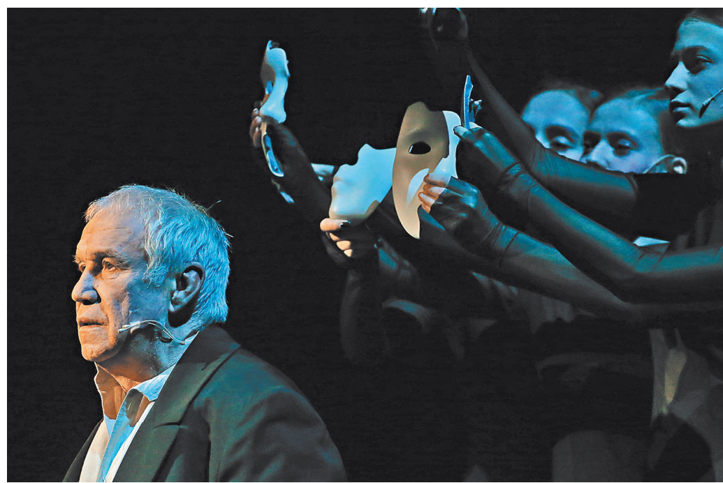
Герою Гармаша сочувствуешь, пытаешься поверить в его «великодушие», презираешь, пытаешься оправдать...

Смотрите фотопортрет на сайте rg.ru/sujet/1560