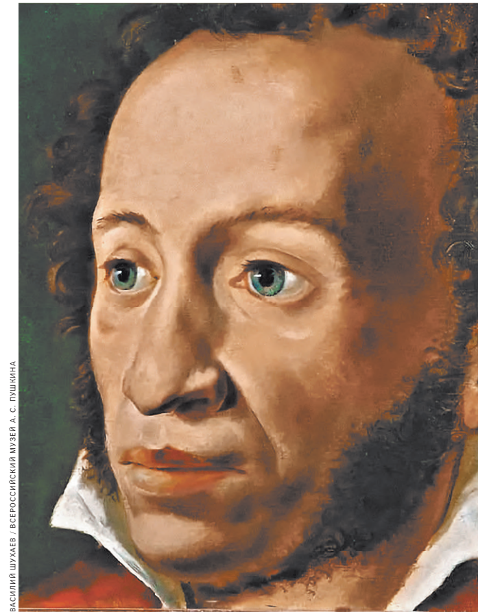
Возле Пушкина — отчаяние.