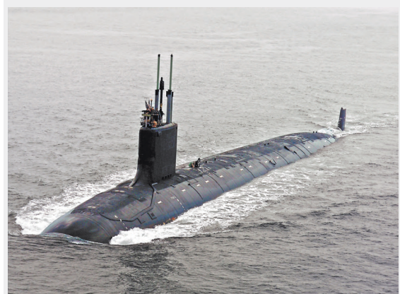
Подлодку ВМС США типа «Вирджиния» обнаружили в районе острова Уруп Курильской гряды.

В Главном управлении международного военного сотрудничества Минобороны России вручили ноту представителю аппарата военного атташе по вопросам обороны при посольстве США в Москве.