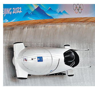
В понедельник и вторник два комплекта наград разыграют мастера бобслея.

07.05. Хоккей. Мужчины. Матч стартового раунда плей-офф. Прямая трансляция. 09.25. Скоростной бег на коньках. Мужчины. Женщины. Командные гонки преследования. Прямая трансляция. 11.50. Хоккей. Мужчины. Матч стартового раунда плей-офф. Прямая трансляция. 13.55. Лыжное двоеборье. Финальный вид — гонка преследования 10 км. Прямая трансляция. 14.35. Фристайл. Мужчины. Акробатика. Квалификация. Прямая трансляция.