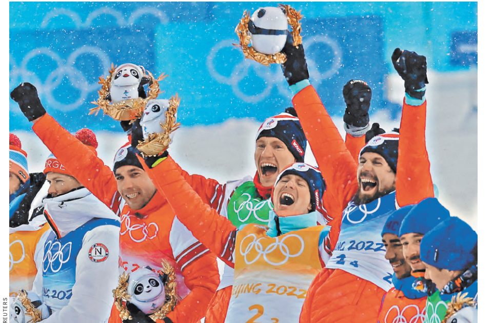
Российский лыжный квартет выиграл на финише у норвежцев более минуты — космический отрыв!