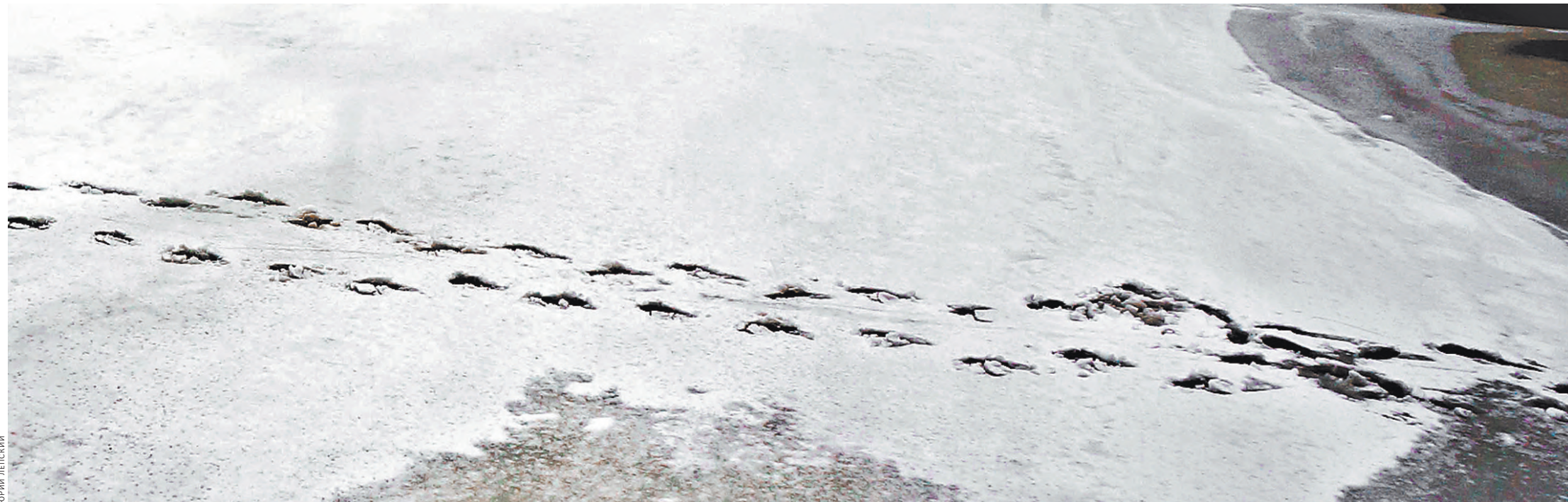
Шаги на льду замерзшей реки.