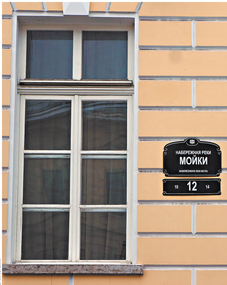
Окно его квартиры на набережной Мойки. Здесь он умер.