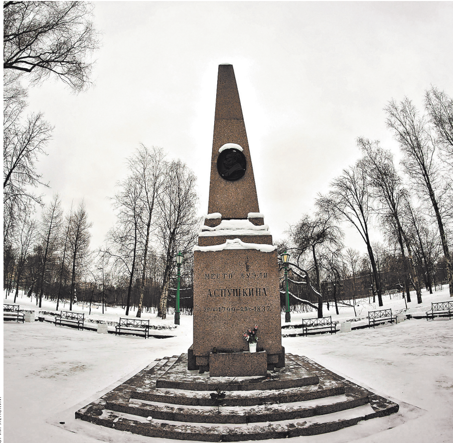
К этому месту каждый день приходят люди с цветами.

— Он очень рассчитывал на издание «Истории Пугачева». Это была важная часть его просветительского плана. Кроме того, он надеялся поправить свои денежные дела. Но публика не поняла и не приняла эту блестящую историографическую прозу. «Пугачева» не покупали. Издание понесло большие убытки, новые долги и разочарования. Он понял, что его не хотят слушать.