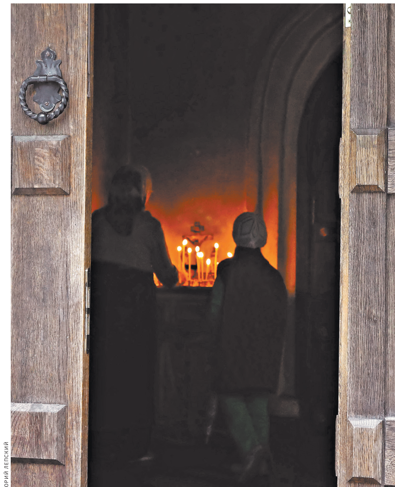
В Святогорском монастыре, где его могила, каждый день ставят свечи в память о нем.