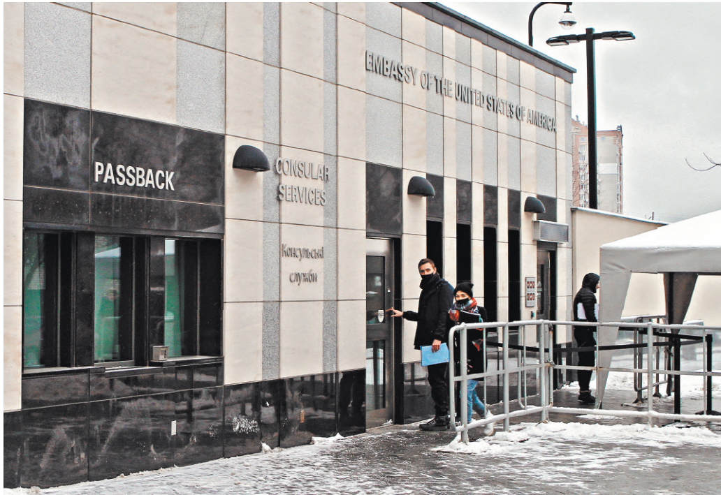
Посольство США в Киеве стремительно пустеет — большинство дипломатов покидают Украину.

Грядущее закрытие украинского неба для авиакомпаний также существует пока в наполовину подтвержденном статусе. Точно можно говорить о полной отмене рейсов на Украину нидерландской авиакомпании KLM.