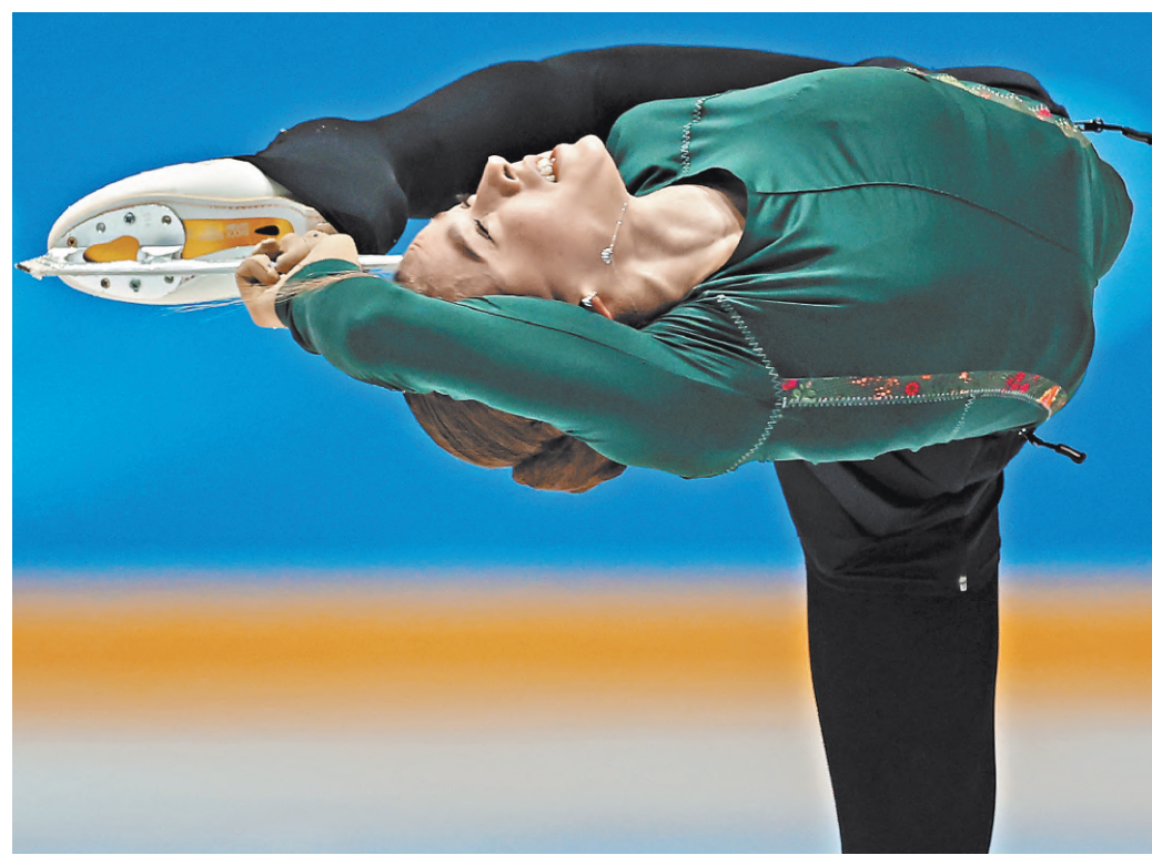
Даже в таких обстоятельствах Камила Валиева ежедневно выходит на тренировки и безошибочно выполняет сложные элементы и прыжки.

В этой ситуации Камилу поддержали все наши спортсмены и, конечно, официальные лица. ●