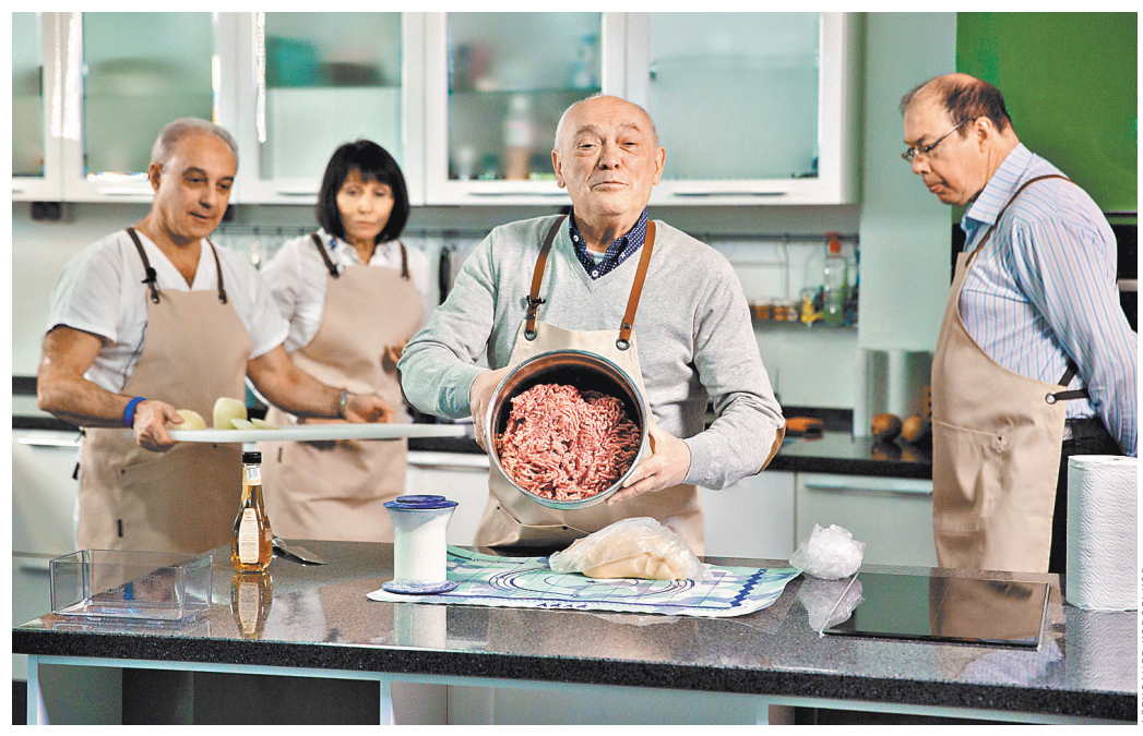
Юбилейные пельмени в восьми рук.