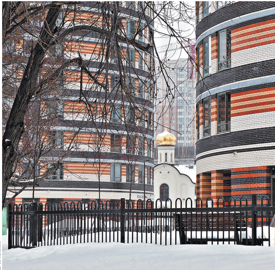
Часовенка среди домов и новостроек.