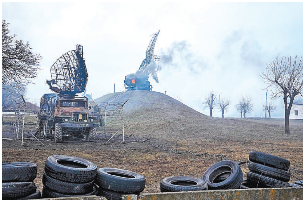
По данным Минобороны России, выведены из строя 83 наземных объекта военной инфраструктуры Украины.

В 13 часов по московскому времени обобщенную на тот момент картину происходящей на Украине специальной военной операции представил на брифинге официальный представитель Минобороны РФ генерал-майор Игорь Конашенков.