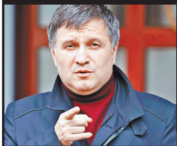
Бывший министр внутренних дел Украины Арсен Аваков.