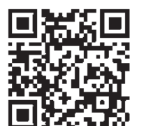
Фигуранты и материалы уголовных дел — на сайте СК РФ

Часть — отбывает наказание. Деятельность украинских военных и чиновников СК РФ расценивает как военные преступления. И считает, что за геноцид местного населения и разрушения гражданских объектов они должны ответить.