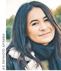
ИЗ ЛЮБИМОГО АРХИВА

— Мне 25 лет. Родилась в Оренбурге, там окончила медицинский колледж, приехала в Москву. В 15-ую больницу я пришла по объявлению в 2016 году. Устроилась в многопрофильное отделение. Два года в «красной зоне». Работаю сутками. Муж на год старше меня, работает у нас в реанимации. Сейчас я учусь в Малоякушевской академии физической культуры на реабилитолога. Очень надеюсь остаться работать в Филатовской больнице.