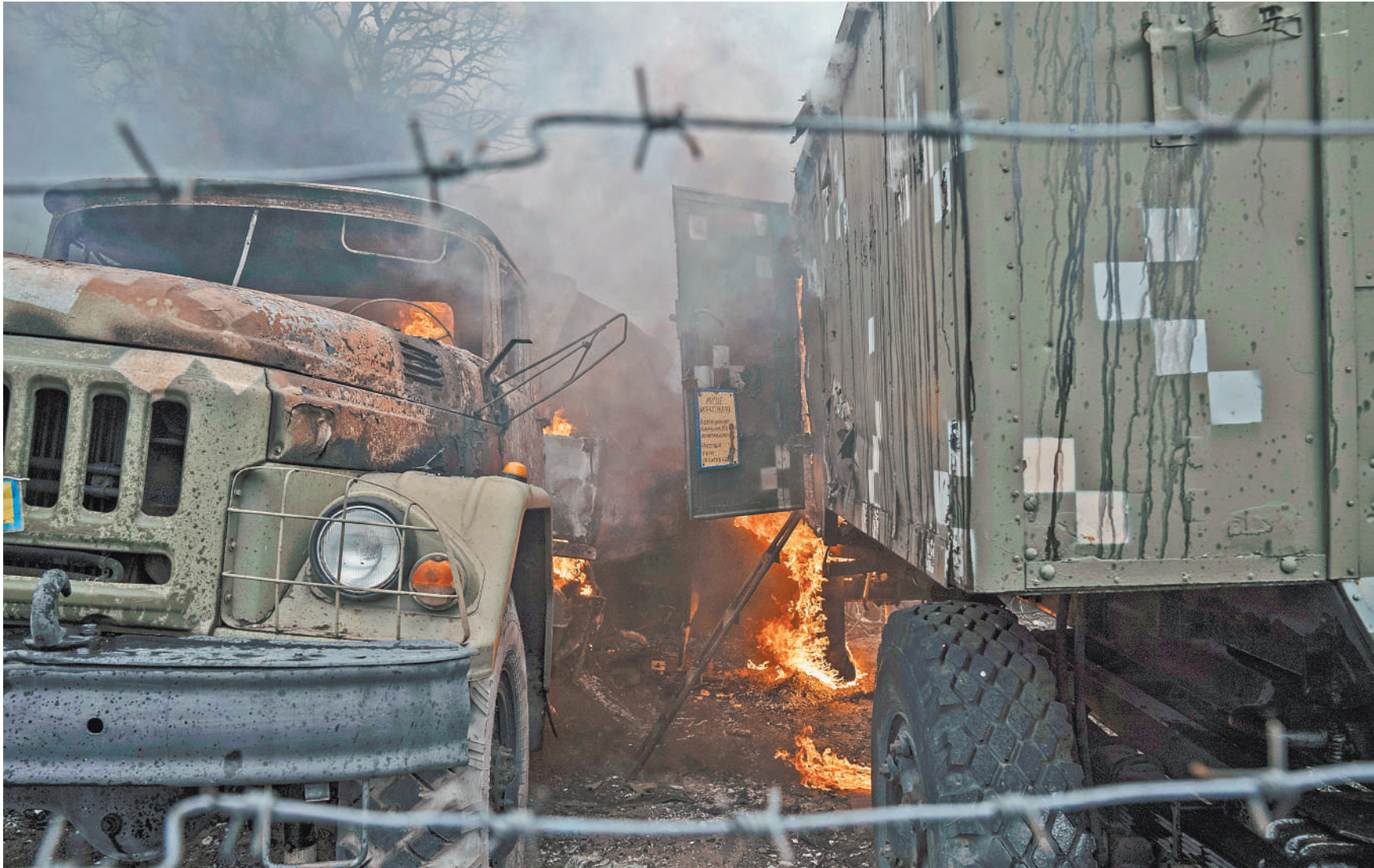
Даже в видеороликах, размещаемых самими украинцами, отчетливо видно, насколько точны были попадания ракет. Ни о каких горах трупов речи не идет, разрушены только военные объекты.

В ЛНР также, как ранее в ДНР, сообщили о нежелании украинских военных вступать в бой. «Зафиксировано несколько