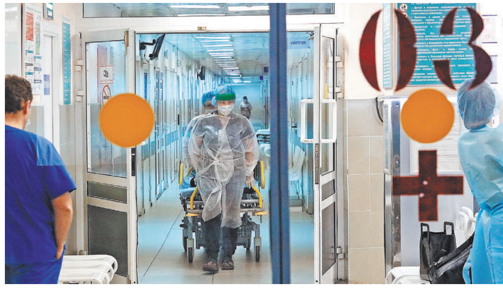
Это только один из коридоров 15-й больницы. За полчаса к ее воротам подъехало семь (!) «скорых».

В мирное можно и по палатам друг к другу пройти. А еще подключиться к местному кинотеатру — такой тоже есть в 15-й. Ничего подобного в «крас-