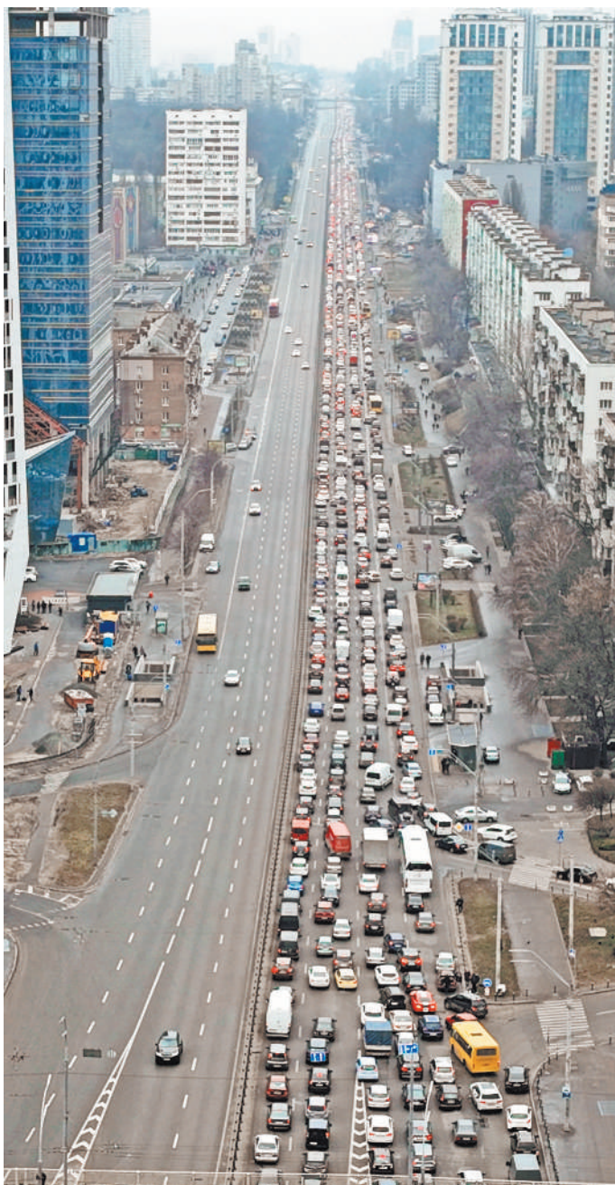
Жители Киева массово бросились уезжать из города, наслушавшись пропаганды властей. Хотя ни одного танка или солдата из РФ замечено не было.