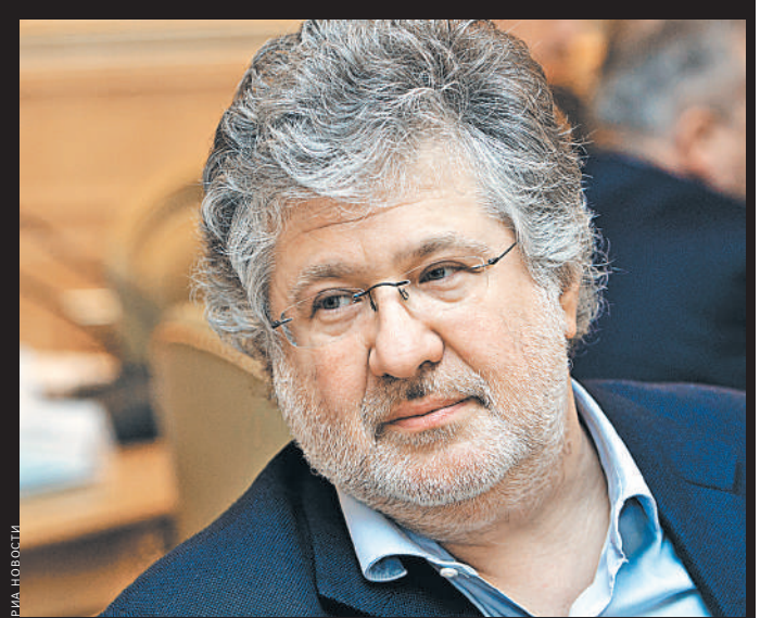
Игорь Коломойский — олигарх и экс-глава Днепропетровской области.