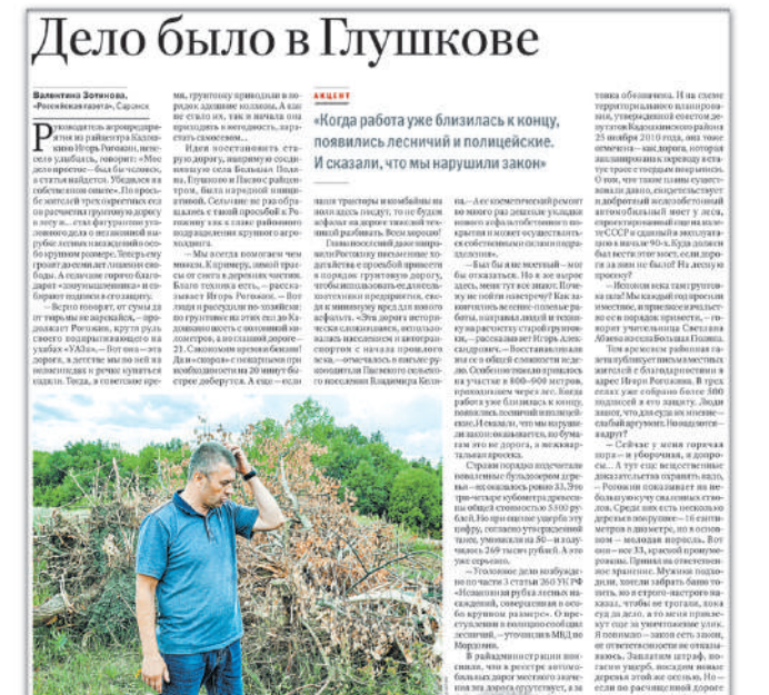
«По закону — правильно, а по сути — издевательство», — так охарактеризовала Татьяна Москалькова ситуацию, описанную в этой публикации «РГ».

—Видео смотрите на сайте rg.ru/art/2270166