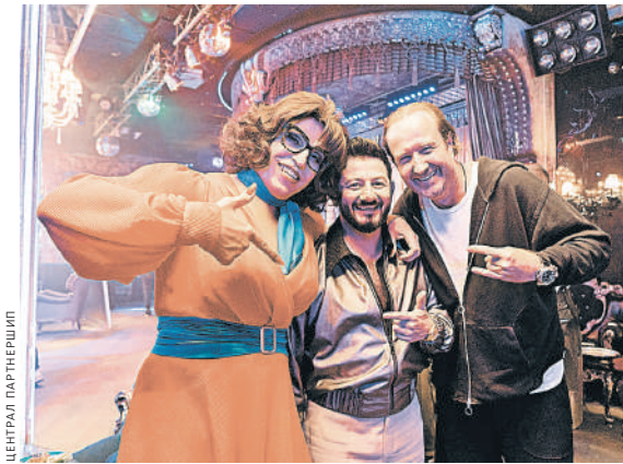
Нашествие «комедий легкого поведения» превращает когда-то неглупое кино в филиал провинциальных «камеди-клубов».

И прокатчики оказываются, как всегда, правы.