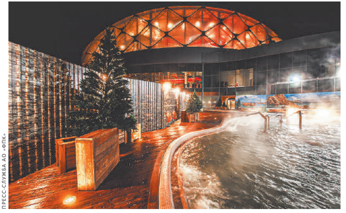
Купание в горячих источниках зарядит туристов энергией на долгое время.