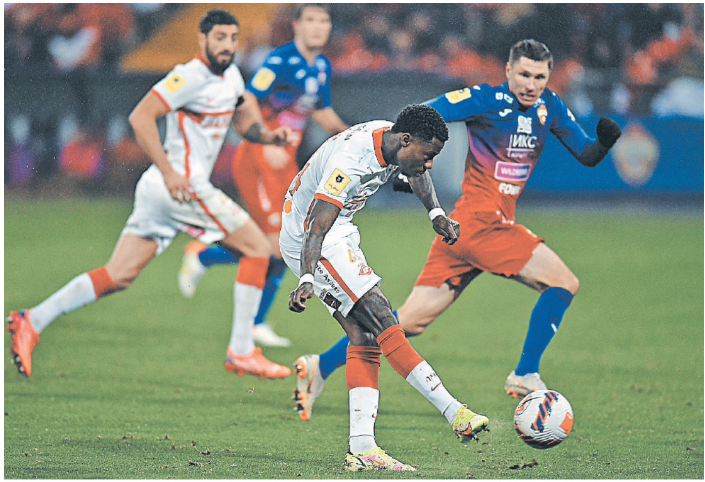
В матче первого круга «Спартак» уступил ЦСКА со счетом 0:1.

Между тем седьмая ракетка мира Андрей Рублев пробился в Дубае в полуфинал. Соперником Андрея был американец Маккензи Макдональд. Тот самый, который в стартовом круге вылез из борьбы прошлогоднего победителя турнира Аслана Карацева (7:5, 6:3). Первый сет у Рублева Макдональд, занимающий 61-е место в мировом рейтинге, взял со счетом 6:2. Однако потом россиянин сумел перехватить инициативу и перевернуть ход игры. В итоге встреча, продолжавшаяся 1 час 45 минут, осталась за Андреем — 2:6, 6:3, 6:1. ●