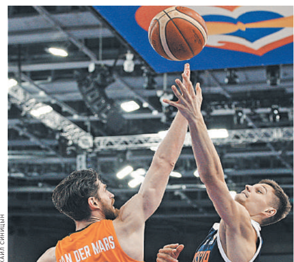
Игра с командой Нидерландов сложилась в целом непросто, а победили россияне за счет ударной третьей четверти.

Противостояние вчерашних оппонентов продолжится в воскресенье, когда они проведут новую встречу уже на гостевой для нас площадке в городе Алмере. ●