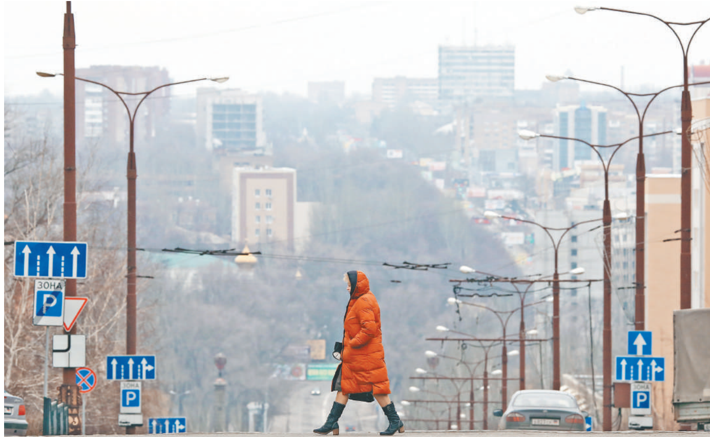
Раньше на этой улице Донецка было так оживленно.

ровцев. Я родился в 1968 году в Кривом Роге, в микрорайоне Южок. В свидетельстве о рождении написано, что мама и папа украинцы. Я сам считаю себя украинцем. Кстати, в Кривом Роге я какое-то время жил по соседству с семьей Зеленского. Мне было 23 года, а Зеленский — папан в возрасте 7–8 лет ездил по двору на велике. А вообще мой пра-пра-прадед — один из создателей Запорожской Сечи на острове Хортица. Я ассоциирую себя с казаком древнего рода. И думаю, если в Украине меняется власть, Россия с Украиной смогут жить в мире и согласии.