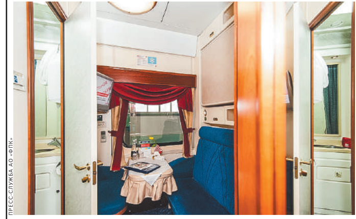
Путешествие в вагоне-люкс ничем не уступит отдыху в 5-звездочном отеле.

А дальше — обратный путь до Москвы. Оформить билеты на туристический поезд «В Сибирь» можно в железнодорожных кассах, на официальном сайте РЖД и в мобильном приложении «РЖД Пассажирам». Что касается экскурсионной программы, то здесь есть варианты. Можно купить пакетный тур, в который входит проезд на поезде, экскурсионная программа с гидом, трансфер и питание. Это можно сделать на сайте «РЖД Тур». Желающие могут спланировать культурную программу самостоятельно, приобрести только билеты на поезд. Также можно заказать у проводника дополнительные экскурсии прямо в пути следования. Торопитесь, пока билеты в круиз на поезде «В Сибирь» еще есть. ●