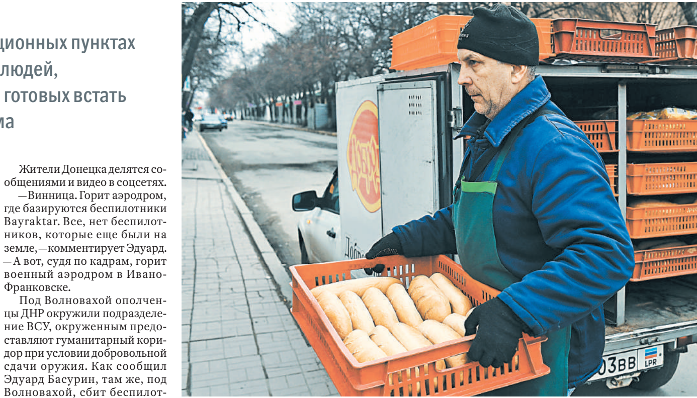
А в Луганске белый хлеб точно по расписанию.

Жители Донецка делятся сообщениями и видео в соцсетях. — Винница. Горит аэродром, где базируются беспилотники Вуайракт. Все, нет беспилотников, которые еще были на земле, — комментирует Эдуард. — А вот, судя по кадрам, горит военный аэродром в Ивано-Франковске.