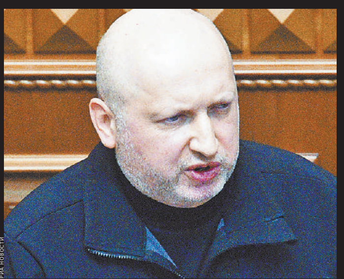
Александр Турчинов — бывший председатель Верховной рады.