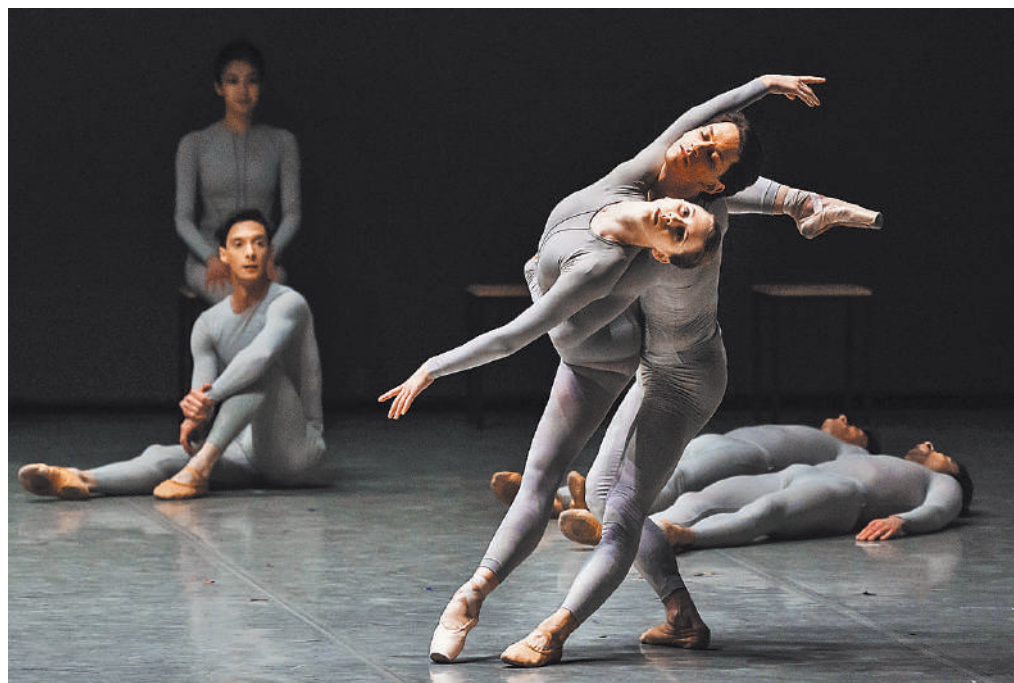
ПЕРМСКИЙ АКАДЕМИЧЕСКИЙ ТЕАТР ОПЕРЫ И БАЛЕТОВ. ИРИЖИ КИЛИАН

Открывает программу «Свадебка», которую сам хореограф определил как «маленькую сумасшедшую свадьбу». Полуритуальное, полуфантазийное действие он запускает с сумасшедшей