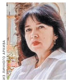
ИЗ ЛЮБИМОГО АРХИВА

— Я родилась в машине скорой помощи. Бригада не успела доставить маму в родильный дом. Пеленок не было, и врач, принимавший роды, снял белый халат и завернул в него меня. Можно сказать, что это было первое мое знакомство с профессией. Окончила медицинское училище № 8, с 1997 года работаю в 15-й больнице. Начала как медицинская сестра у врача-невролога. Потом перешла в процедурный кабинет. Участвовала в открытии прививочного кабинета, организовывала работу диспансерного кабинета. О работе КДЦ знаю почти все, и горда, что тружусь здесь уже 24 года. Конечно, в пандемию забот и трудностей прибавилось. Иногда казалось, еще чуть-чуть, и не выдержу навалившихся испытаний. Но побеждали любовь к профессии и взаимопомощь сотрудников.