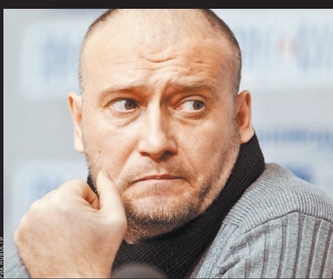
Дмитрий Ярош — лидер запрещенного в нашей стране «Правого сектора».