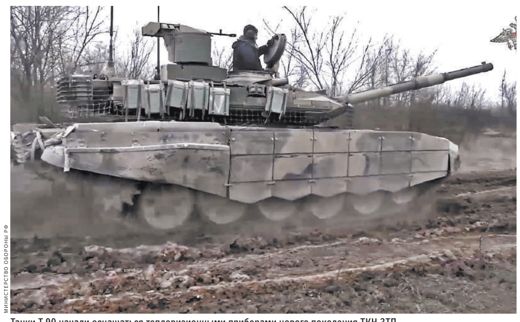
Танки Т-90 начали оснащаться тепловизионными приборами нового поколения ТКН-3ТП.

ходные артиллерийские установки, бронированную и автомобильную технику, склады военого имущества и боеприпасов, которые украинские боевики устраивают в частных жилых секторах школ и больниц. Для поиска целей и их распознавания «Орланы» оснащены мощной камерой и тепловизором. Сам беспилотник переносится в контейнере. Собирают его за несколько минут, взлететь он может с любого места, где можно установить стартовую катапульту. Беспилотники активно применяются с самого начала специальной операции и зарекомендовали себя как незаменимое средство разведки и корректировки огня. ■