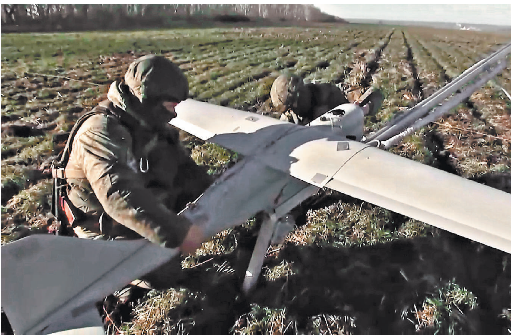
В процессе сбора развединформации о противнике расчеты многофункциональных беспилотников «Орлан-10» занимаются «вычислением» в зоне СВО украинских абонентов сотовой связи.