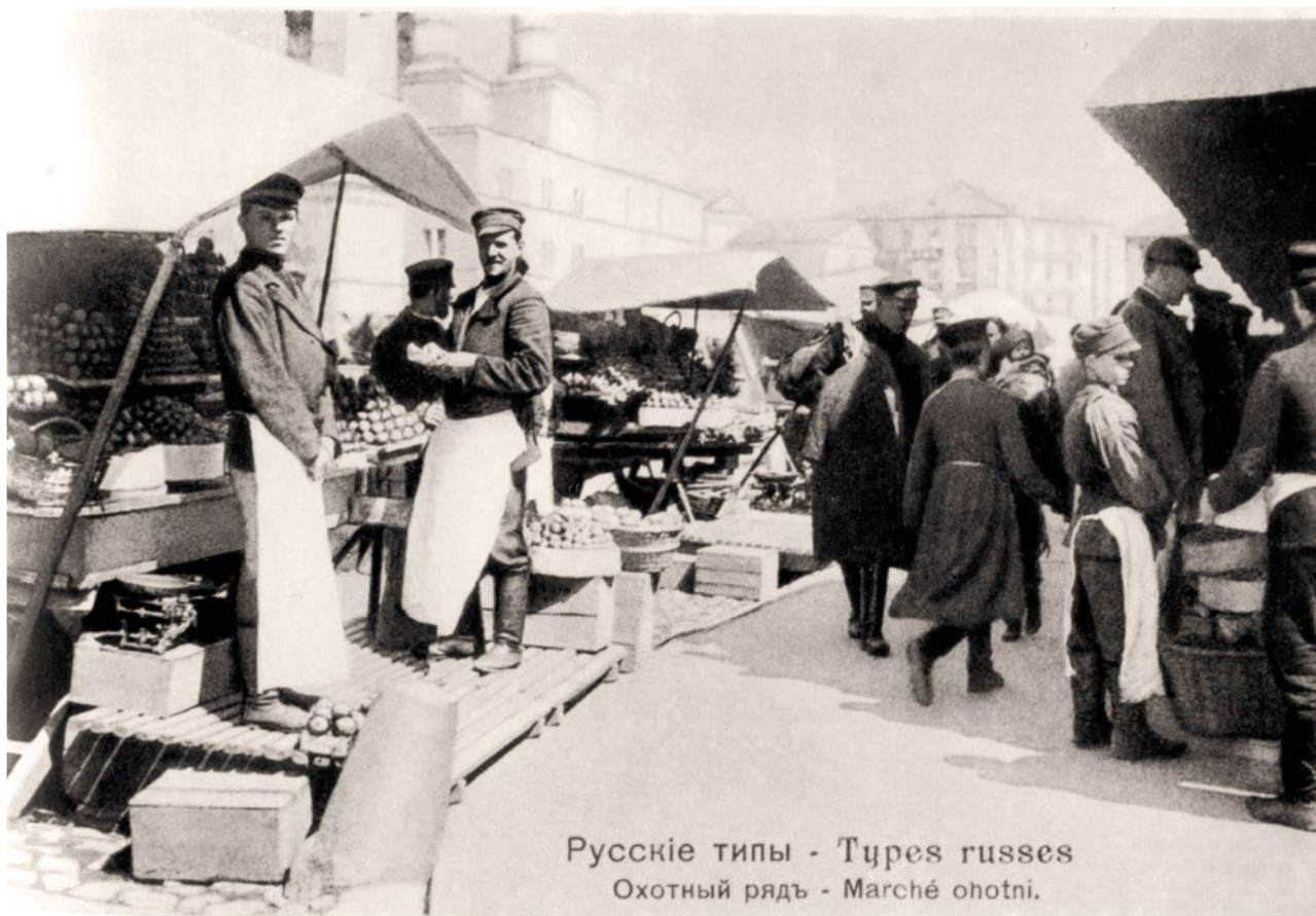
Русские типы - Types russes Охотный рядъ - Marché ohotni.

Осмотрев лавки, комиссия отправилась на Монетный двор. Посредине его — сорная яма, заваленная грудой животных и растительных гниющих отбросов, и несколько деревянных срубов, служащих вместо помойных ям и предназначенных для выливания помоев и отбросов со всего Охотного ряда. В них густой массой, почти в уровень с поверхностью земли, стоят зловонные нечистоты, между которыми