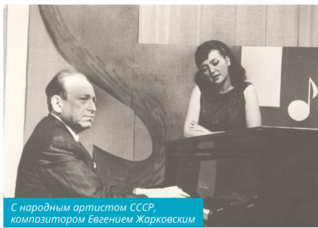
С народным артистом СССР, композитором Евгением Жарковским

— Когда говорят о советских артистах, которые давали концерты в Афганистане, обычно вспоминают Иосифа Кобзона.