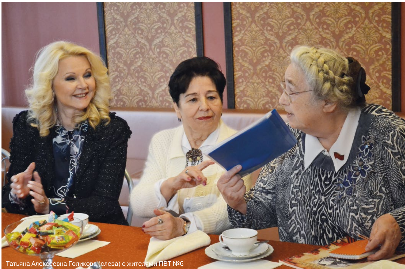
Татьяна Алексеевна Голикова (слева) с жителями ПВТ №6

Мнение заместителя председателя Правительства РФ поддержали все жители ПВТ № 6. Они уверены, что в учреждении им предоставлено все самое необходимое. Каждый из них особенно ценит возможность реализовать себя и свои таланты. Так, жители пансионата танцуют, поют, рисуют пейзажи и натюрморты, пишут стихи и прозу. Из рукописных творений они даже собрали целый сборник, повествующий о судьбах ветеранов учреждения. И, по словам создателей, эта книга — настоящее произведение искусства, истинный кладезь человеческой души. Ведь у каждого за плечами своя большая и интересная история.