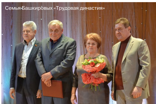
Семья Башкировых «Трудовая династия»