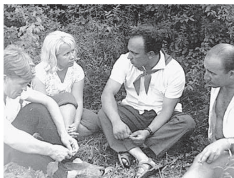
Конец 1960-х. Александра Пахмутова в «Орленке».

Те, кто прошел через этот лагерь, повсюду. Не вспоминая о педагогике,