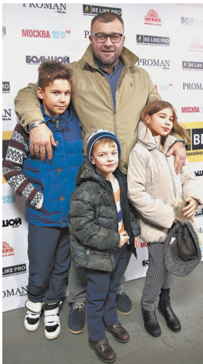
Михаил Пореченков с детьми.

— Вы работали и в Голливуде. Вот где, наверное, такая индустрия налажена и работает как часы... — Голливуд — мечта многих актеров. Я там снимался две недели в фильме «Марафон» режиссера Карена Оганесяна. Но, честно говоря, был сильно разочарован. То, что я увидел, разительно отличалось от мифа, царящего в мире и, наверное, самими американцами созданного. Например, знаменитая