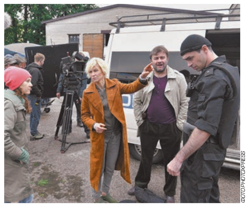
Михаил Пореченков, Ингеборга Дапкунайте на съемках телефильма «Мост».

Но точно так же я готов поддержать тех, кто борется за несправедливость в моей собственной стране. Коррупция, плохие дороги — враги ничуть не меньше, чем зло, которое творится где-то там, в далеких краях.