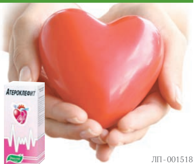
ЛП - 001518

И что самое важное — Атероклефит имеет более высокий профиль безопасности, чем статины! Принимайте натуральное лекарство Атероклефит — пусть сосуды будут чистыми, а сердце здоровым! Холестерин может быть в норме и без статинов!