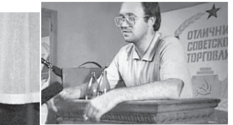
1 Илья Кормильцев с Вячеславом Бутусовым. 2 С флейтистом Олегом Сакмаровым. 3 Поэт Илья Кормильцев на Первом Московском Международном книжном фестивале. 2006 год.