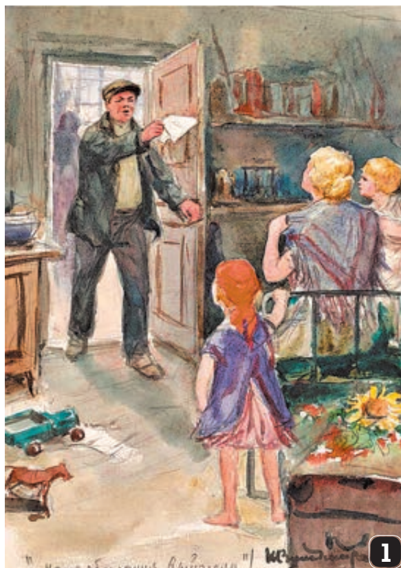
1 «Наша облигация выиграла!», 1940-е годы. 2 «У рожденья», 1920-е годы. 3 «Лед тронулся», 1910-е годы.