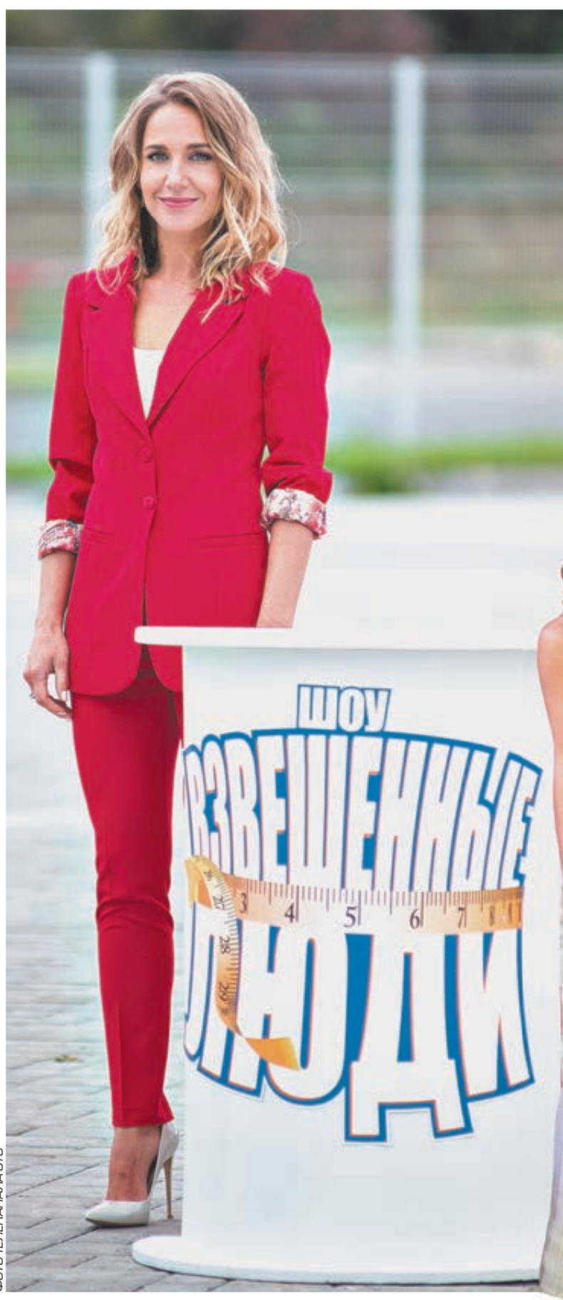
ФОТО ЛЕВНАЧАЛА СТС

— Полная женщина всегда чувствует себя неуютно рядом со стройной. Вы не ловили на себе косые, завистливые взгляды участниц?