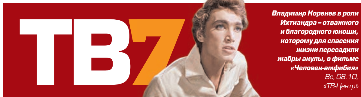
Владимир Корнев в роли Иктиандра – отважного и благородного юноши, которому для спасения жизни пересадили жабры акулы, в фильме «Человек-амфибия»