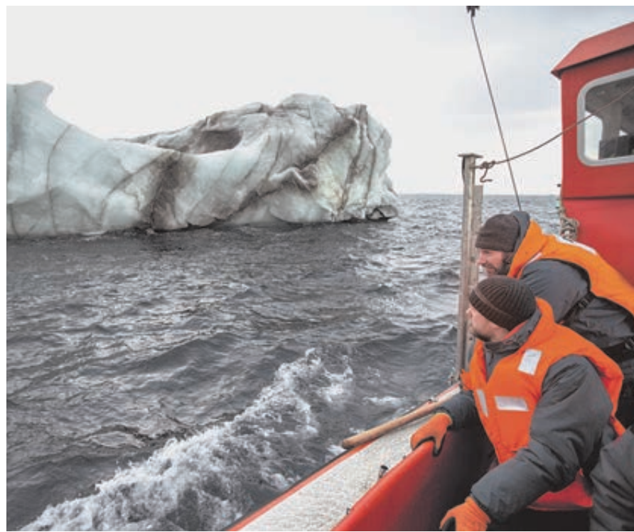
Участники экспедиции исследуют надводную часть айсберга, под которой скрывается стометровая толща льда.