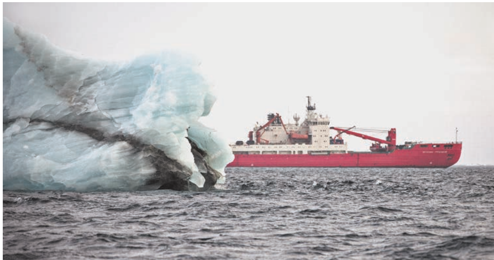
Буксир всегда готов отвести айсберг на безопасное расстояние.

Ученые завершили программу исследований ледников на архипелагах Новая Земля, Северная Земля, островов Де-Лонга и Земле Франца-Иосифа. Произведенная радиолокационная съемка и аэрофотосъемка