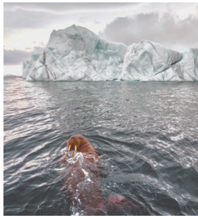
Специалисты «Роснефти» взяли под защиту всех обитателей Арктики.