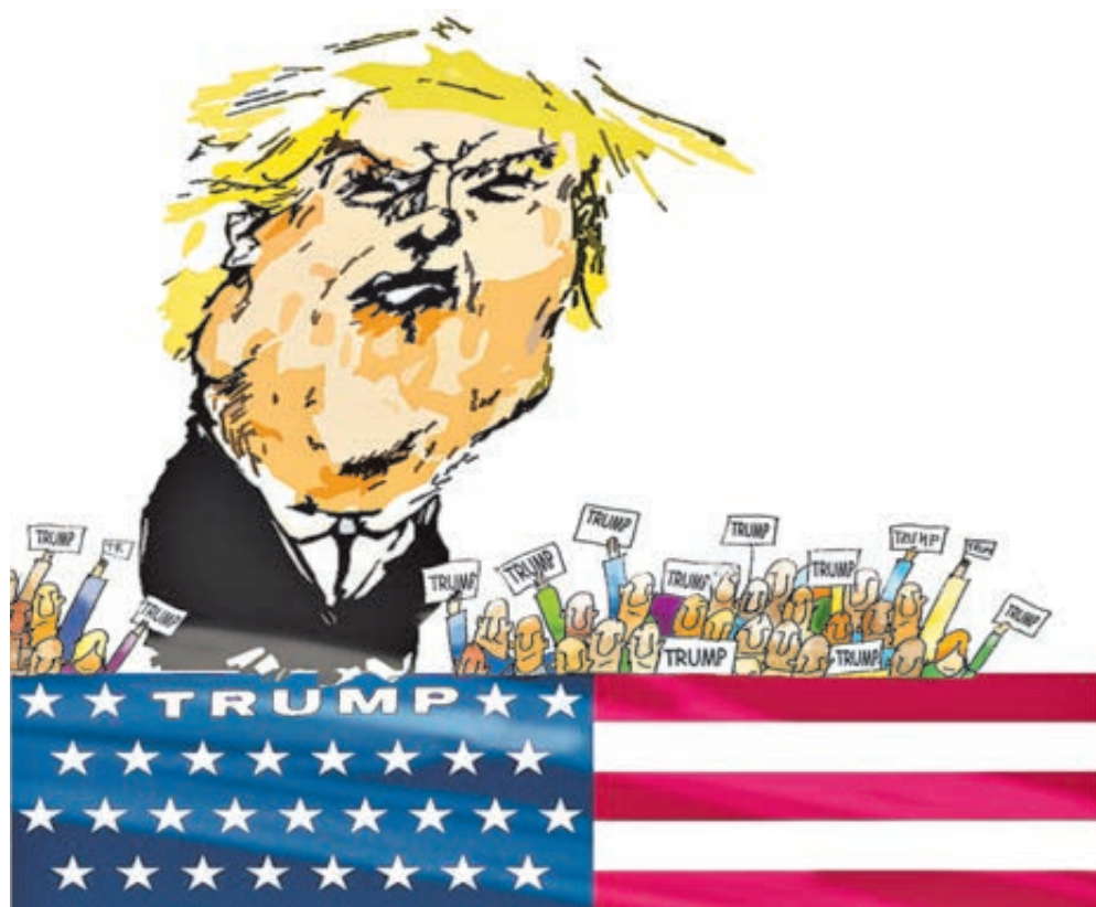
ИЛЛЮСТРАЦИЯ АНДРЕЯ КУЛИКОВА/СЕРТОНБАНК.РУ