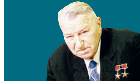
СЕРГЕЙ АФАНАСЬЕВ КОСМИЧЕСКИЙ МИНИСТР