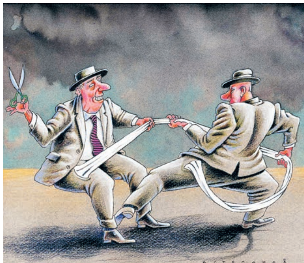
ИЛЛЮСТРАЦИЯ ВЛАДИМИРА СТЕПАНОВА/САЙТООБЪЕДИНИТЕЛЬ.RU

Министерство экономики закончило работу над Стратегией пространственного развития, в которой предлагается поделить страну на 14 макрорегионов – вместо нынешних восьми федеральных округов. Целью нового дедела объявлено «раскрытие социально-экономического потенциала территорий» за счет экономической специализации регионов.