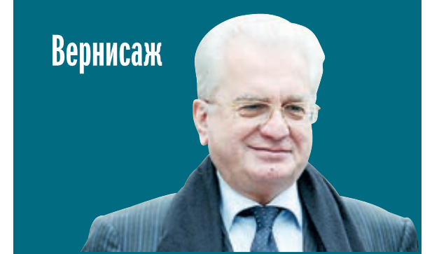
МИХАИЛ ПИОТРОВСКИЙ ДИРЕКТОР ГОСУДАРСТВЕННОГО ЭРМИТАЖА

– Нет, еду из Лихтенштейна в Гштад, у нас с Гергиевым европейский тур с Первым концертом Чайковского. Потом Монако – сольный концерт. И уж затем – домой в Иркутск! ☐