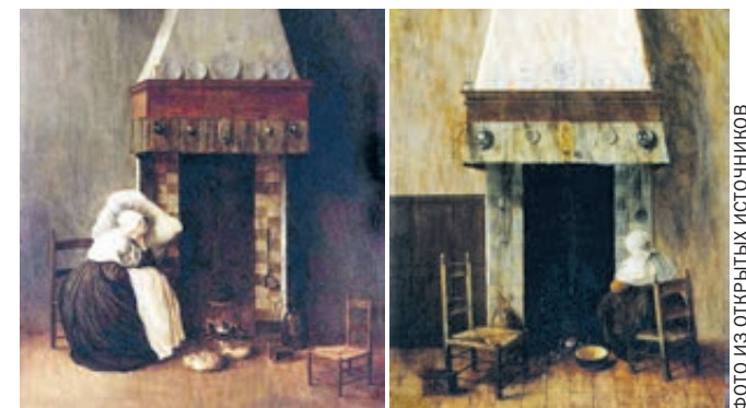
На эрмитажной и на лейденской картинах Якоба Врела – скромное жилище одинокой пожилой женщины и она сама, сидящая у камина...

– Один рисунок – самого Рембрандта, он логично вписывается в вернисаж. Автор второго – Леонардо да Винчи. Творчество великого итальянца не принадлежит, как понимаете, к искусству голландского «золотого века». Но было бы неправильно не показать