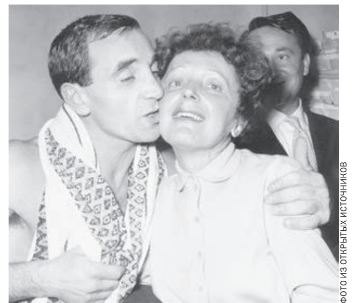
Азнавур с Эдит Пиаф. Такие молодые, такие живые...

В Гюмри (бывший Ленинакан) ему открыли памятник. Шарль присутствовал на торжестве и лично сорвал со скульп-