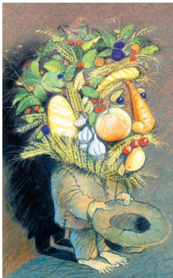
ИЛЛЮСТРАЦИЯ АЛЕКСАНДРА СЕРГЕЕВА/CARTOONBANK.RU

В связи с этим сейчас с подачи Минсельхоза РФ правительство рассматривает поправки, которые призваны скорректировать существующую систему льготного кредитования сельхозпроизводителей. Основная цель – взять под контроль расходование предоставленных денежных ресурсов и минимизировать их нецелевое использование.