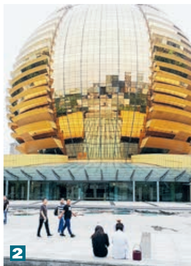
1 Деловой центр Ханчжоу. 2 Золотое «яблоко» конгресс-холла построили к встрече лидеров G20. 3 Китайцы пересели с велосипедов на электромоторы.