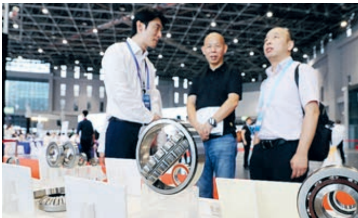
Один из сотрудников персонала выставки демонстрирует подшпиковую продукцию посетителям во время встречи по установлению контактов между производителями и покупателями высококачественного интеллектуального оборудования.

В 2017 году импорт Китая составил 10,2% от общего объема мирового импорта