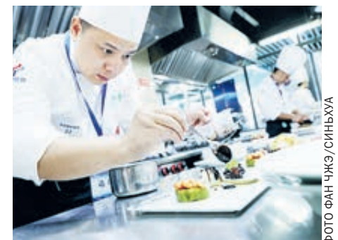
Лучшие повара боролись за право обслуживать гостей и участников импортного ЭКСПО. В соревновании приняли участие более 100 человек.

У РЭЦ запланирована масштабная программа участия в ЭКСПО.