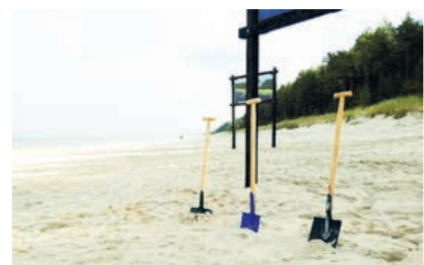
Сегодня попасть из Балтийского моря в Вислинский залив можно только по российскому каналу в Балтийске. Но Польша решила идти своим путем.

Многие эксперты считают этот проект не экономическим, а прежде всего – политическим. В нем усматривают очередное проявление недружелюбия, которое Польша демонстрирует в адрес России в последние годы. Выражается и такое опасение. Дескать, где гарантия, что мас-