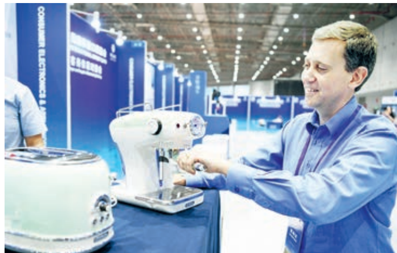
Участник выставки демонстрирует кофемашину во время встречи для установления связей, приуроченной к Китайской международной импортной ярмарке.

Президент по Азиатско-Тихоокеанскому региону немецкого производителя автозапчастей ZF Андреас Веллер сказал, что компания представит на выставке последние технологии автономного вождения. «Это большая честь для ZF принимать участие в 1-й CIIE, которая является важным каналом дальнейшего повышения открытости для нас и китайской экономики», – сказал он. Американский гигант химической промышленности DuPont продемонстрирует свои умные