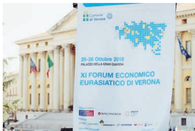
Выставочный центр Вероны.

Этот вывод очевиден при анализе «цены» санкций и их бенефициаров. Так, на США пришлось лишь около 0,6% потерь от введенных против России санкций, в то время как на Герма-