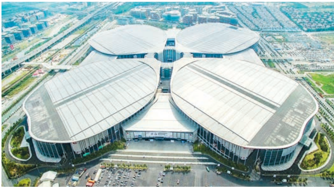
Национальный выставочно-конференционный центр в Шанхае, где будет проходить Китайская международная импортная ярмарка (CIIE).

Энтузиазм экспонентов превзошел все ожидания. «Вся площадь, где будут расположены