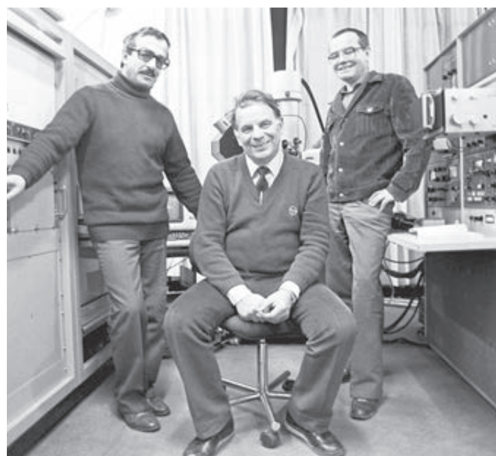
1984 год. Ученые Физтеха Самуил Конников, Жорес Алферов и Алексей Гореленок.

Большую международную конференцию в понедельник, 29 октября, откроет академик, лауреат Нобелевской премии Жорес Алферов. Он возглавлял Физтех с 1987 по 2003 год. В знак особого уважения к юбилею альма-матер советской физики президиум РАН проведет 2 ноября в исторических стенах Физтеха выездное заседание.