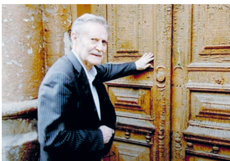
Кадры из фильма. Юрий Соломин у тех самых дверей, где когда-то встречал только что родившегося брата Виталька.

– Я объехал много городов и стран, но такого кладбища не видел нигде, – делится Юрий Мефодьевич. – Чита лежит в чаше сопки, и 15 мая, когда мы приехали, там цвел багульник. Его видно прямо из самолета: огромные кусты окрашивают склоны в розовато-зеленые тона.