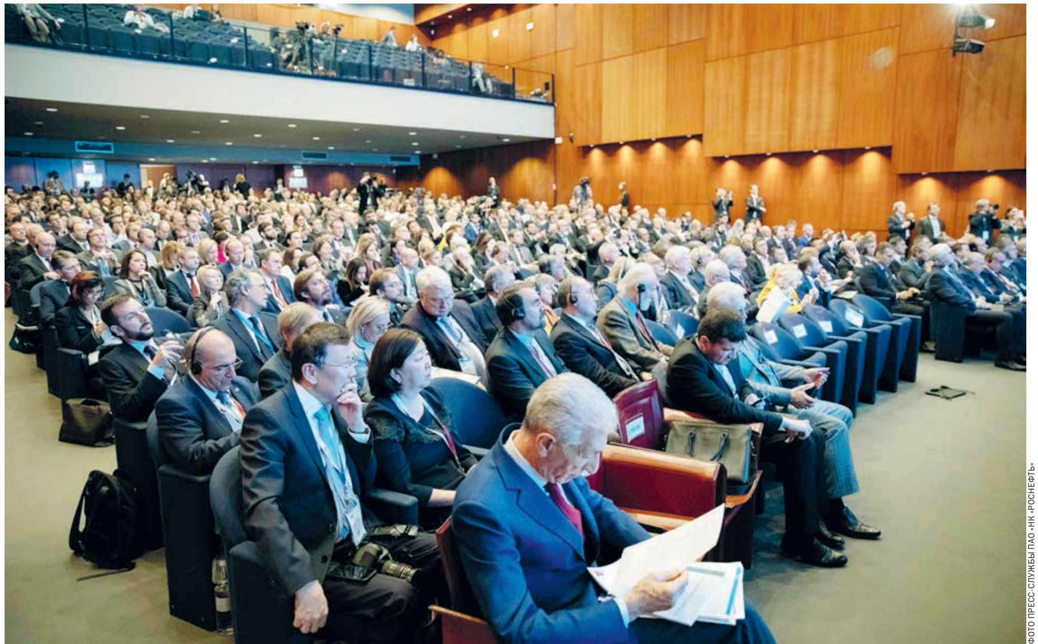
Форум в Вероне собрал представителей европейских деловых кругов, политиков и экспертов.

При этом в сланцевой отрасли США, также переживающей интенсивное развитие, эти вопросы только частично решаются на региональном уровне, а, напри-