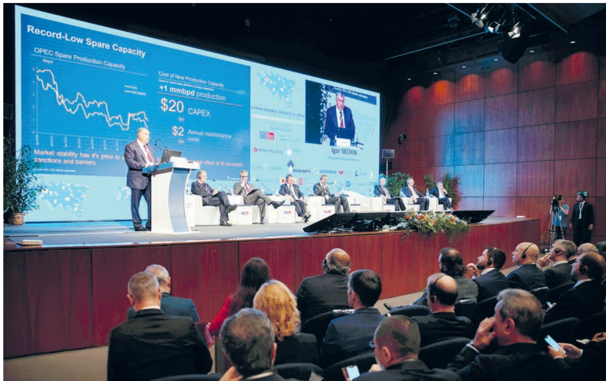
Цифры и факты убеждают: односторонние экономические санкции наносят вред экономике всех стран.

Корпоративного научно-проектного комплекса «Роснефти», разработали инновационный способ обработки сигнала при гидропрослушивании скважин. Технология позволяет избежать потерь в добыче нефти до 225 тонн в месяц с одной скважины, сэкономив при этом 2,1 млн рублей на каждом исследовании