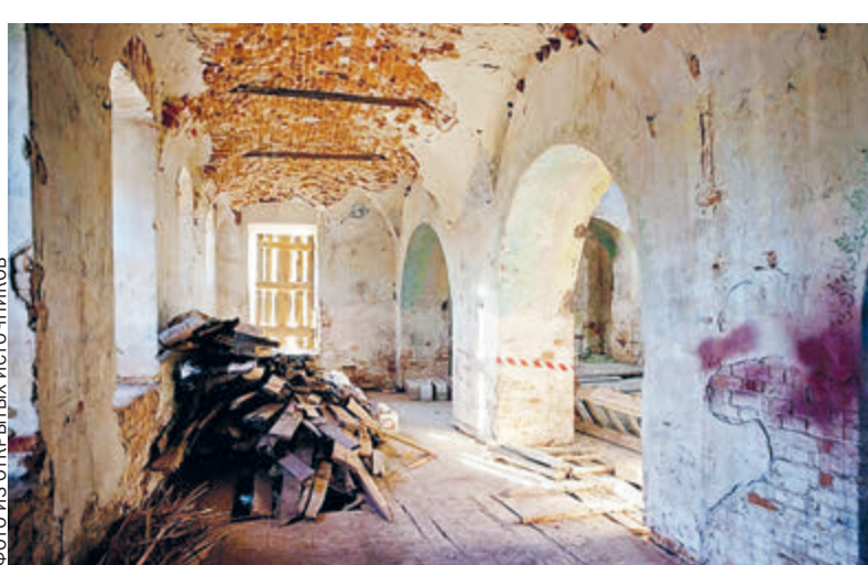
А так выглядел храм в советскую эпоху...

широкой разработке новых маршрутов говорить не приходится. Приведем только один пример. Когда заходит речь о буддийских храмах, в первую очередь вспоминают Иволгинский дацан – монастырь, построенный во время Великой Отечественной в Бурятии. Но мало кто знает, что центры буддийской культуры есть гораздо ближе к Москве.