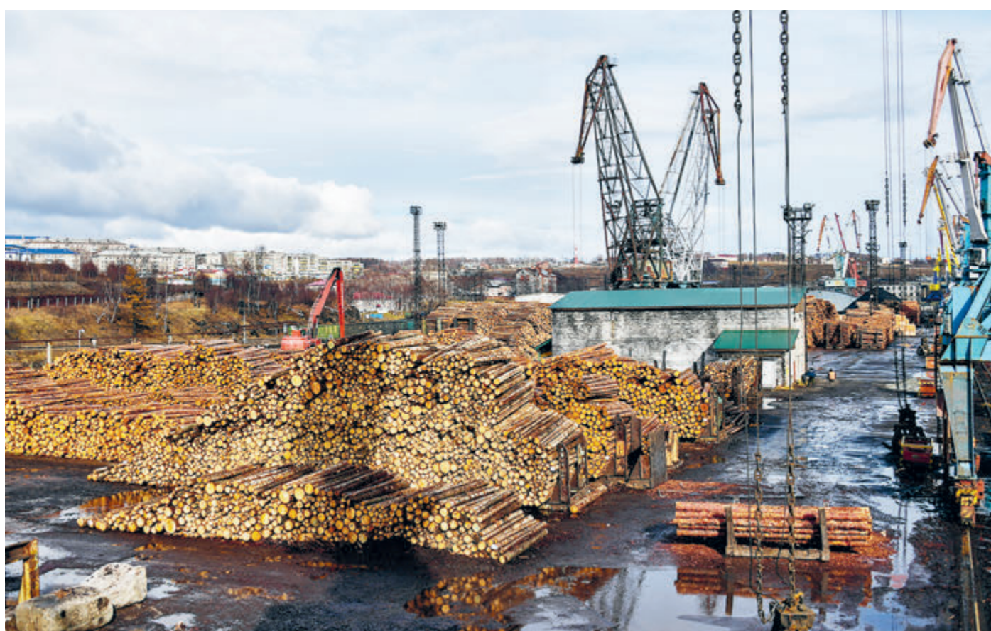
Знаменитый Ванинский порт. Все, как и десятилетия назад.

По мнению президента, главная беда лесного комплекса – «жульничество процветало так, как никогда, расхищение просто зашкаливало, процветали хищнические, нелегальные вырубки». А потому «действовать надо широко... жестко заниматься декриминализацией отрасли: то, что там происходит, вообще ни в какие ворота не лезет...». И прежде всего, призывает Владимир Путин, надо «поставить