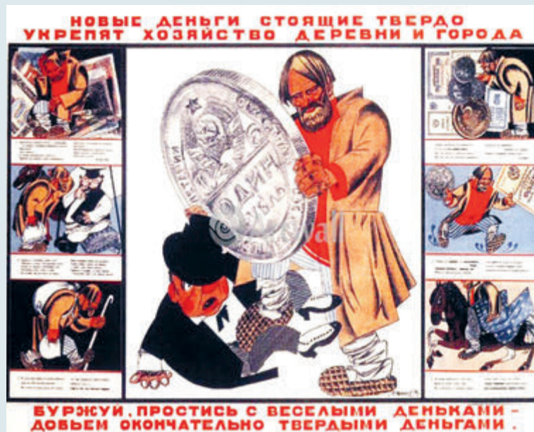
БУРЖУИ, ПРОСТИСЬ С ВЕСЕЛЫМИ ДЕНЬГАМИ – ДОВЬЕШЬ ОКОНЧАТЕЛЬНО ТВЕРДЫМИ ДЕНЬГАМИ.