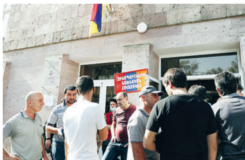
Добровольцы имеются с обеих сторон. Чем больше людей втянется в конфликт, тем труднее остановить войну.