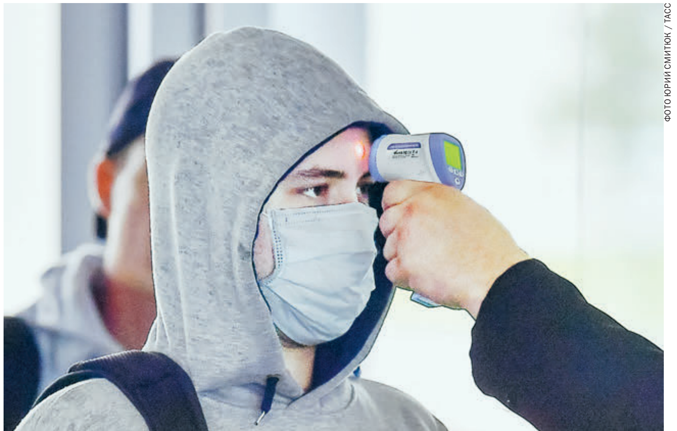
Мы снова на прицеле у Ковида.

Как тут не спросить: а где же наша бесплатная медицина, провозглашенная