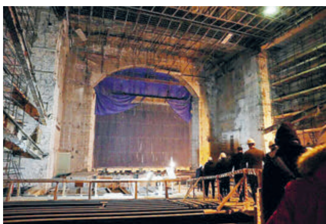
Губернатор Санкт-Петербурга Александр Беглов в стенах многоэтажной консерватории, где ремонту нет конца и края.

В консерваторию компания пришла в 2017-м, выиграв очередной тендер. Сумма контракта составила 606 млн.