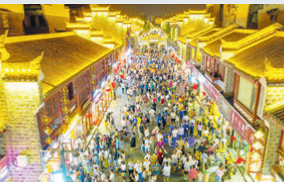
Старинный город Сяньяня провинции Хубэй полон туристов.

В этот праздничный сезон по всей стране было совершено 515 млн внутренних туристических поездок. Этот показатель восстановился до 70,1% от уровня, зарегистрированного в тот же период до вспышки эпидемии. Путешественники отдавали предпочтение «легкому туризму» и «микротурду» – частым кратковременным поездкам на близкие расстояния. Туристический поток в основном был сосредоточен внутри провинций, причем основными направлениями стали местные туры, туры по окрестностям и пригородные туры. По данным ведомства, активно бронировались курортные отели в пригородах городов первой и второй линии и высококлассные гостевые дома в деревнях. Автотуризм по близлежащим направлениям стал наиболее популярным видом путешествий.