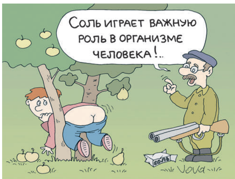
ИЛЛЮСТРАЦИЯ ВЛАДИМИР ИВАНОВ / CARTOONBANK.RU

В прошлом году в Подмосковье в октябре правоохранители фиксировали больше десятка краж ежедневно. «Обносили» в основном коттеджные поселки среднего достатка и победнее, дружно пустующие с середины осени до поздней весны, не обеспеченные на межсезонье дорогостоящей охраной. Из домов, бань и сараев воров тащили все мало-мальски ценное, особенно налегая на садовую технику и электроинструмент – для последующей продажи через Avito. Изредка заезжающие проводить свое добро хозяева узнавали о несчастье с опозданием, когда осенние дожди смыли все следы. Да, собственно, кому эти следы интересны? Полиция если и приезжала, то больше для вида: сочувствовала, просила «войти в положение», объясняла причину криминального бума падением доходов окрестного населения, помноженным на коронавирусную безработицу.