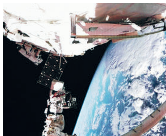
Космонавты Не Хайшэн и Лю Бомин во время работы в открытом космосе.