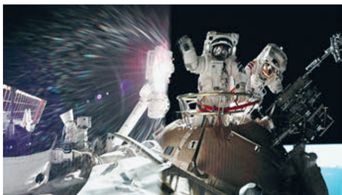
20 августа. Космонавты экипажа корабля «Шэньчжоу-12» Не Хайшэн и Лю Бомин после завершения работы в открытом космосе. Снимок с экрана в Пекинском центре управления космическими полетами.

Успех пилотируемого космического полета «Шэньчжоу-12» заложил прочную основу для будущего строительства и эксплуатации Китайской космической станции, говорится в сообщении КППК.