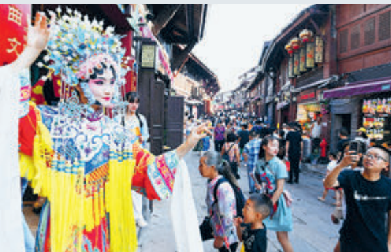
4 октября в Чунцине актеры сычуаньской оперы выступали для многочисленных туристов.