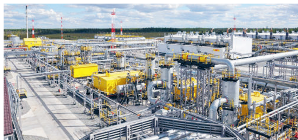
На базе совместных предприятий «Харампурнефтегаз» и «Таас-Юрях Нефтегазодобыча» планируется запустить проекты в области ESG.