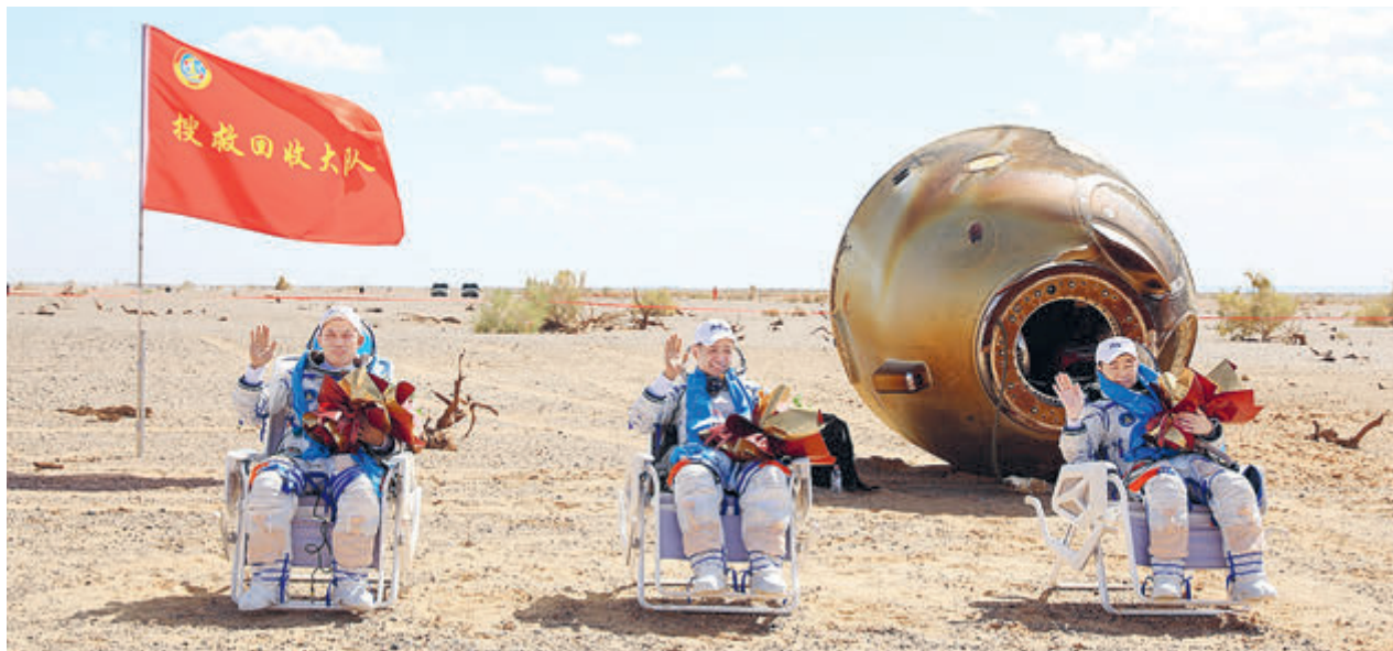
17 сентября спускаемая капсула космического корабля «Шэньчжоу-12» приземлилась во Внутренней Монголии. Три космонавта успешно вышли из капсулы.