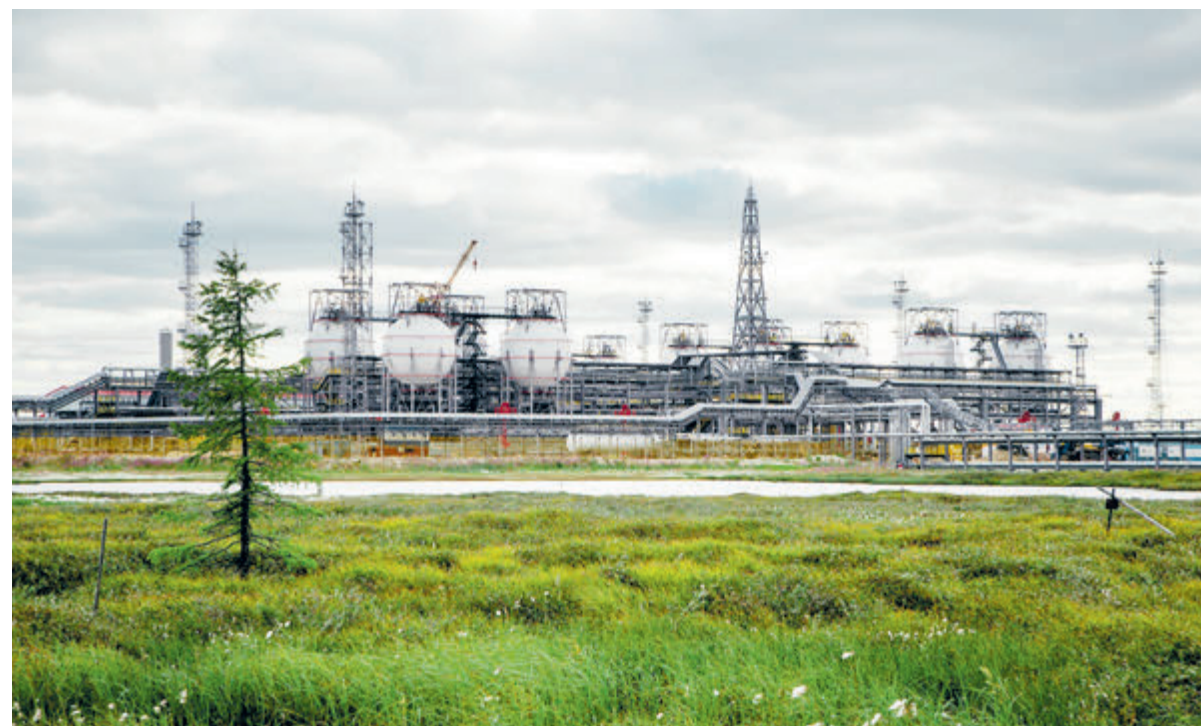
За последние 8 лет «Роснефть» увеличила добычу газа в 1,6 раза – одна из лучших динамик роста в отрасли.

«Кризис, который сейчас ощущается в Европе, напомнил всем