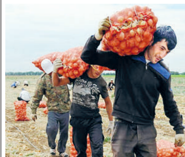
Гости с юга вынесут урожай на своих плечах.

«А вы не возите, – предлагают сговорчивые узбеки. – Отдайте нам свою землю, мы ее обработаем! Пшеницу вырастим, сою, огурцы-помидоры. Не для вас – для