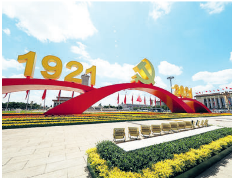
Площадь Тяньаньмэнь празднично украшена по случаю 100-летия основания КПК.

Во-вторых, КПК является политической партией, которая постоянно стремится к осуществлению мечты китайского народа о возрождении. Коммунизм и социализм – это идеалы и убеждения, которых неустанно придерживается КПК. На протяжении 100 лет партия сталкивалась