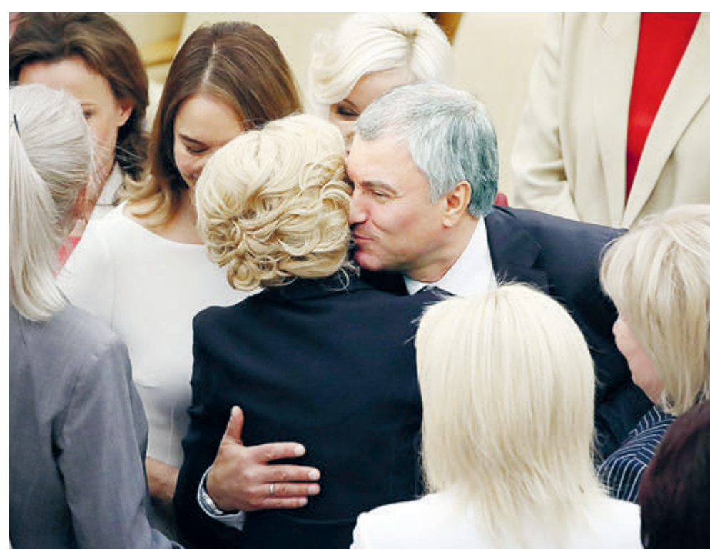
Работы предстоит непочатый край.