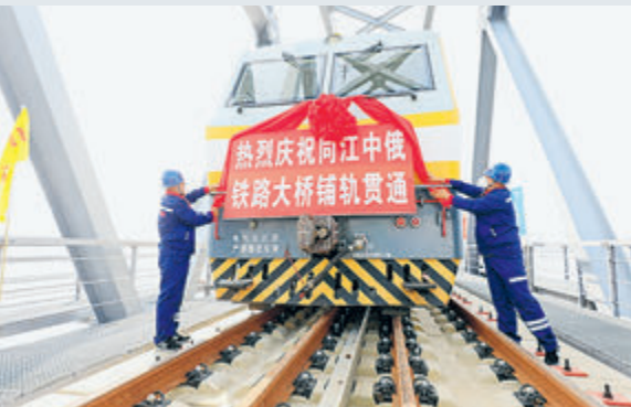
17 августа была осуществлена укладка рельсов на железнодорожном мосту Тунцзян – Нижнеленинское через реку Хэйлуцзян.

Он также констатировал, что Торговое представительство России в Китае всегда готово оказать информационную, консультативную и организационную поддержку китайским и российским партнерам в вопросах, касающихся инвестиционной сферы.