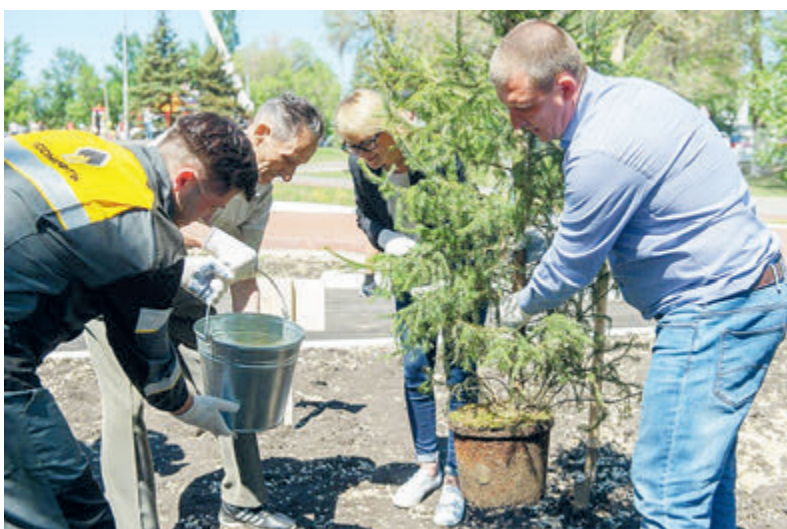
Компания вносит вклад в поглощение выбросов парниковых газов лесами, высаживая деревья в регионах своей деятельности.