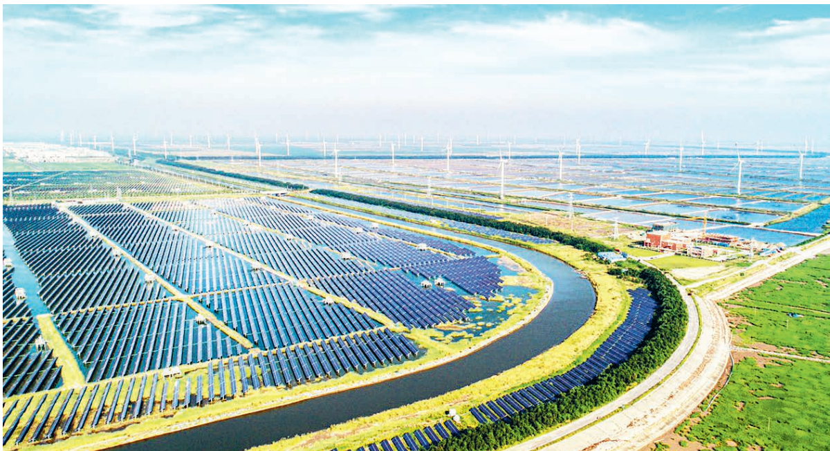
Китай – мировой лидер по выработке электроэнергии из возобновляемых источников.

Укрепление системного потенциала для достижения комплексных прорывов в ключевых сферах. Китай будет совершенствовать новую общенациональную систему, продвигать по всей цепочке технологические прорывы в таких ключевых областях, как интегральные схемы, станкостроение, высокоточное приборостроение и базовое программное обеспечение. Будет усилено перспективное и системное планирование фундаментальных исследований, увеличены