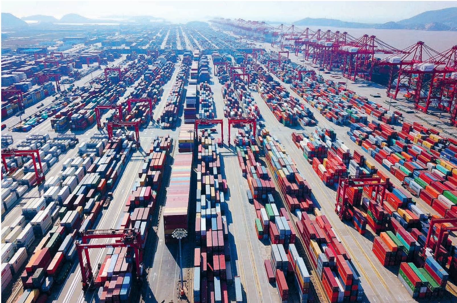
Крупнейший в мире автоматизированный глубоководный порт в Шанхае – пример сочетания научно-технических и технологических инноваций.

В передовых областях появляются ведущие результаты, способность к первичным инновациям продолжает стремительно расти. Китай уже пятый год подряд занимает первое место