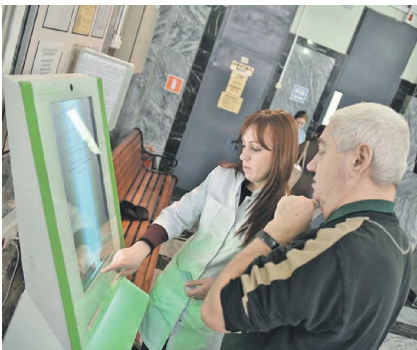
13 февраля 2015 года 11:24 В поликлинике № 64 консультант помогает пациенту записаться на прием к терапевту с помощью инфомата, установленного в холле.

Один портал, четыре миллиона пользователей За последний год к медикам с помощью информационно-коммуникационных технологий записались 6,9 миллиона уникальных пациентов.