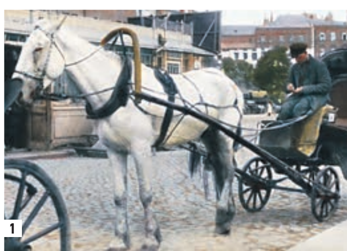
1931 год, проезд возле гостиницы «Метрополь» — одна из традиционных «бирж» извозчиков.