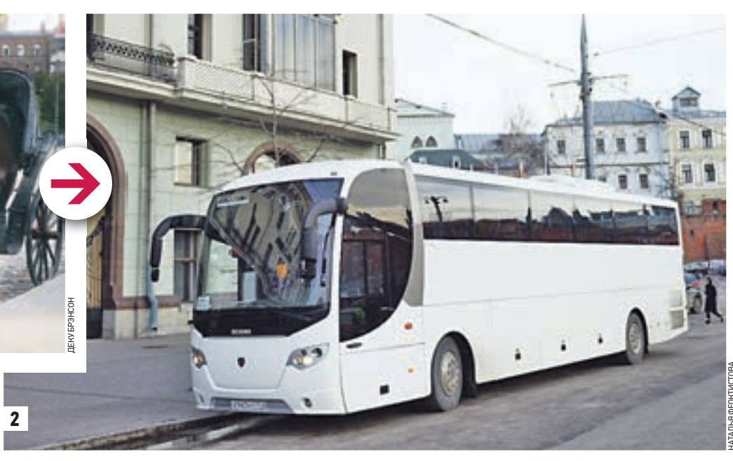
2. Современный автобус у гостиницы «Метрополь».

Известный американский художник и путешественник Брэнсон Деку посетил Советский Союз в начале 30-х годов прошлого столетия и сделал несколько фотографий с видами Москвы.