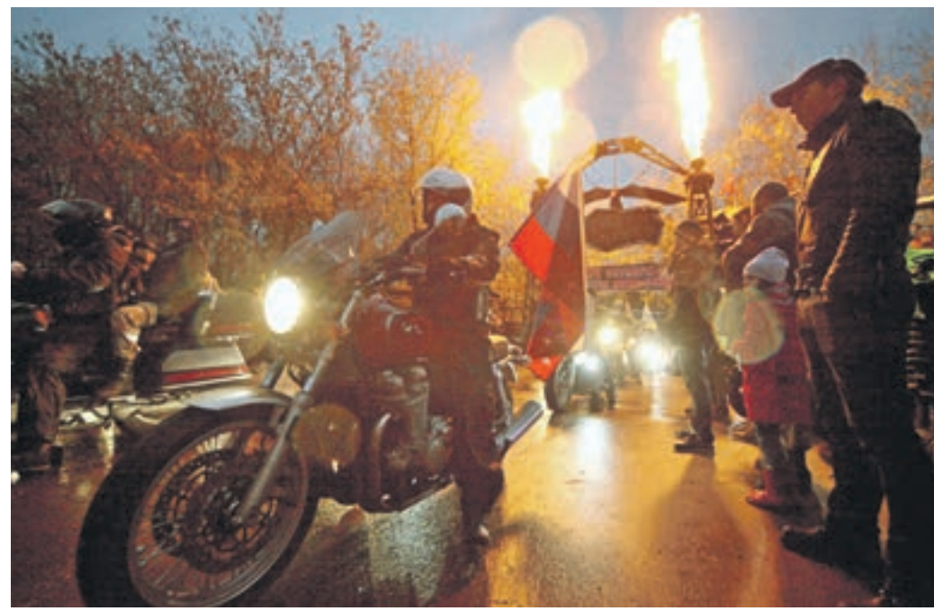
14 октября 2017 года 17:40 столичные байкеры закрывают очередной мотосезон. Колонна мотоциклистов встала у байк-центра в Нижних Мневниках

Награждение грамотами и шевронами прошло на «ура», единственное — погода подвела, почти весь день шел дождь. От закрытия сезона грустно нам так же, как и весело. Радостно от того, что мы свою историю пишем мотоциклами, а они у нас звездолеты, которые парят где-то в космосе. Мы хотим, чтобы гул от наших моторов слышала вся Россия.