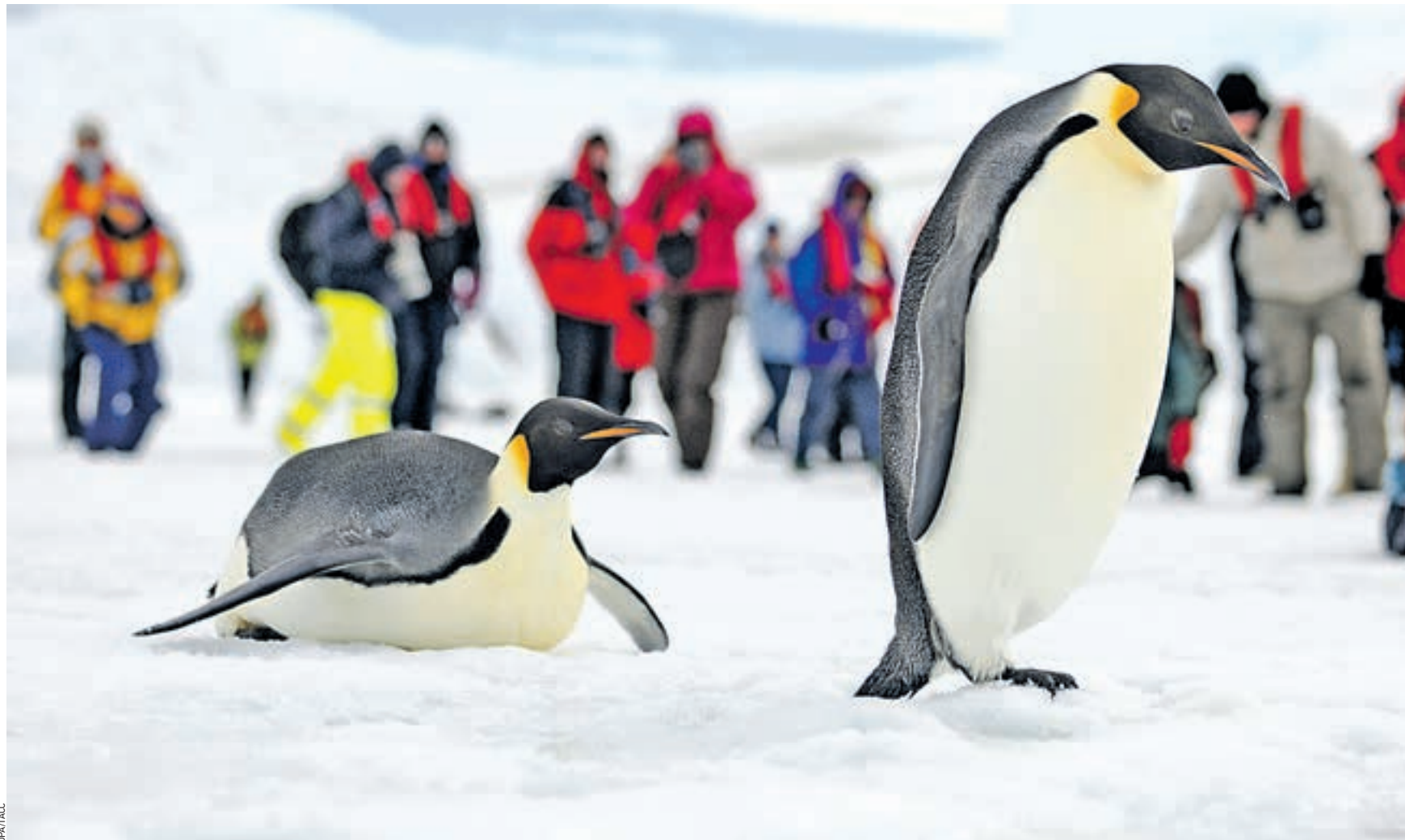
15 июля 2014 года 13:45 Один из самых дорогих и экзотических туров — круиз по Антарктиде. Путешественники могут не только полюбоваться огромными айсбергами и ледниками, но и фотографировать здешних обитателей — пингвинов, тюленей и китов. Стоит такое путешествие свыше 10 тысяч евро