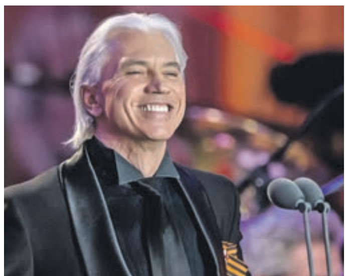
9 мая 2016 года 19:50 Дмитрий Хворостовский выступает на концерте в Москве с программой «Песни военных лет»

Внепрестые для России 1990-е Дмитрий осел в Лондоне. Впрочем, по его собственному признанию, там он бывает не чаще трех недель в году. Все остальное время — бесконечные концерты. Милан, Вена, Париж, Нью-Йорк, Москва, Санкт-Петербург и — конечно — Красноярск. Кстати, там Хворостовский по-отечески опекает юные дарования. Когда смотришь на него и слушаешь его пение, возникает удивительное ощущение уверенности и силы. Сибирская мощь — гренадерский рост (190 см), атлетическая фигура — не может не внушать симпатии и чувства доверия. Впрочем, сила хороша тем,