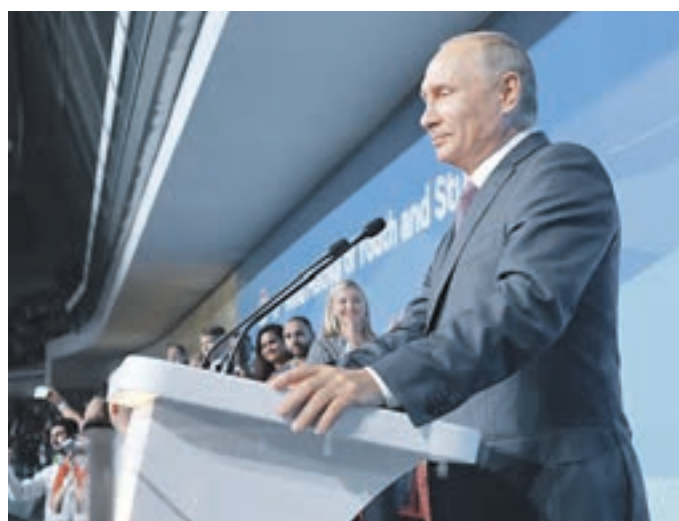
Вчера 18:18 Сочи. Президент Владимир Путин на церемонии открытия фестиваля

Вчера в Сочи состоялось масштабное фееричное открытие XIX Всемирного фестиваля молодежи и студентов. Юноши и девушки из 180 стран мира съехались в «Большой» ледовый дворец, чтобы поучаствовать в празднике. В числе делегатов от Москвы туда отправлялся и специальный корреспондент «ВМ».