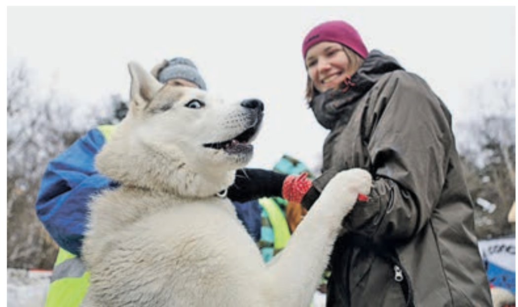
9 февраля 2017 года 10:15 В парке «Кузьминки-Люблино» ежегодно проводятся соревнования по ездовому спорту на собаках породы хаски