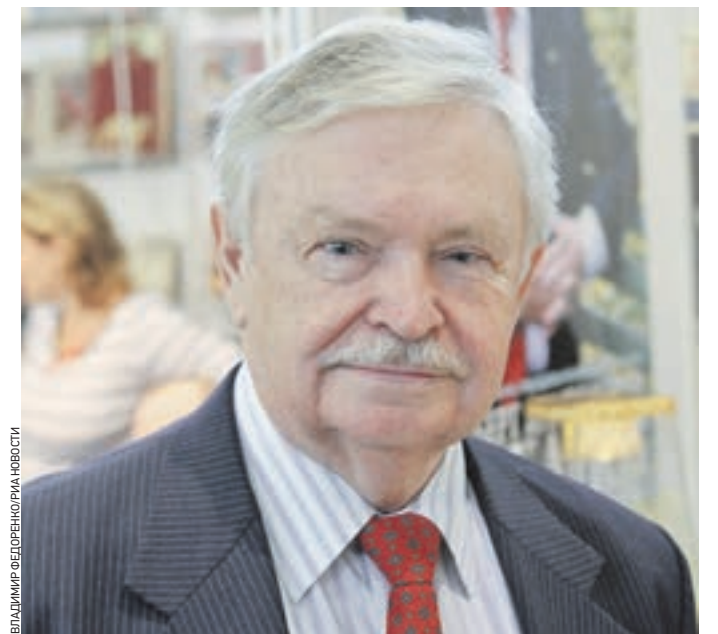
Сентябрь 2015 года. Альберт Лиханов на открытии ежегодной Московской книжной выставки-ярмарки

А потом пошли другие печальные события... Некоторые уже мало кто помнит — например, чудовищную катастрофу на железной дороге Уфа — Челябинск. В Армении люди страдали от краш-синдрома, тут — от ожогов. Мы передали оборудование для их лечения в Больницу имени Сперанского в Москве, там был ошакот ожоговый центр. В основном смысле мы выполняли функции МЧС, которого тогда не было физически. Слава богу, это министерство есть сейчас. Кстати, среди наших несбывшихся проектов был фактически прообраз первого самолета МЧС. Мы даже построили в аэропорту