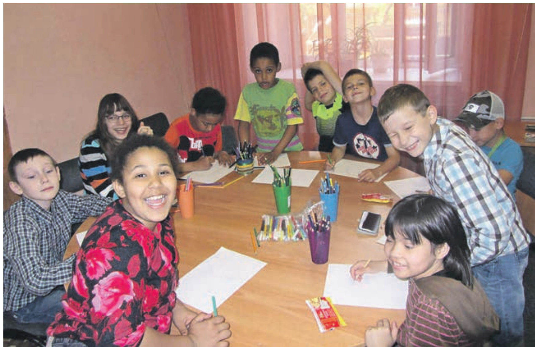
Центр поддержки семьи и детства «Красносельский» стал вторым домом для многодетных семей и семей, в которых воспитываются дети-инвалиды