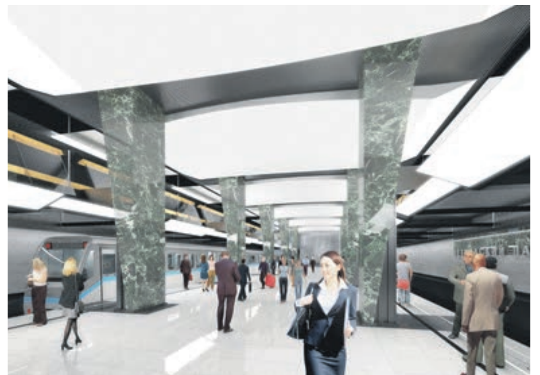
Проект станции метро Третьего пересадочного контура «Петровский парк». В оформлении использованы гранит и мрамор. Открыть станцию планируется до конца этого года

Для оформления каждой из станций первого участка Третьего пересадочного контура метро был разработан необычный дизайн.