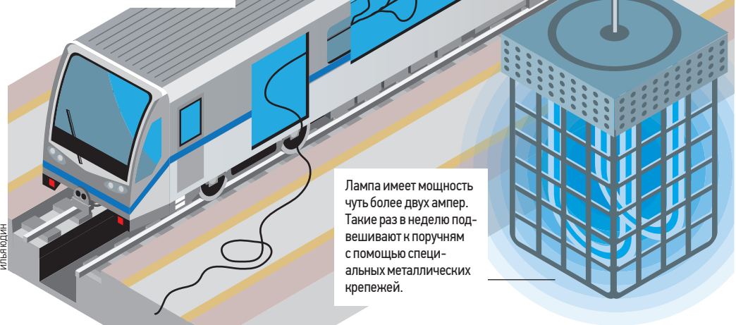
Лампа имеет мощность чуть более двух ампер. Такие раз в неделю подвешивают и получают с помощью специальных металлических креплений.

Кварцевые лампы развешивают в шахматном порядке. Это увеличивает площадь освещения. Всего в вагоне развешивают не более восьми штук.