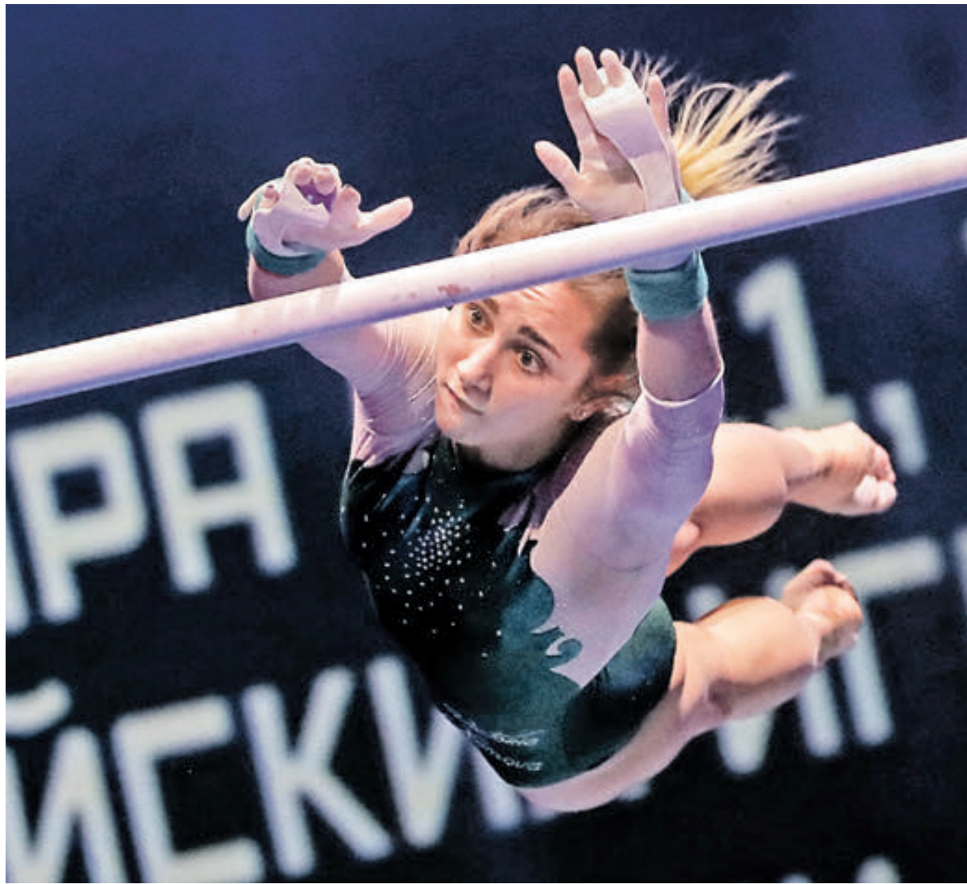
28 октября 2017 года 14:00 Спортивная гимнастка Виктория Комова во время генерального прогона шоу Алексея Немова «Легенды спорта. Восхождение», которое прошло во дворце спорта «Мегаспорт»

— Все, что я сегодня имею в жизни, я добился благодаря спортивной гимнастике. 23 года в этом виде спорта — огромный промежуток времени, который сформировал меня как человека, как личность, — уверен Алексей Немов. — Все, что я делал и продолжаю делать сегодня для спортивной гимнастики, — это возможность отдать дань