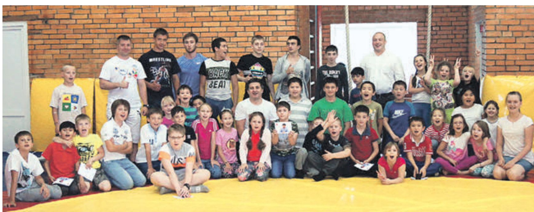
22 апреля 13:40 Воспитанники и тренеры хоккейной школы «Спартак». В этом учреждении Москомспорта успешно ведется подготовка спортсменов, завоевывающих награды на международных соревнованиях высокого уровня

Главным событием этой осени в мире единоборств станет традиционный Кубок АЛРОСА — Кубок европейских наций по борьбе. Он пройдет в столице 11–12 ноября.