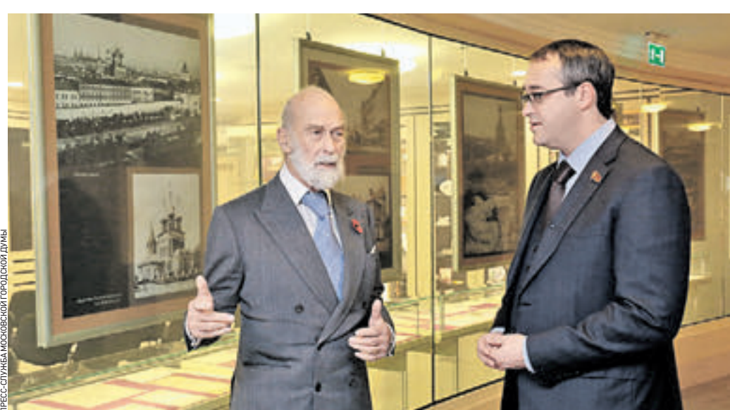
Вчера 11:50 Председатель Мосгордумы Алексей Шапошников (справа) и принц Великобритании Майкл Кентский (слева) беседуют в здании столичного парламента

— Между ними много общего, — говорит Майкл Кентский. — Особенно похожи Владимир Красное Солнышко и его дружина с королем Артуром и его рыцарями Круглого стола. Это только одна из тем, которую предстоит обсудить участникам конкурса. В нем,