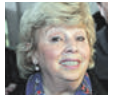
ЛАРИСА РУБАЛЬСКАЯ ПОЭТЕССА

Невозвратные билеты — это своеобразный способ привлечения внимания пассажиров низкой ценой без предоставления какой-либо возможности получить назад деньги в случае непредвиденных обстоятельств. Если авиакомпании пойдут навстречу своим пассажирам и предоставят им возможность вернуть невозвратный билет в случае болезни родственников или самого пассажира — это, разумеется, будет положительный опыт и поистине благородный жест.