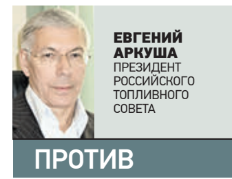
ЕВГЕНИЙ АРКУША ПРЕЗИДЕНТ РОССИЙСКОГО ТОПЛИВНОГО СОВЕТА