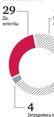
По данным НАФИ

— В Москве число субъектов малого и среднего предпринимательства в прошлом году сократилось менее чем на процент (меньше 8 тысяч), — привела статистические данные столичной бизнес-омбуд-