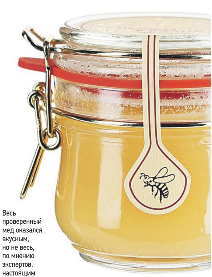
Весь проверенный мед оказался вносным, но не весь, по мнению экспертов, настоящим

— У образцов «Пчелкин мед», «Медовая Кубань», «Призвание пчеловод» диастазное число оказалось низким, — пояснила Елена. — А еще в последнем образце глюкозы оказалось больше, чем фруктозы, что не характерно для меда. Еще один параметр, на который обращают внимание эксперты, — массовая доля пролина. Это важный показатель как зрелости, так и фальсификации меда. Если мед