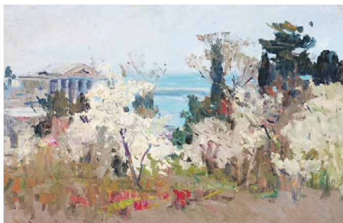
1953 год. Картина Федора Захарова «Весной в порту», представленная в Третьяковской галерее

— Потрясающий в своем выборе, в своем искусстве и своем пути, — рассказала Полянская, — рассказала Полянская, — рассказала Полянская. Окончив институт, он стал работать в традициях русского и европейского импрессионизма. В то время, в конце 40-х — начале 50-х годов, это, я считаю, было очень смело, потому что могло повлечь за собой много критики: импрессионисты в те времена называли формалистами-бракоделами. Это искусство считалось формалистическим, далеким от тех задач, которые стояли перед магистральным советским искусством.