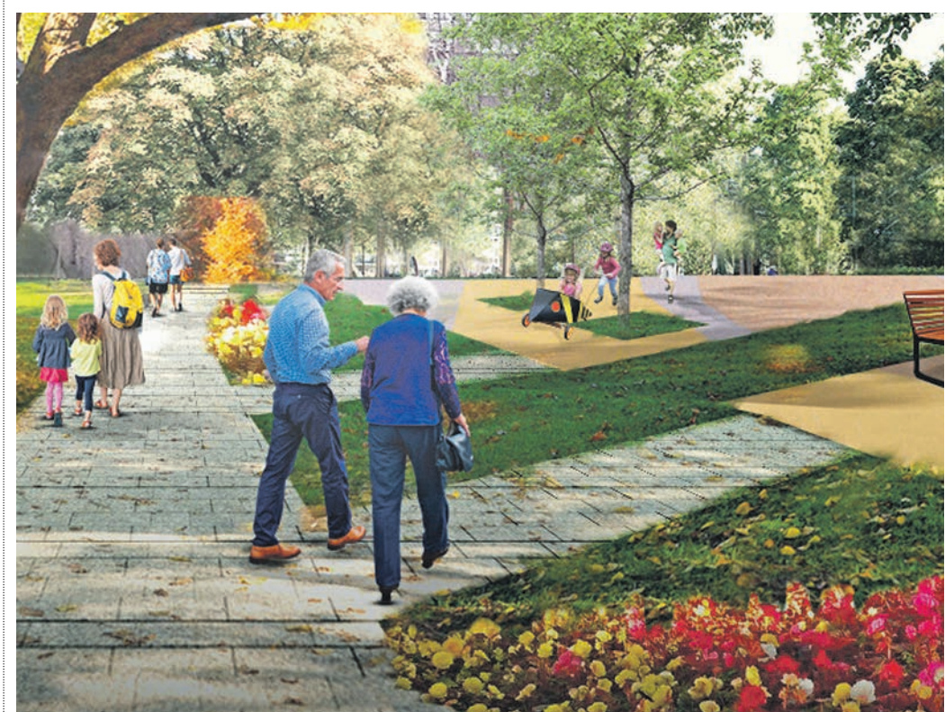
Проект благоустройства на улице Краснобогатирской. После его реализации здесь появятся удобные дорожки, также высадят деревья и кустарники и разобьют клумбы и газоны