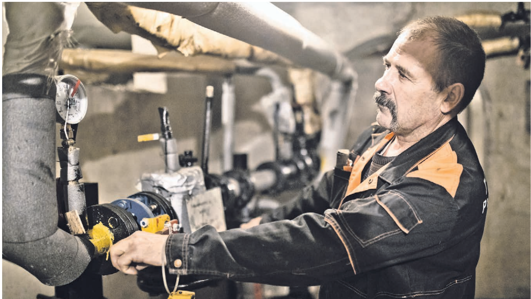
4 октября 2018 года. Сантехник осматривает трубы перед началом отопительного сезона в подвале жилого дома. Своевременная профилактика, как считают эксперты, лучший способ избежать проблем с инженерным оборудованием в будущем

Правда, как пояснил юрист, эти сроки достаточно большие. Так, например, только на аварии трубопроводов — например, прорвало трубу с горячей или холодной водой или, скажем, канализацию — коммунальщики должны реагировать незамедлительно. А если, скажем, образовалась течь через перекрытия полов в санитарных узлах, то ее, по закону, могут устранить аж три дня! Целые сутки могут чинить незакрывающиеся подъездные двери или вставлять в подъезде разбитые стекла, а также устранять течь с кровли.