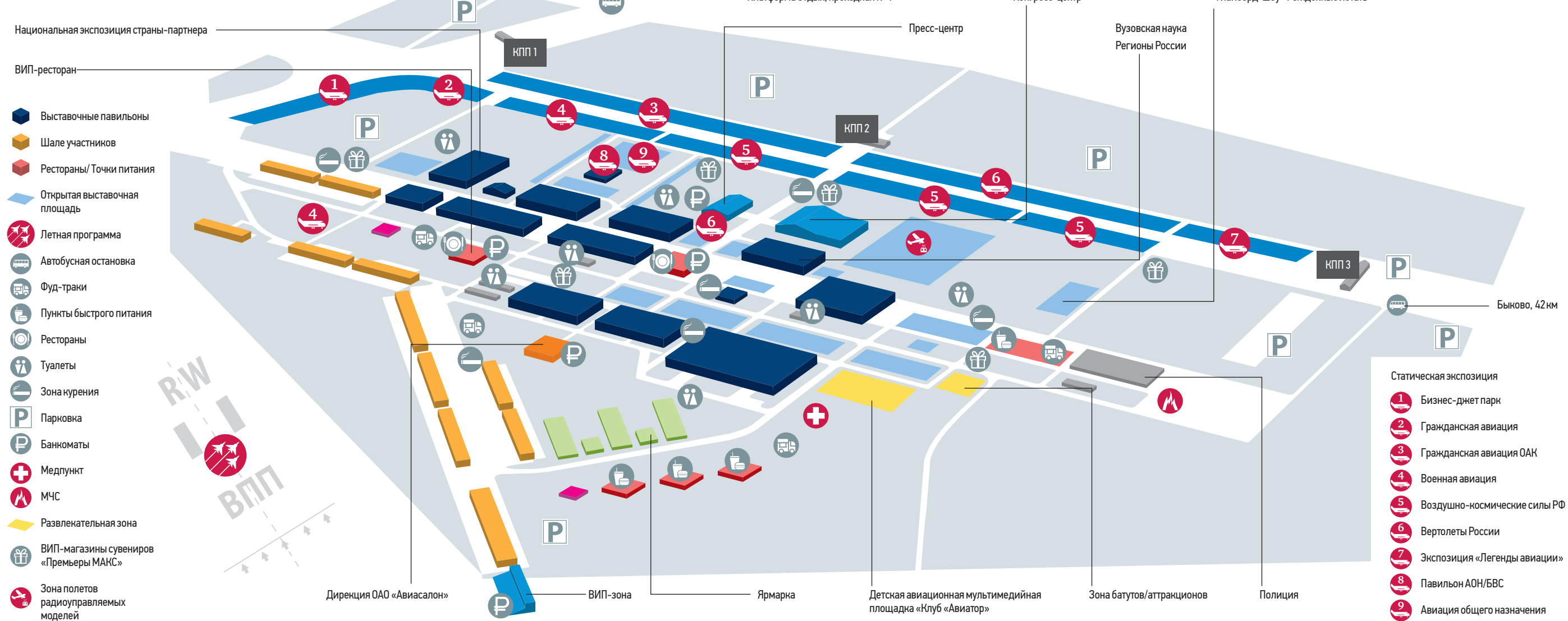
Схема выставочного комплекса

В подмосковном Жуковском уже в четырнадцатый раз открылся Международный авиационно-космический салон (МАКС) — 2019. О том, что увидят посетители на главном событии уходящего лета, узнала «ВМ».