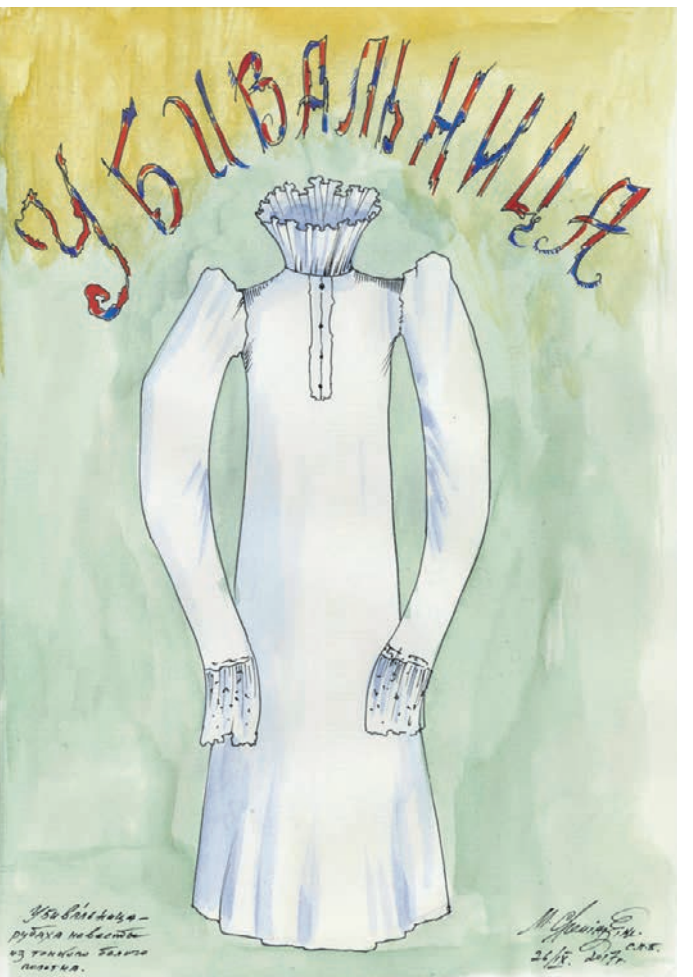
Рисунок Шемякина из серии «Говоры». «Убивальницей» в Орловской области называют рубаху невесты

Выставка продолжалась до января 2019 года, и в зале с серией «Говоры» посетители всегда задерживались подолгу.