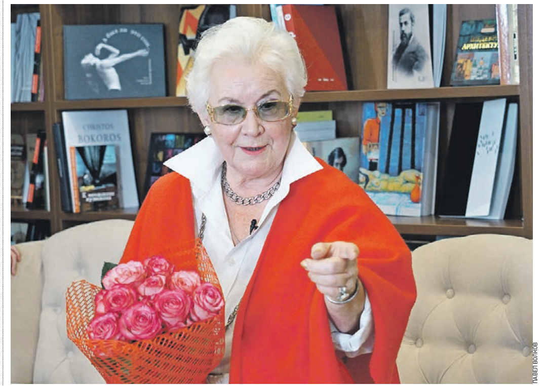
27 августа 15:30 Диктор центрального телевидения Гостелерадио СССР, актриса, народная артистка РСФСР Анна Шатилова рассказывает о секретах личного счастья