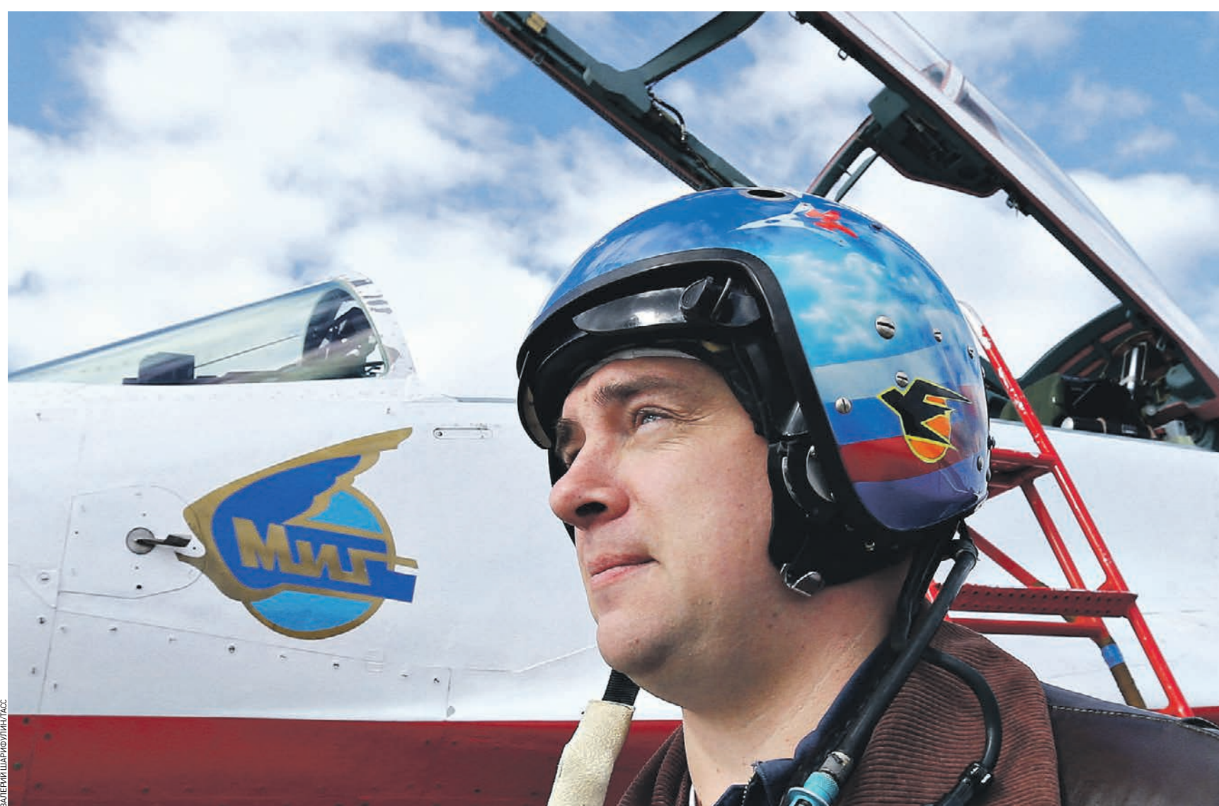
22 апреля 2015 года. Летчик пилотажной группы «Стрижи» у истребителя МиГ-29УБ во время учебно-тренировочных полетов авиационных экипажей ВВС России

По традиции программа авиасалона будет поделена на две части. Первая — с 27 по 29 августа — рассчитана на бизнесменов, вторая — с 30 августа по 1 сентября — на массового зри-