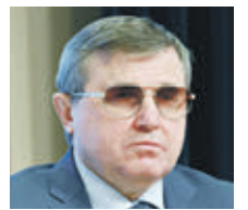
ОЛЕГ СМОЛИН ПЕРВЫЙ ЗАМЕСТИТЕЛЬ ПРЕДСЕДАТЕЛЯ КОМИТЕТА ПО ОБРАЗОВАНИЮ И НАУЧЕ ГОСУД. АКАДЕМИИ РОССИЙСКОЙ АКАДЕМИИ ОБРАЗОВАНИЯ

вопросом не озаботится президент, с этим никто ничего не сделает.