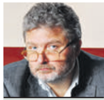
ЮРИЙ ПОЛЯКОВ ПИСАТЕЛЬ, ПРЕДСЕДАТЕЛЬ РЕДАКЦИОННОГО СОВЕТА «ЛИТЕРАТУРНОЙ ГАЗЕТЫ»

и чудовищное расслоение. Нужны другие меры. По аналогии с «партийным максимумом» 1920-х годов (ограничилось зарплатам руководящих работников. — «ВМ») нужно ввести «капиталистический максимум». Нужен налог на роскошь. Необходимо справедливое распределение «природной ренты». Иначе это все кончится баррикадами. Уж если скромные привилегии партноменклатуры народ бессилен, то представляете, какие грозды гнева зреют сейчас? Понятно, что элиты делиться не любят. Но лучше делиться, чем стать объектом жестокой экспроприации. Общество неизбежно выстраивается в иерархическую пирамиду и время от времени переворачивает эту пирамиду с ног на голову. Задача власти — найти равновесие, разрешить противоречия в пользу большинства, на то она и власть. Еще одного глобального социального взрыва Россия, как субъект мировой истории, просто не переживет.