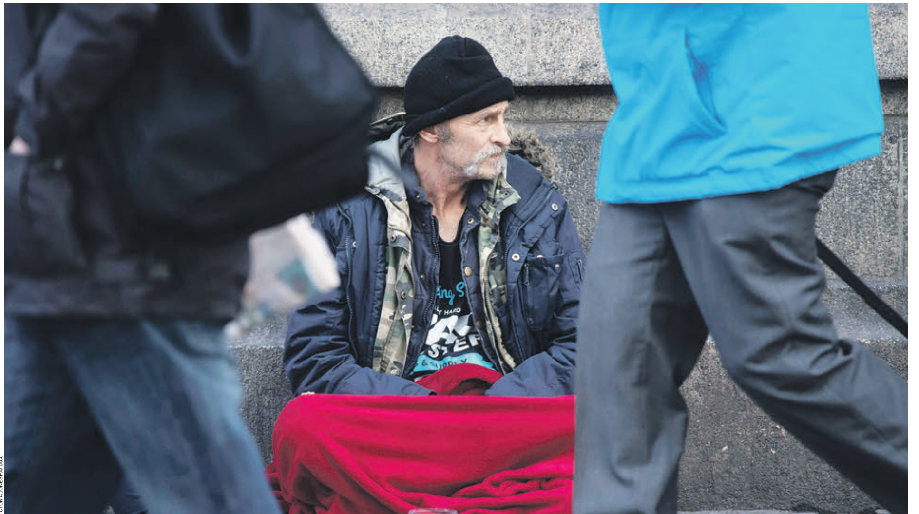
Никакого равенства возможностей нет ни в одной стране мира. Разница лишь в том, что где-то это приобретает более вопиющие масштабы, а где-то менее. Социологам известно, что по разрыву между самыми богатыми и самыми бедными Россия находится примерно на уровне США