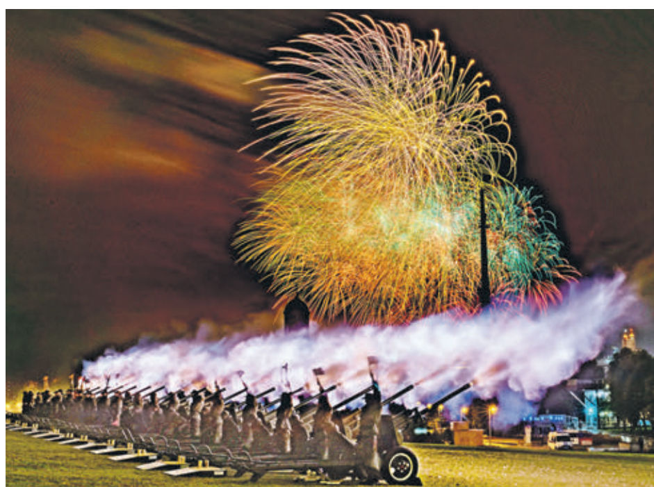
13 октября 22:07 На Поклонной горе прошел салют в честь 75-й годовщины освобождения советскими войсками Риги от немецко-фашистских захватчиков. Из самоходных пусковых установок в небо были запущены более двух тысяч фейерверков. Звуковое сопровождение салюта обеспечили пушки ЗИС-2 времен Великой Отечественной войны.