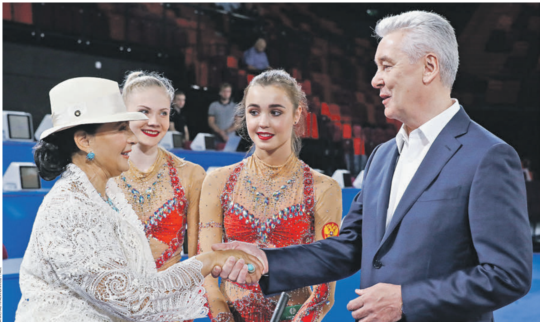
18 июня 2019 года. Мэр Москвы Сергей Собянин поздравляет с открытием Дворца гимнастики в «Лужниках» президента Всероссийской федерации художественной гимнастики Ирину Винер-Усманову (слева на первом плане) и гимнасток (на втором плане). Ровно через месяц здесь прошел первый в истории этого вида спорта чемпионат мира среди юниоров

Сегодня физкультурой и спортом регулярно занимаются около 39 процентов всех жителей столицы: 4 миллиона 460 тысяч человек. Причем это москвичи разных возрастов. Так, в рамках программы «Московское долголетие» к спортивным занятиям присоединились около 160 тысяч горожан старшего поколения. Тренировки проходят во всех районах. Наибольшей популярностью пользуются основы физической подготовки, гимнастика, фитнес, занятия на тренажерах, зумба и скандинавская ходьба. Кроме того, этой осенью, по просьбам