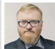
ВИТАЛИЙ МИЛОВ депутат Государственной думы

ют опасение. У нас большая закредитованность населения. Это одна из причин, по которой реальные доходы граждан практически не увеличиваются. Люди вынуждены расплачиваться по процентам за кредит, поэтому потребление в стране не растет. Это существенная проблема на сегодняшний день. Сокращение масштабов кредитования, с одной стороны, для макроэкономических показателей и устойчивости экономики в целом имеет большое значение. С другой стороны, это плохо для людей, ведь они кредитуются вынужденно, им не хватает дохода на текущее потребление — они живут в долг. Выход из сложившейся ситуации состоит в том, чтобы повышать доходы населения, зарплатные платы прежде всего. Ограничение кредитования как раз и связано с опасением, что из-за низких доходов будут расти масштабы невыплат по кредитам, соответственно, банки опасаются за свое финансовое положение.