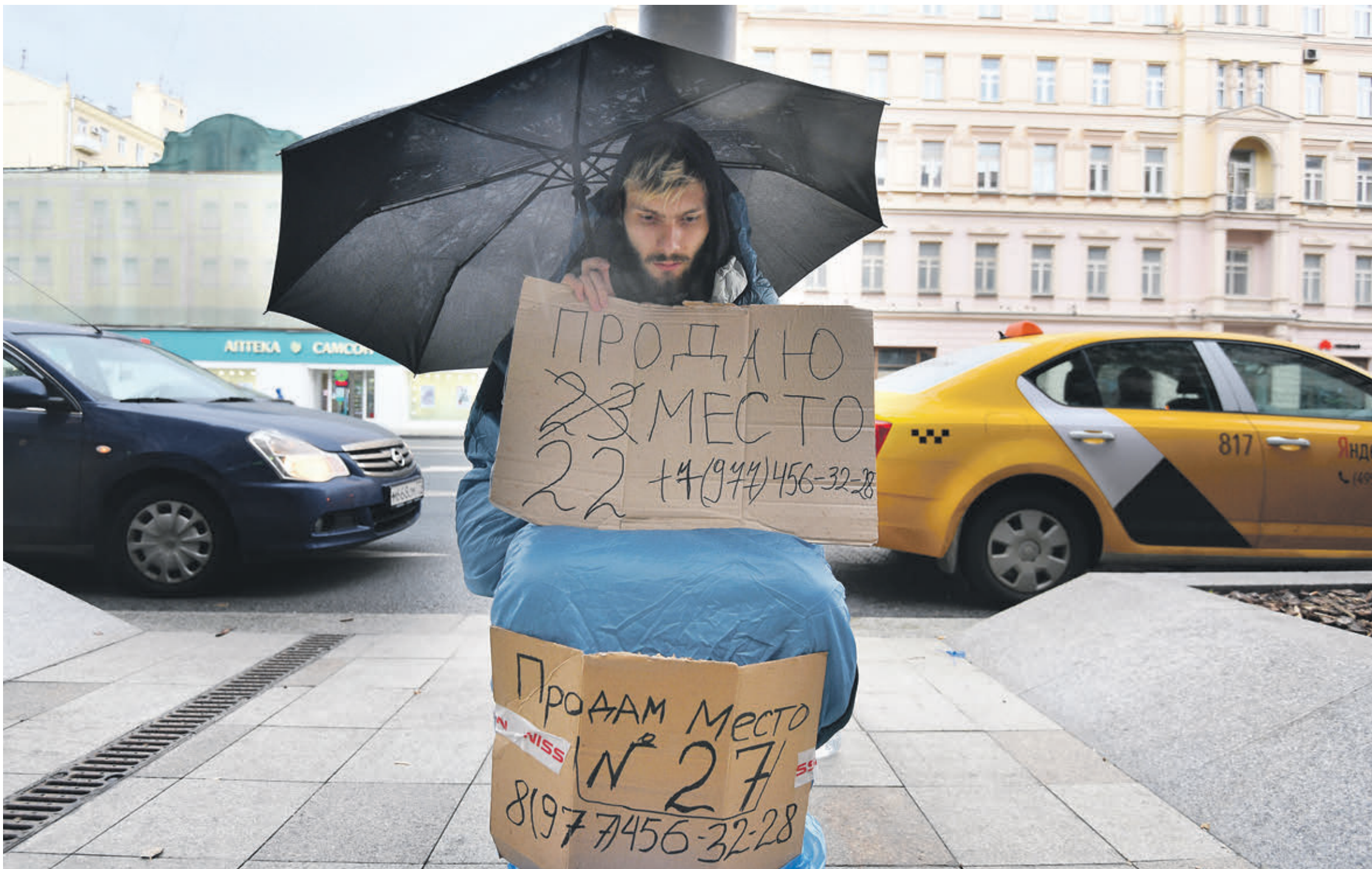
21 сентября 2019 года. Молодой человек в очереди у магазина на Тверской, где начались продажи новых iPhone 11. Бедность бывает и такой

На самом высоком уровне будут приняты системные решения для улучшения жизни