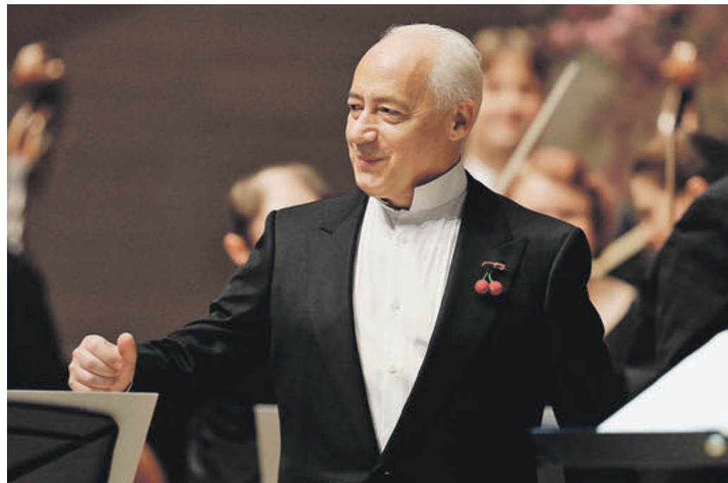
13 января 2020 года. Владимир Спиваков на открытии Рождественского фестиваля духовной музыки

В Светлановском зале Дома музыки открылся X Рождественский фестиваль духовной музыки.