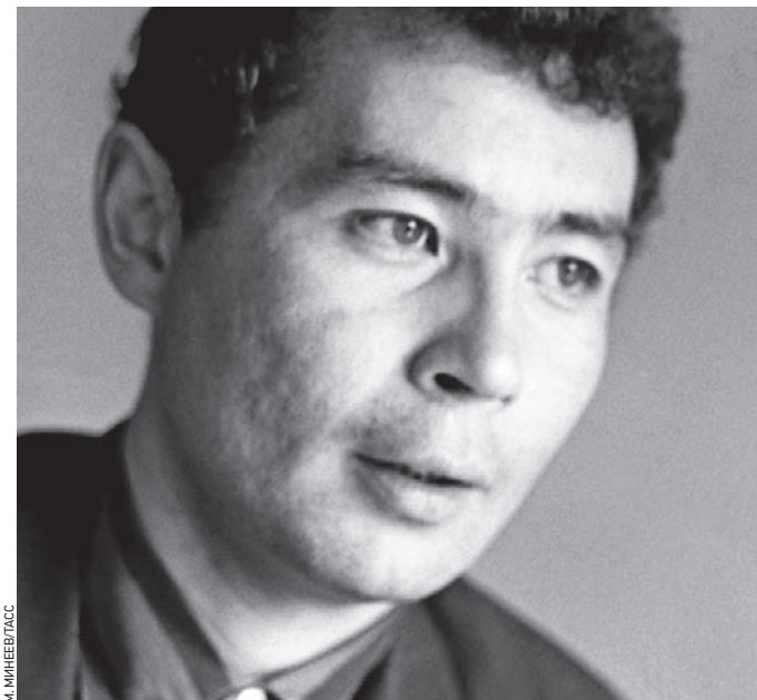
1967 год. Иркутск. Александр Вампилов после возвращения из поездки в Москву

Как многие русские гении, он прожил недолго. За два дня до 35-летия утонул в родном Байкале. Недалеко от берега мо-