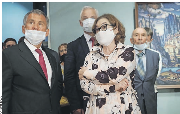
Вчера 15:15 Президент Татарстана Рустам Минниханов и директор Третьяковской галереи Зельфира Трегулова осматривают выставку перед открытием