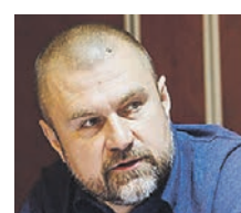
КИРИЛЛ КАБАНОВ ПРЕДСЕДАТЕЛЬ НАЦИОНАЛЬНОГО АНТИКОРРУПЦИОННОГО КОМИТЕТА

шенно нерабочим. Оборудование просто не станут приобретать и будут всячески увиливать от таких сделок. И в целом такая политика может оказаться бессмысленной тратой денег государственных компаний и навредить производством.