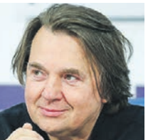
КОНСТАНТИН ЭРНСТ ГЕНЕРАЛЬНЫЙ ДИРЕКТОР ПЕРВОГО КАНАЛА, ПРОДЮСЕР

Проблема заключается не в том, что люди боятся возвращаться в кинозалы из-за угрозы коронавируса, а в том, что студии пытаются высчитать момент, когда люди гарантированно пойдут на фильмы, и откладывают дату релиза. Но ведь зрители хотят не только поесть попкорна, но и посмотреть по-настоящему интересные релизы, которых в августе недостаточно. Мы должны помочь нашему кинематографу из общей к нему любви. В начале нулевых именно телевизор сделал так, чтобы российское кино восприняло. Сейчас та же задача. Хочется надеяться, что и руководители регионов, где кинотеатры еще закрыты, пересмотрят ситуацию и увидят, что они не опасны, и зрителям нужны позитивные эмоции, которые дарит просмотр фильмов. А сети, которые планируют возобновить работу с сентября, сдвинут сроки и откроются раньше. Фильм «Вратарь галактики», который является блокбастером, может стать отличным мощным первым вариантом для широкого показа. Это семейное кино с хорошей компьютерной графикой. Нам нужен русский продукт, который заставит людей вернуться в кинотеатры. Поэтому, если жители хотят иметь возможность смотреть интересные фильмы, им нужно вспомнить, что они любили ходить в кино, и поддержать индустрию.