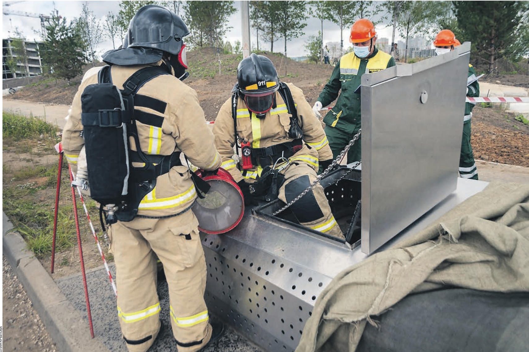
14 августа 10:27 Сотрудники ГУП «Москоллектор» и частной пожарной охраны участвуют в совместных учениях по ликвидации пожара в коллекторе «Сколково»