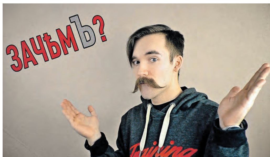
11 апреля 2020 года. Кадр из выпуска видеоблога «Микитко сын Алексеев», посвященного дореволюционному правилу написания «ъ» на конце слов

На премию «Просветитель. Digital» впервые претендует сетевой проект, посвященный русскому языку.