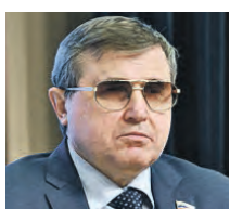
ОЛЕГ СМОЛИН депутат Госдумы РФ

Опросы родителей показали, что более 60 процентов респондентов хотели бы увеличить время для подготовки к службе в армии. Все, кто когда-нибудь изучали ОБЖ, прекрасно понимают, что это сугубо прикладной предмет. Если очень долго рассказывать о чем-то и не проходить это на практике, то толку от этого будет мало. В свою очередь, во время военно-учебных сборов познаний у ребят появится намного больше, чем на теоретических уроках. ОБЖ — это обширный предмет, охватывающий множество аспектов. Учитывая большую перегруженность школьников, его необходимо оптимизировать. Нужно оставить только то количество часов, которое необходимо для практической подготовки.