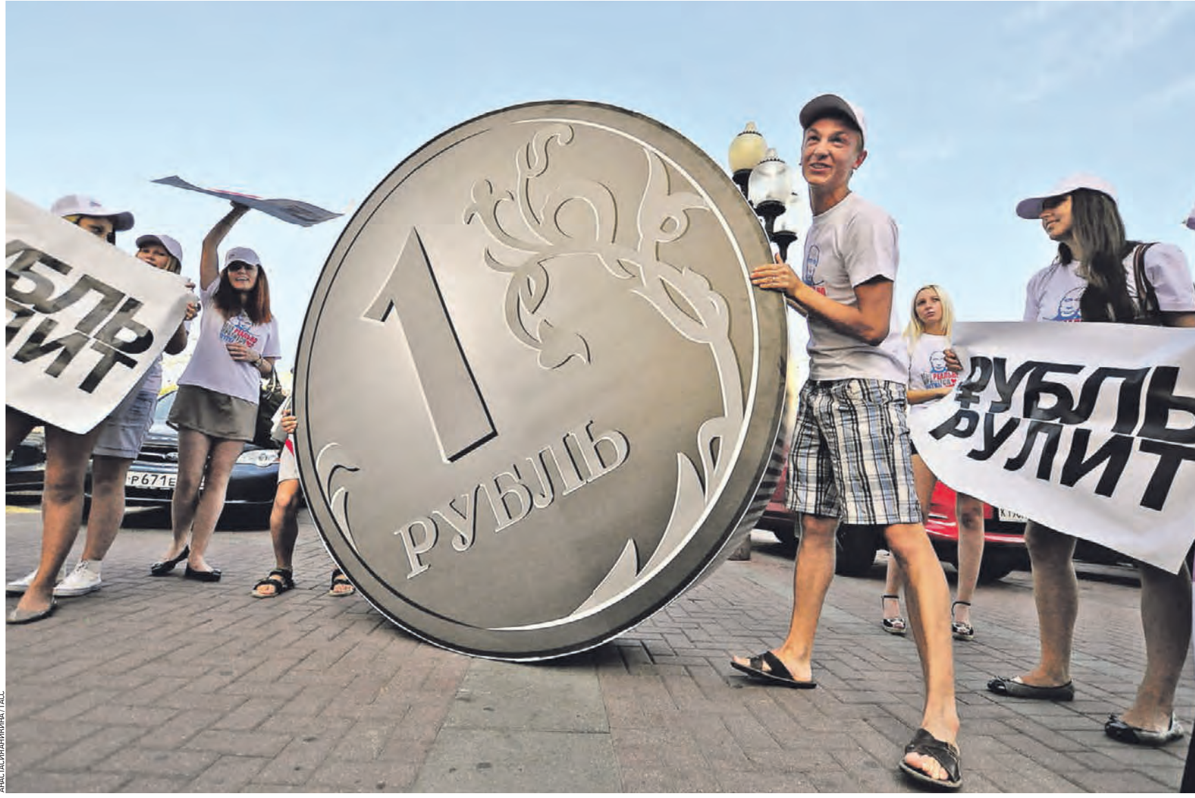
18 августа 2011 года. Акция «Парад рубля» на Арбате. Кстати, корень у названия нашей валюты родной, такой же, как в слове «рубить». Может, когда-нибудь и другие славянские слова с таким же триумфом вкатятся на страницы экономических словарей

Участникам дали список из 100 наиболее употребляемых терминов: составить его помогла служба по работе с потребителем одного из крупнейших банков. Надо сказать, некоторые пункты в списке явно добавлены для округления цифр: эти слова и так имеют отечественные корни («залог») или давно всем понятны («кредит»).