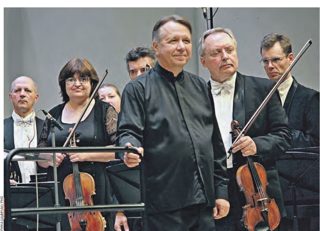
Вчера 19:30 Пианист Михаил Плетнев и музыканты его оркестра начали традиционный фестивальный марфон

Российский Национальный оркестр открывает свой 30-й сезон традиционным Большим фестивалем на сцене Концертного зала имени П. И. Чайковского. В рамках форума состоится шесть концертов с программами на самый разный вкус и интерес.