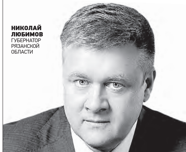
НИКОЛАЙ ЛЮБИМОВ ГУБЕРНАТОР РЯЗАНСКОЙ ОБЛАСТИ

Каждый древний город и поселение — жемчужины, из которых складывается история рязанской земли.