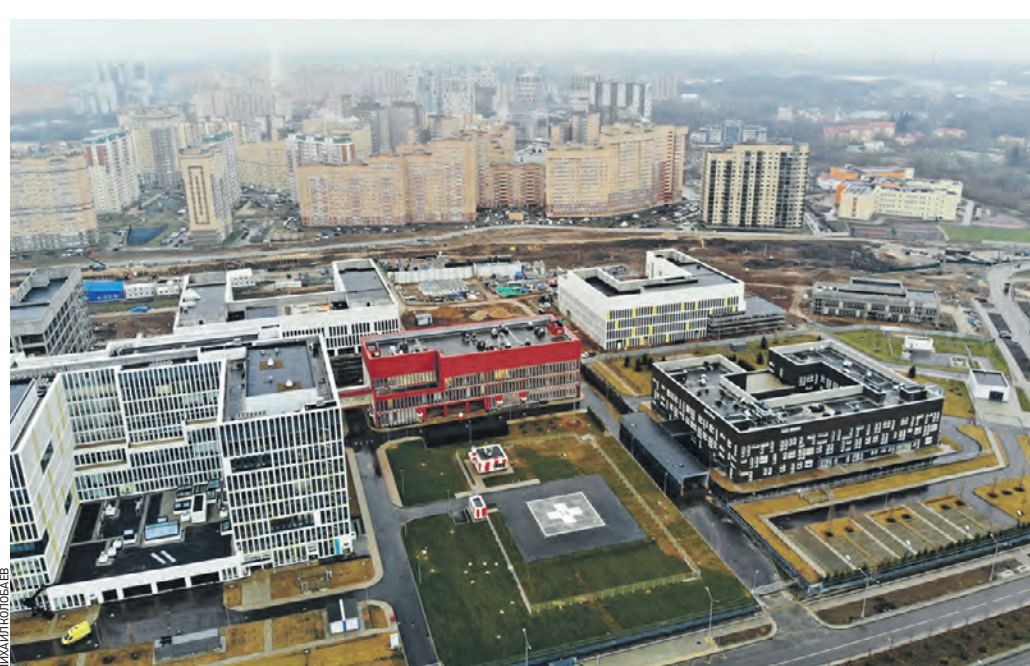
27 декабря 2019 года 11:30 Вот так выглядит больничный комплекс в поселке Коммунарка с высоты птичьего полета

нао. Прежде всего это дорожная инфраструктура и объекты метрополитена. Развитие транспортной сети на новых территориях является одним из приоритетных направлений работы столичного правительства. Этот вопрос находится на постоянном контроле мэра Москвы Сергея Собянина, который неоднократно заявлял о важности дорожного строительства в Новой Москве. Так, за девять лет было выдано свыше 200 заключений на строительство и реконструкцию дорог, проездов, транспортных развязок, улиц, железнодорожных переездов. А как обстоит дело с рассмотрением проектной документации на строительство жилых домов? Сегодня в ТИНАО больше строится и реализуется жилья, чем во всей Москве. С 2012 года Мосгосэкспертиза выдала свыше 150 положи-