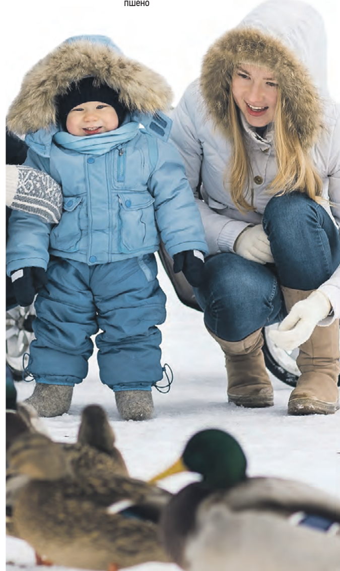
По данным Мосприроды