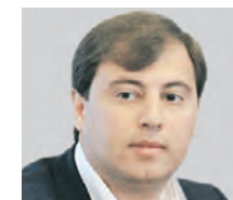
ИГОРЬ ДАВИДОВИЧ ГЛАВА МИНИСТЕРСТВА ПЕЧАТНИКИ

и смелее. Кажется, очень простые мысли, но они тогда оказались для меня очень важными, как свет в конце тоннеля. Перестал я внутренне метаться, четко определил для себя, что буду поступать в строительный институт, и пошел к этой цели.