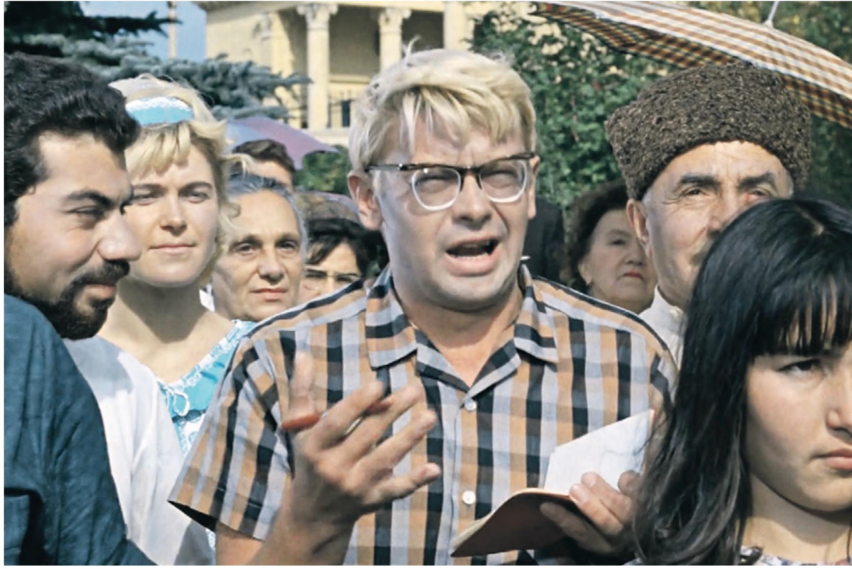
Кадр из «Кавказской пленницы» (1967). Составителям словаря разговорной речи труднее, чем Шурику: ведь записывать речь окружающих надо, не привлекая внимания

Лакун в нашем словаре вообще больше, чем хотелось бы. Скажем, в первом выпуске