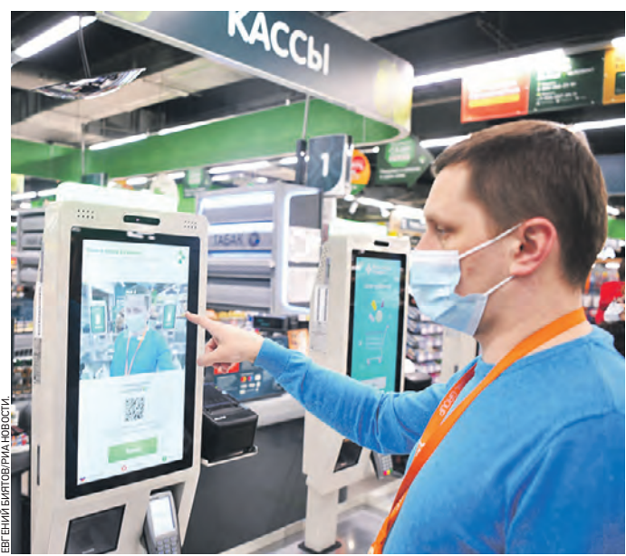
12 марта 2021 года. Эксперт демонстрирует технологию оплаты покупок взглядом на кассе самообслуживания

В Москве скоро начнут тестировать программу, которая с помощью нейросетей поможет ловить мошенников при подмене ценных товаров, драгоценностей в банках и торговых сетях.