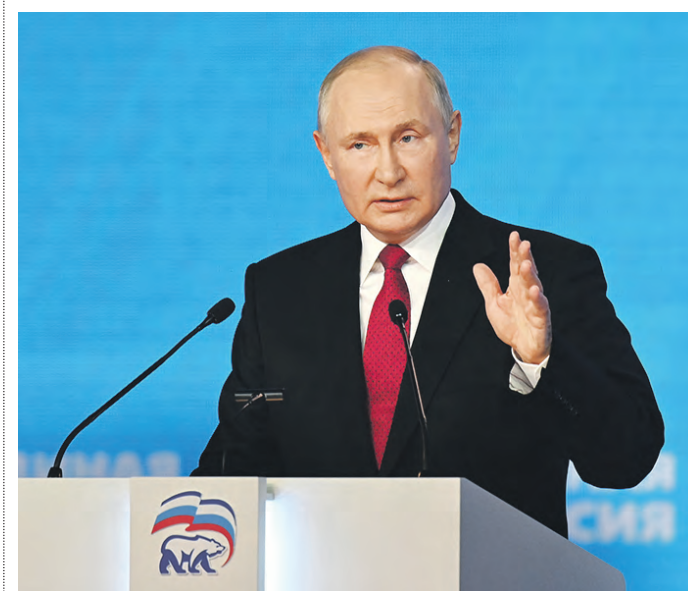
Вчера 17:56 Президент России Владимир Путин выступил на XX съезде партии «Единая Россия»

Вчера президент России Владимир Путин выступил на встрече с представителями партии «Единая Россия», на которой был утверждён итоговый вариант предвыборной программы.