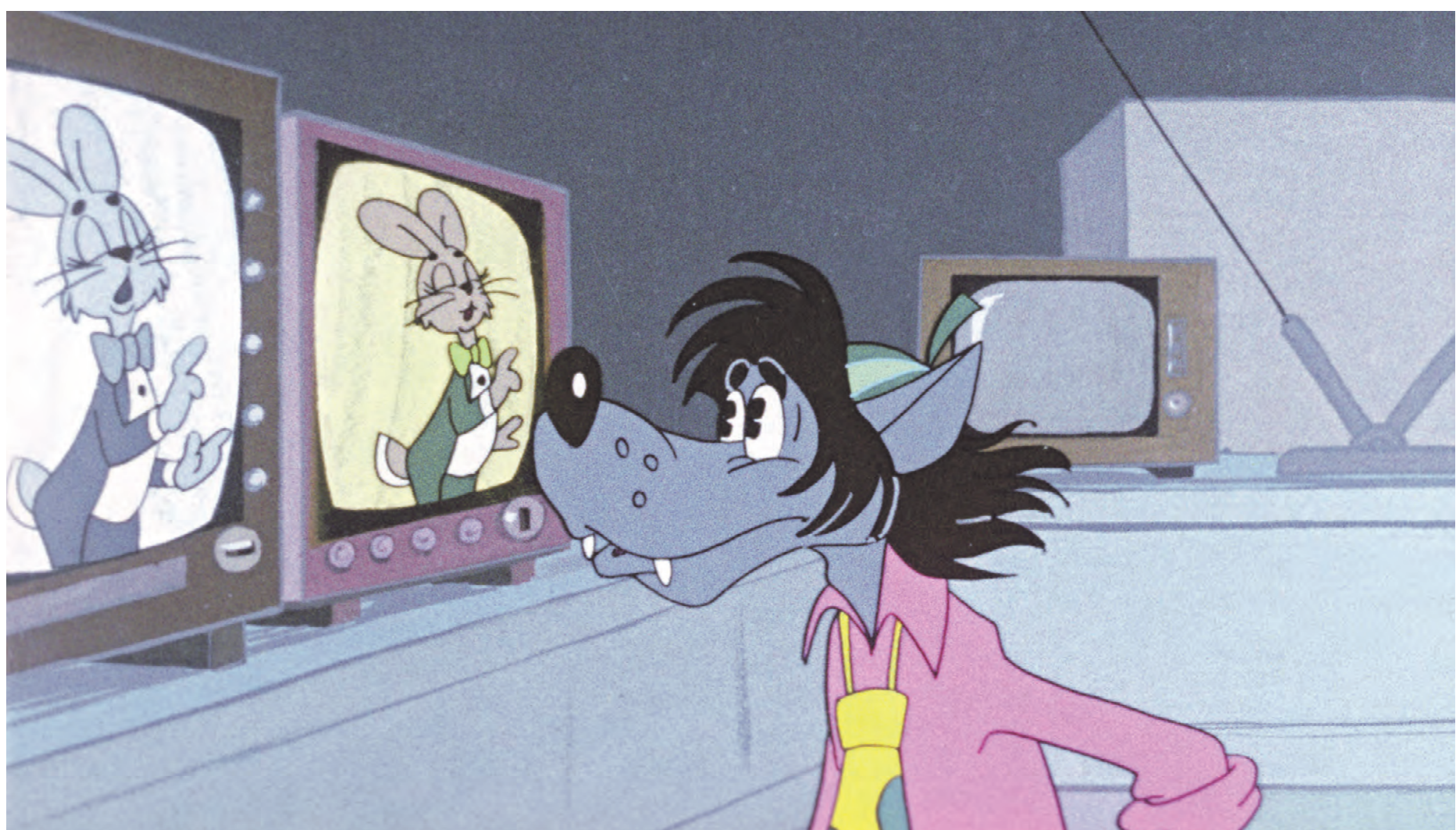
Кадр из мультсериала «Ну, погоди!», выпуск № 5 (1972 год). Волк смотрит выступление Зайца в магазине телевизоров. В 1970-х годах «ящик» был практически в каждой советской семье. Сегодня популярность телевидения упала