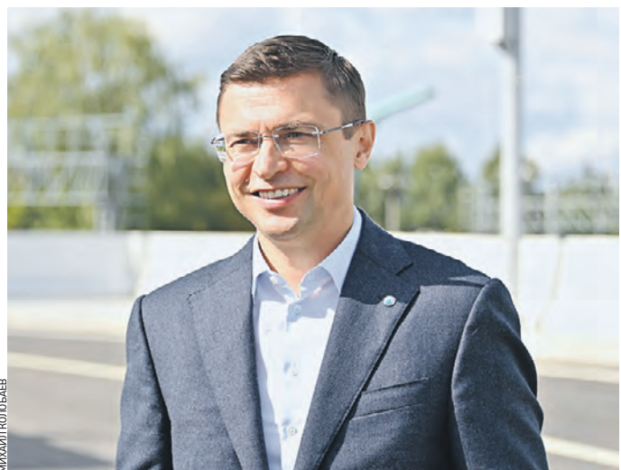
Вчера 10:50 Глава столичного Департамента строительства Рафик Загрудинов на открытии движения по Богородскому путепроводу

Вчера глава Департамента строительства города Рафик Загрудинов открыл Богородский путепровод, проходящий над путями Московского центрального кольца и Северо-Восточной хордой.