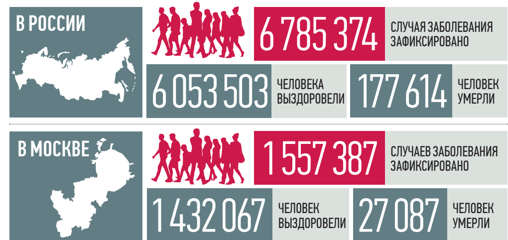
По данным стопкоронавирус.рф и mos.ru на 19:00 24 августа