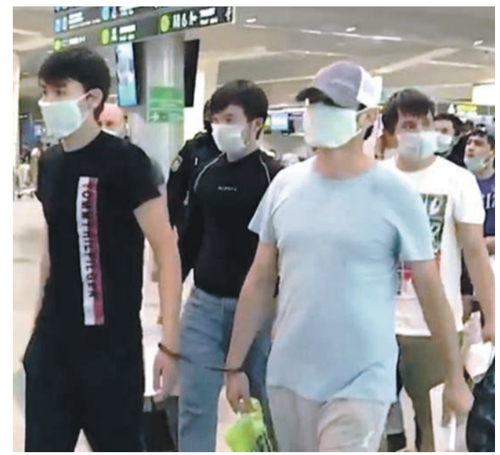
Август 2021 года. Мигрантов из Средней Азии провозжат в аэропорту для депортации

МАРГАРИТА МАРТОВСКАЯ m.martovskaya@vm.ru