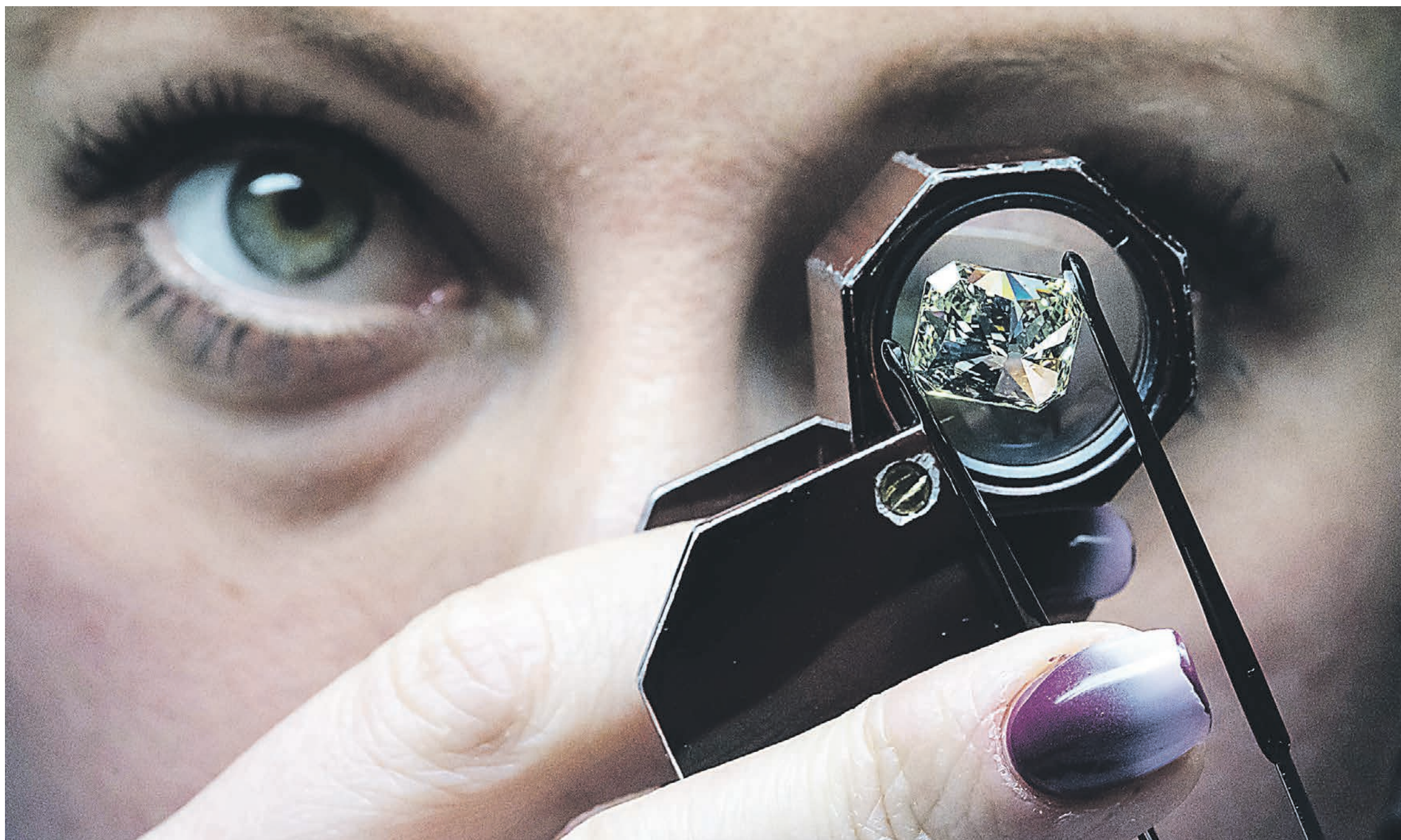
6 марта 2019 года. Сотрудница цеха техконтроля одной из крупных компаний оценивает бриллианты