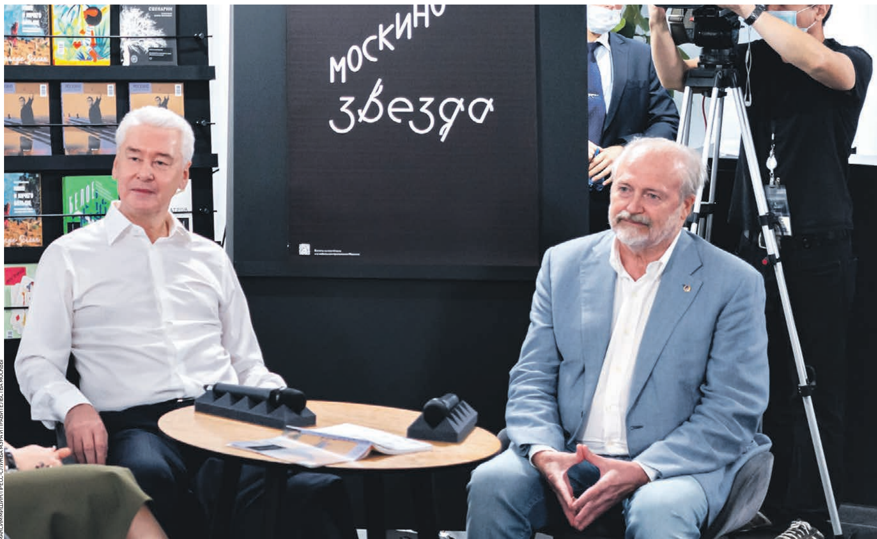
27 августа 10:57 Мэр Москвы Сергей Собянин (слева) и известный российский кинорежиссер Владимир Хотиненко на встрече с кинематографистами, во время которой обсуждались вопросы поддержки отрасли со стороны городских властей