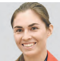
СОФИЯ ПОЗДНЯКОВА двукратная олимпийская чемпионка по фехтованию на саблях

Раньше у меня, может, и были подсознательные соревнования с папой, хотелось быть таким же выдающимся спортсменом, как он, или даже достичь большего. Но сейчас понимаю, что я — совершенно другой спортсмен. И выступаю в другой дисциплине, ведь женская сабля отличается от мужской. У каждого — свой путь, своя дорога. Не хочу ничего загадывать по поводу моего участия в следующих Играх.