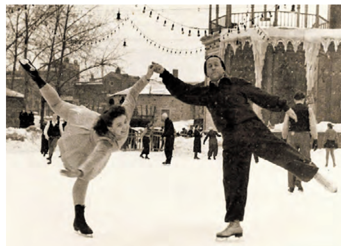
1948 год. Москвичи на «Зеркальном» катке в Центральном парке культуры и отдыха

базам и разносочным пунктам, да в некоторых магазинах имеются столы предварительных заказов. <...> Сокольническое общество потребителей не имело ни одной базы, пока за организацию их не взялся член секции Моссовета тов. Проходцев. В районе сейчас появились 4 базы, и 10 тысяч семейств стали получать товары у себя на квартире. 25 декабря 1934 года