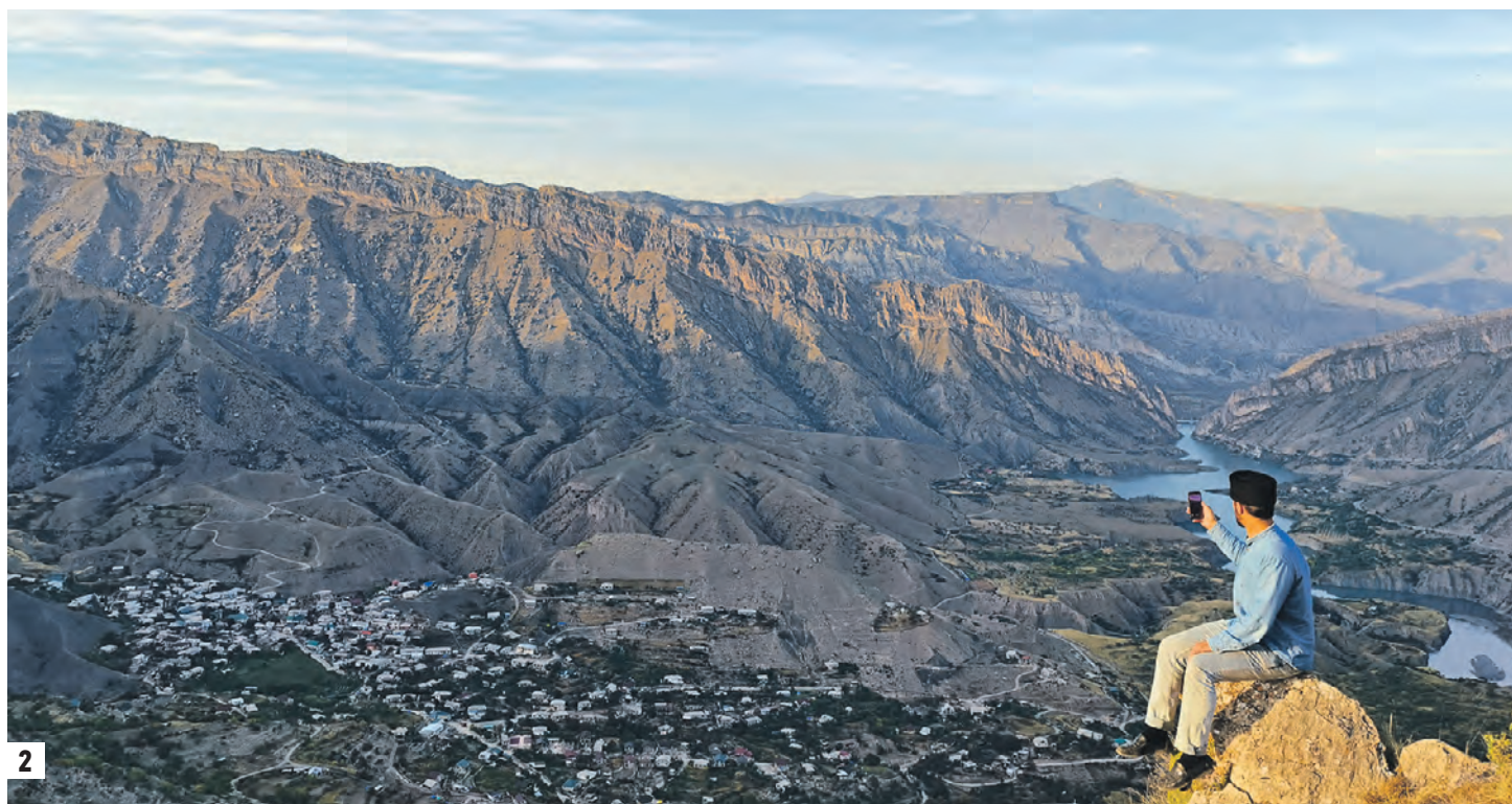
21 сентября 17:08 Начальник отдела информационного бюро Туристического информационного центра «Дагестан» Магомед Магомедов на горе в селе Гуниб (2) 20 сентября 16:11 Магомед Магомедов варит кофе на бархане Сарыкум, где средняя температура даже зимой — +20 градусов (1)

Самый южный регион России сохранил объекты Всемирного наследия ЮНЕСКО