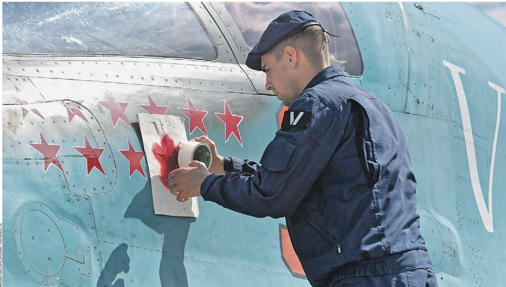
19 июня 2022 года. Техник набивает краской звезду на корпусе истребителя-бомбардировщика Су-34 Воздушно-космических сил России, задействованного в специальной военной операции на Украине

Минобороны РФ неоднократно демонстрировало кадры работы летчиков-бомбардировщиков. Основная ее ударная сила — Су-34. К главным достоинствам этого самолета относится продолжительное время полета и высокая боевая нагрузка. В ходе спецоперации на Украине Су-34 применяют новейшие авиационные ракеты, с ювелирной точностью разрушающие укрепленные объекты противника. По большому счету, эта крылатая боевая машина — универсал. В одном самолете совмещаются функции трех: бомбардировщика, истребителя и штурмовика. Су-34 предназначен для поражения наземных, надводных и воздушных целей, объектов инфраструктуры, прикрытых средствами ПВО и расположенных на значительных расстояниях от аэродрома базирования. Он способен эффективно наносить удары в условиях противодействия противника, днем и ночью в простых и сложных метеословиях, с применением различных средств поражения, также может использоваться для воздушной разведки. По своим боевым возможностям самолет относится к по-