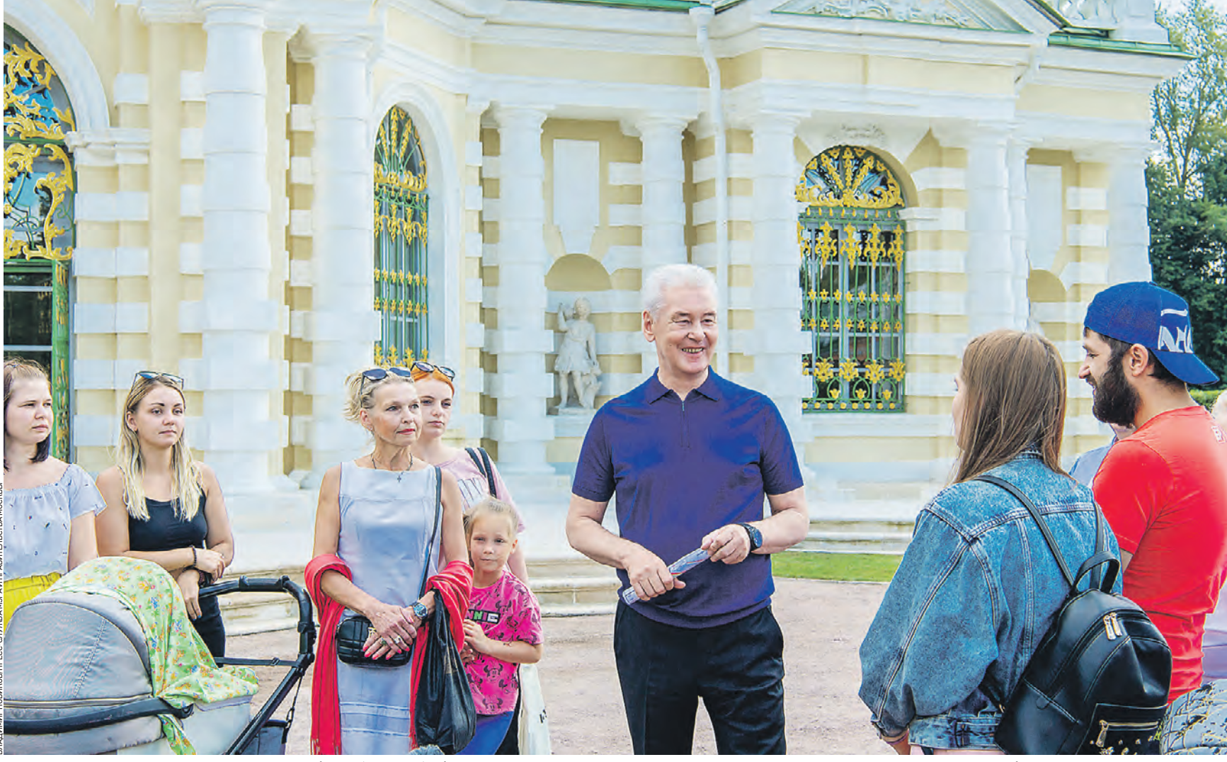
Вчера 13:32 Мэр Москвы Сергей Собянин (в центре) общается с местными жителями и посетителями лесопарка «Кусково» — горожане благодарны столичному правительству и с нетерпением ждут, когда все работы по благоустройству будут завершены