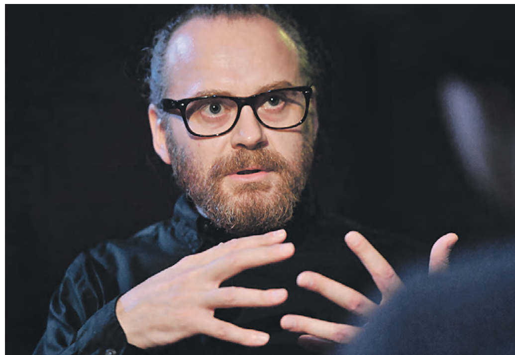
Вчера 11:00 Главный режиссер Театра на Таганке Юрий Муравицкий на сборе труппы по случаю открытия 59-го театрального сезона в культурном учреждении