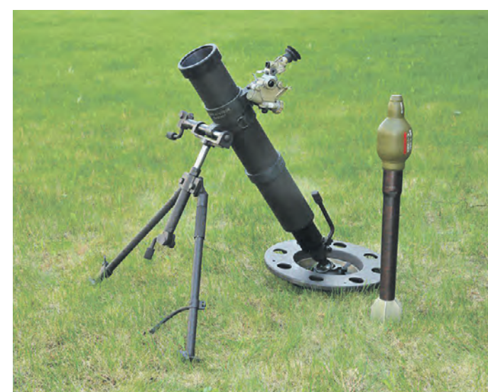
Бесшумный миномет 2Б25 «Галл», который состоит на вооружении Российских сил специальных операций

В открытых источниках появилась информация о том, что в ходе спецоперации на Украине при разведывательных действиях и для уничтожения диверсионно-разведывательных групп противника бойцы российских Сил специальных операций применяют бесшумные минометы 2Б25 «Галл». У такого оружия резкие признаки выстрела: звук, вспышка и дымный след.