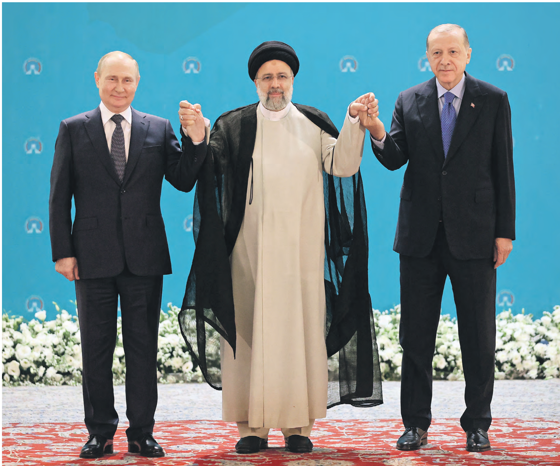
19 июля 2022 года. Президент РФ Владимир Путин, президент Ирана Эбрахим Раиси и президент Турции Реджеп Тайип Эрдоган (слева направо) во время совместного фотографирования перед началом встречи глав государств

Так ли уж безобиден «шестой с половиной» перечень преград, предложенный ЕС