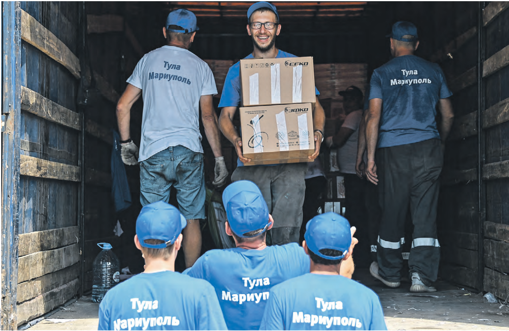
29 июля 11:39 Рабочие разгружают гуманитарную помощь для жителей Мариуполя. Конвоем доставил в Левобережный район города 20 тонн груза. Жители Мариуполя получили тысячу продуктовых наборов, питьевую воду, средства личной гигиены, детские памперсы

Между тем моральное состояние войск киевского режима ухудшается, причем в некоторых случаях — катастрофически. По словам председателя Общественной наблюдательной комиссии Москвы Георгия Волкова, он получил показания пленных боевиков на базе «Азов» (запрещен на тер-