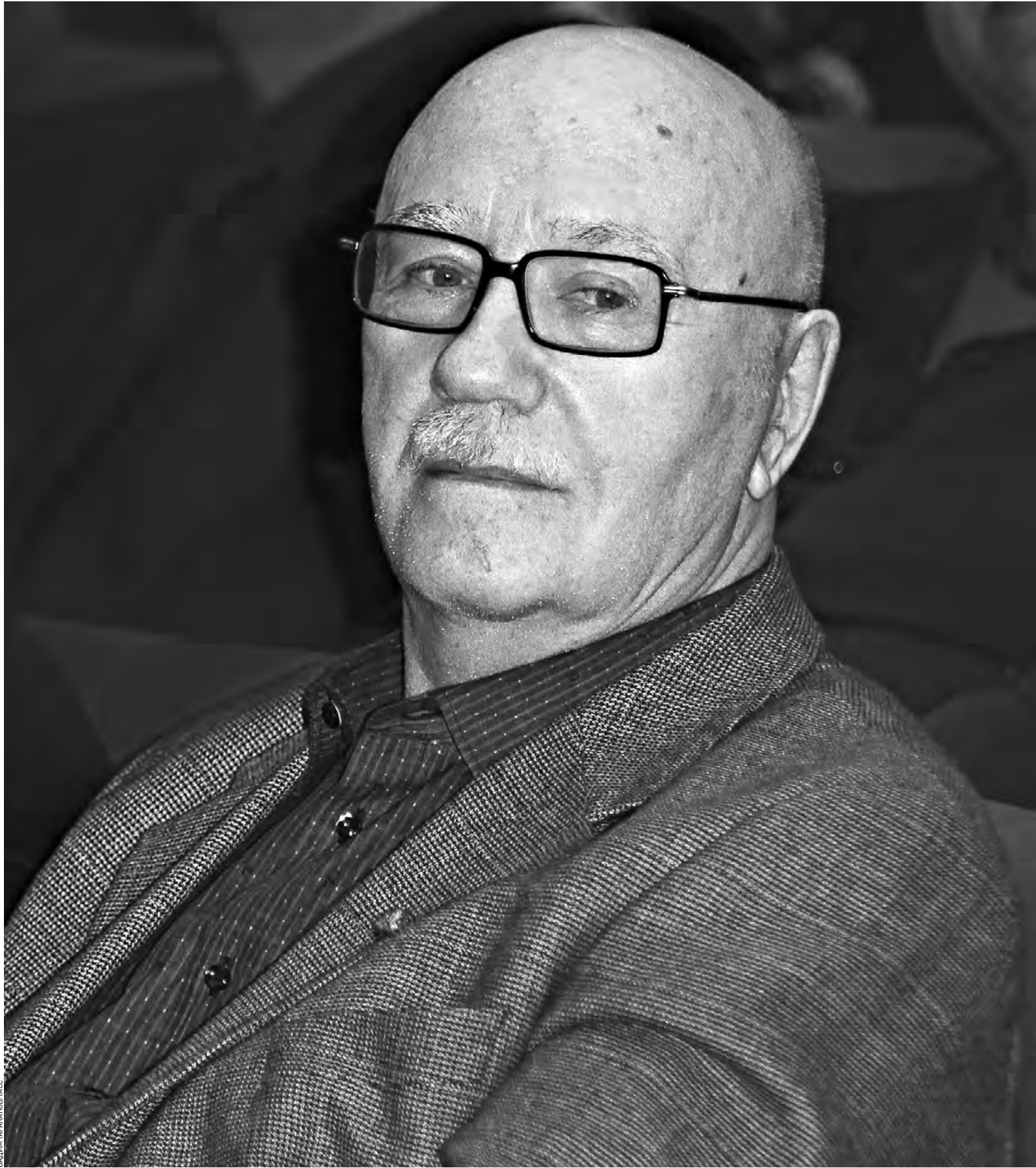
31 января 2013 года. Леонид Куравлев в Доме кино на вечере, посвященном 90-летию Леонида Гайдая

...С 1960 года Леонид Куравлев был членом труппы Театра-студии киноактера (ныне это Центр театра и кино под руководством Никиты Михалкова). Но сниматься он начал еще студентом: в 1958 году Александр Гордон и Андрей Тарковский предложили ему сняться в роли солдата-сапера в картине «Сегодня увольнения не будет». А потом его позвал в «полный метр» Михаил Швейцер — в приключенческой ленте «Мичман Панин» он сыграл матроса. Дебюты, если задуматься, оказались знаковыми: Тарковский был еще в самом начале пути, но ему