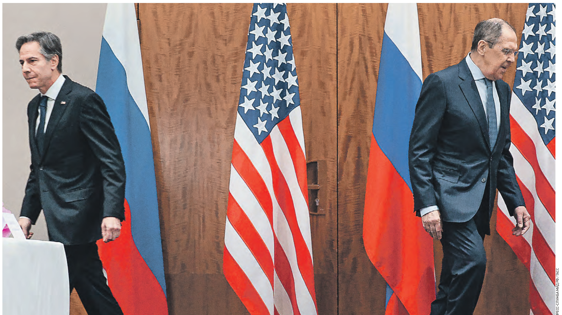
21 января 2022 года. Швейцария. Женева. Министр иностранных дел Российской Федерации Сергей Лавров (справа) и государственный секретарь США Энтони Блинкен во время переговоров по вопросам, связанным с гарантиями безопасности

Coehoorn Вот пусть американцы и расхлебывают. Взглянул на Украину, а теперь пусть ее хоть в НАТО принимают, хоть куда, и нормят.