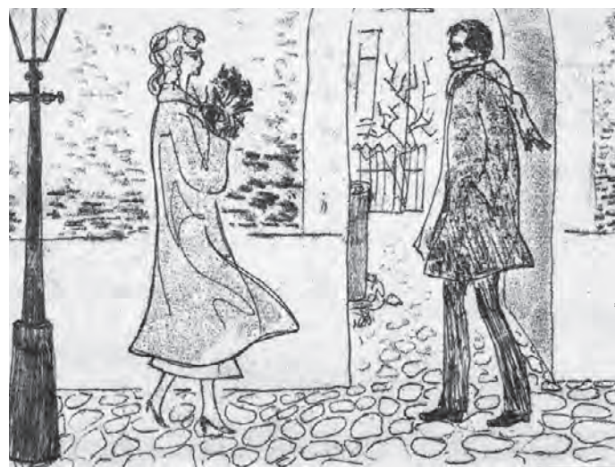
1968 год. Маргарита, нарисованная Надей Рушевой, похожа на Елену Булгакову, которую девочка никогда не видела

Неизвестно, как сложилась бы жизнь Рушевой, если бы не ее трагическая гибель в 17-летнем возрасте. Вполне возможно, что она превратилась бы в художницу, внесшую значительный вклад в мировой фонд культурного наследия. А может быть — отказалась бы от таланта в пользу семьи: такие случаи тоже бывают. Впрочем, глядя на рисунки Нади сегодня, об этом можно только гадать. В фондах музея хранится около 3,5 тысячи работ Рушевой. И несмотря на то что со дня смерти девочки прошли годы, ее произведения, по словам сотрудников музея, всегда вызывают интерес. — Если в социальных сетях выложить что-то из Надиных рисунков — мы моментально получим отклик, — уверяет