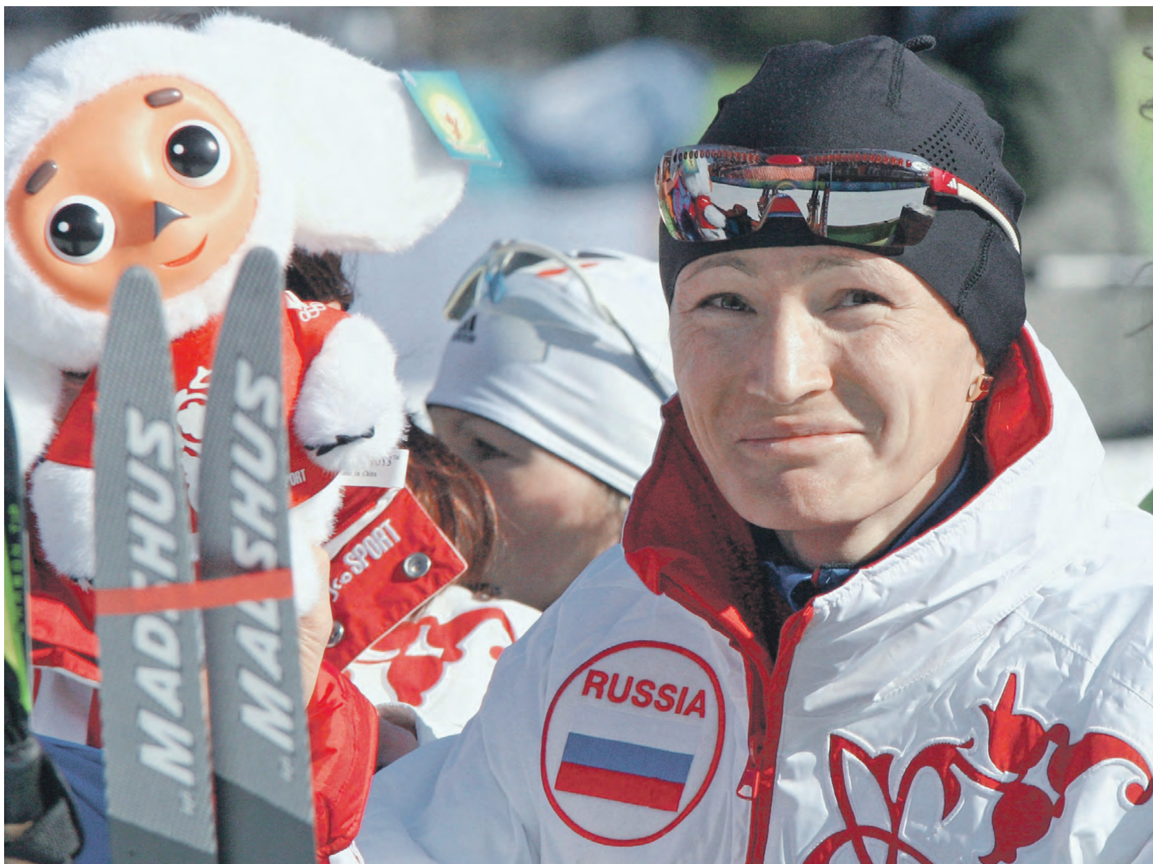
13 февраля 2006 года. XX зимние Олимпийские игры в Турине. Биатлон. Гонка на 15 километров. На этих соревнованиях Светлана Ишмуратова завоевала золотую медаль

Биатлонистка Светлана Ишмуратова: Наши спортсмены обязательно блеснут