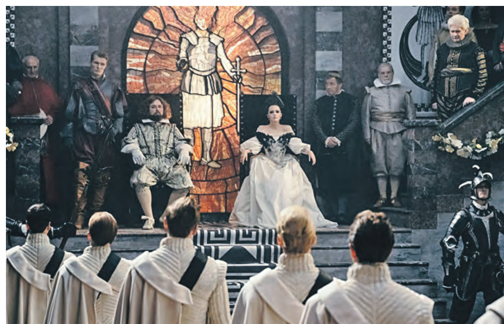
Кадр из сериала «Этерна»: за восседенный трон и власть в отечественном фэнтези будут биться ничуть не менее страстно, чем в «Игре престолов»