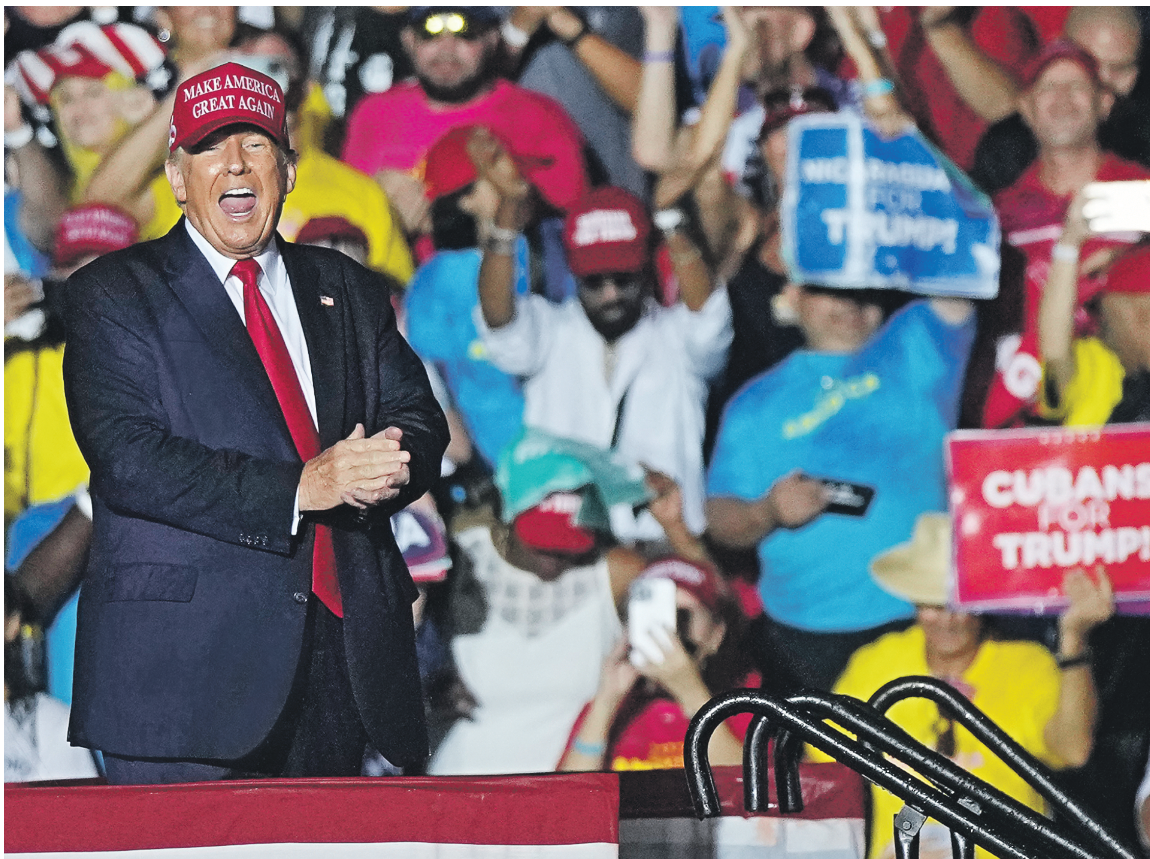
6 ноября 2022 года. 45-й президент США Дональд Трамп приветствует своих многочисленных сторонников, собравшихся в Майами на митинг в поддержку сенатора Марко Рубио

Наш обозреватель анализирует возможные результаты выборов в американский Конгресс