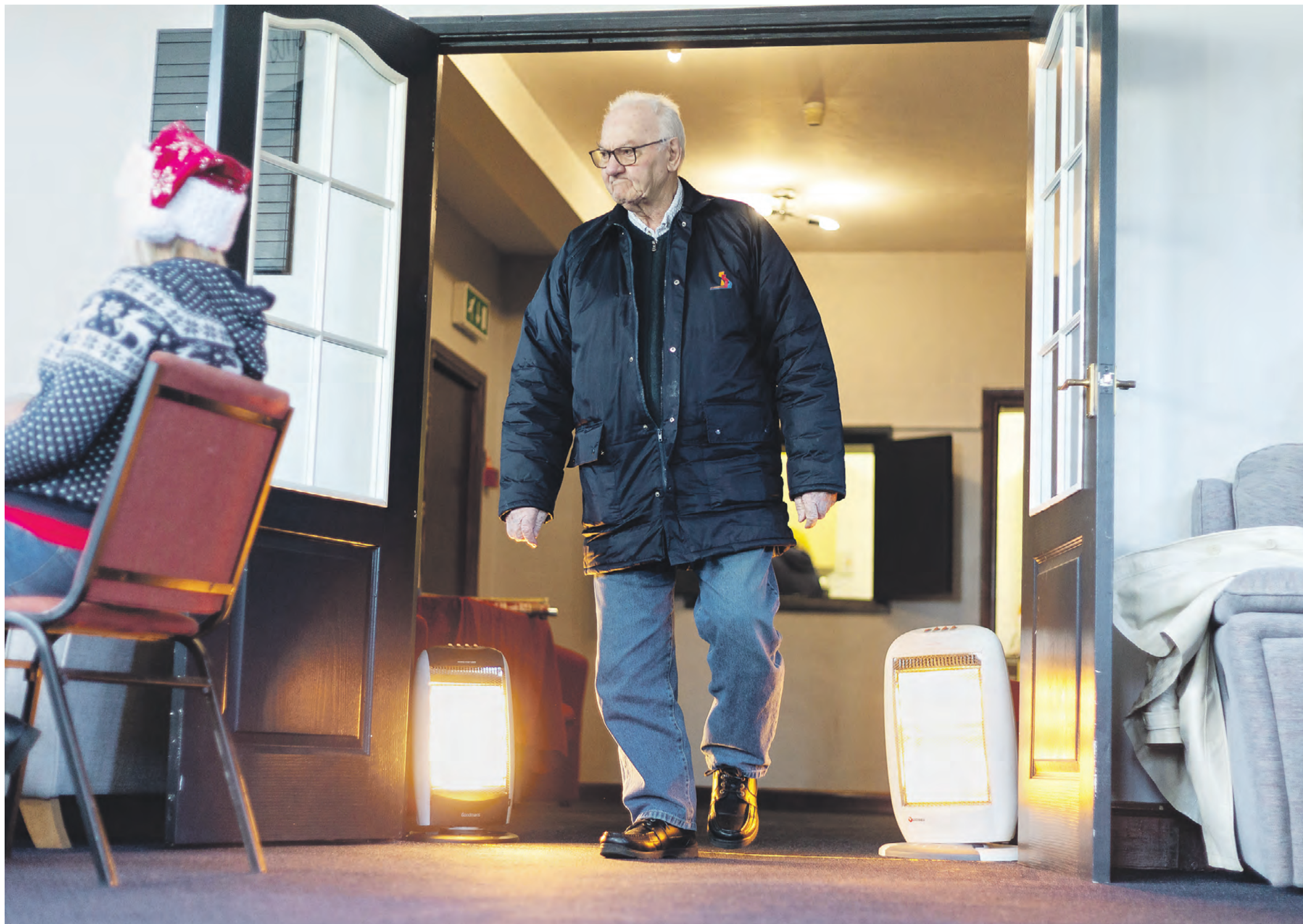
16 декабря 2022 года. Мужчина проходит мимо электрообогревателей в пункте обогрева Edge Center в Таптоне, Великобритания. Сейчас до 6,7 млн домохозяйств в Великобритании вынуждены серьезно экономить на отоплении

Европа стремительно теряет историческое очарование и экономическую мощь