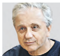
ЕВГЕНИЙ СТЕБЛОВ ПЕРВЫЙ ЗАМЕСТИТЕЛЬ ПРЕДСЕДАТЕЛЯ СОЮЗА ТЕАТРАЛЬНЫХ ДЕЯТЕЛЕЙ РОССИИ