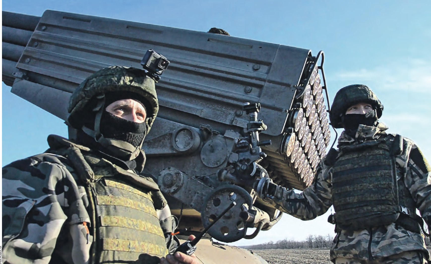
6 января 09:41 Расчет реактивной системы залпового огня «Град» Вооруженных сил России уничтожил огневые позиции украинских националистов, которые базировались на запорожском направлении

По словам официального представителя ведомства генерал-лейтенанта Игоря Конашенкова, в течение прошедших суток российские средства разведки вскрыли несколько пунктов временной дислокации военнослужащих ВСУ в Краматорске. — В результате массированного ракетного удара по данным пунктам временной дислокации подразделений ВСУ уничтожено более 600 украинских военнослужащих, — отметил Конашенков. — В обсервации № 28 Краматорска находились более 700 украинских военнослужащих, в обсервации № 47 — более 600 военнослужащих ВСУ. Помимо этого, российские солдаты поразили скопления украинских националистов и на других участках фронта. — На Краснолиманском направлении российскими подразделениями после завершения режима прекращения огня нанесены артиллерийские удары по двум штурмовым группам ВСУ, — добавил Конашенков. — В результате ударов уничтожено более 50 украинских солдат, три боевые бронированные машины, пикап и автомобиль. Однако даже в период прекращения огня, объявленного