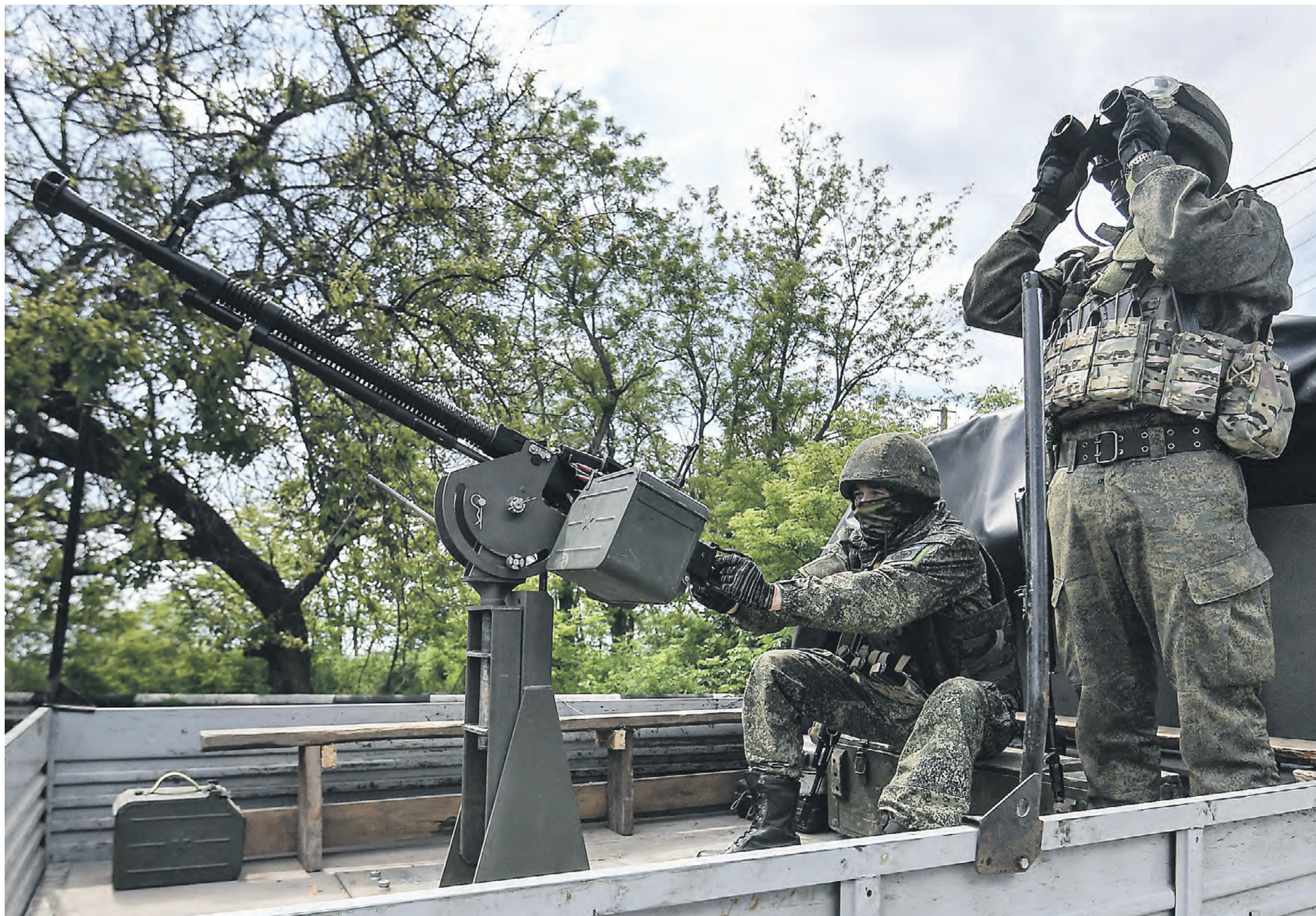
19 мая 2023 года. Зенитный расчет мобильной группы быстрого реагирования ВС РФ вооружен пулеметом ДШК, установленным в кузове УАЗа. У такого орудия за счет подвижности практически отсутствуют мертвые зоны обстрела

Самодельность народных конструкторов позволяет спасти тысячи жизней