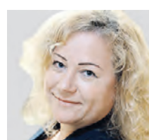
ИННА ПЕХОВА ВИЦЕ-ПРЕЗИДЕНТ НАЦИОНАЛЬНОГО ТУРИСТИЧЕСКОГО СОЮЗА

цен будет мешать развитию этих отраслей. На мой взгляд, нужно потерпеть год или два, и отрасли смогут развиваться.