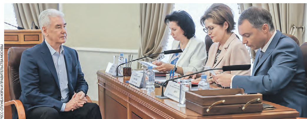
Вчера 14:30 Мэр Москвы Сергей Собянин в здании Московской городской избирательной комиссии подает документы на выдвижение на выборы главы столицы

После проверки комплектности и правильности оформления документов кандидату были выданы письменное подтверждение и справка-разрешение на открытие специального избирательного счета для создания и формирования избирательного фонда кандидата.