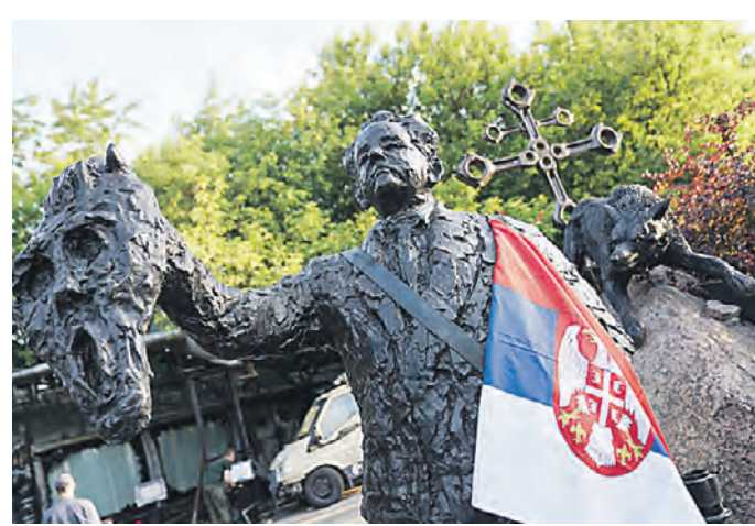
11 июня 20:00 Памятник бывшему президенту Сербии Слободану Милошевичу установили в Нижних Мневниках

— Митрополит его исповедовал. Помню, что после последнего посещения Амфилохий неожиданно повернулся ко мне и сказал: «Ты сделаешь ему памятник». Это было 15 лет назад, я об этом даже не думал. Но спустя годы объявили конкурс на создание памя-