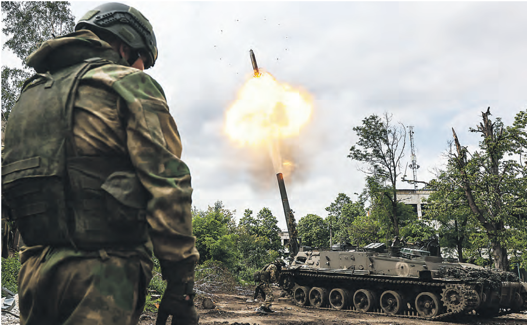
30 мая 2023 года. Солдаты Центрального военного округа ВС РФ наносят удары по вражеским объектам из 240-миллиметрового самоходного миномета большой мощности 2С4 «Тюльпан» на краснолиманском направлении в зоне проведения специальной военной операции

По словам официального представителя Минобороны РФ генерал-лейтенанта Игоря Конашенкова, потери противника при попытке атаки составили до 30 военных. — На купянском направлении ударами штурмовой и армейской авиации, огнем артиллерии и активными действиями подразделений Западной группировки войск в районах населенных пунктов Синьковка, Берестовое и Артемовка Харьковской области пресечена деятельность трех украинских диверсионно-разведывательных групп, — сообщил Конашенков. — В течение суток на данном направлении уничтожено до 30 украинских военнослужащих, боевая бронированная машина, два автомобиля и самоходные артиллерийские установки M109 Paladin производства США и Krab польского производства. Также представитель МО добавил, что ВС РФ продолжают нанесение ударов по врагу, используя высокоточное оружие. — Вооруженные силы РФ нанесли групповые удары высокоточным оружием большой дальности морского и воздушного базирования по местам сосредоточения резер-