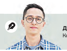
ДЕНИС ВЛАСЕНКО Корреспондент

Самое главное, что у нас не только развивается экономика, но и выполняются и усиливаются все социальные обязательства. Самым интересным, на мой взгляд, был перечень поручений. И в первую очередь — необходимость повысить МРОТ с 1 января 2024 года на более чем 18 процентов в дополнение к тем мерам, которые были уже приняты с 1 июня. Они увеличили прожиточный минимум, пенсии, социальные пособия. Благодаря этим пособиям в целом увеличилась поддержка наиболее бедных слоев населения. Нельзя не отметить, что в последнее время увеличилось и выплаты семьям с детьми. Владимир Путин все время подчеркивает, что бизнес должен работать для людей. Все же без популяционной способности населения не будет развития экономики. В том числе он предложил бизнесу увеличивать зарплату. И это было ключевым условием. Путин говорил о создании в России общества гармонического развития. И бизнес его действительно слышит. Наш президент точно видит, куда и как нам надо идти.