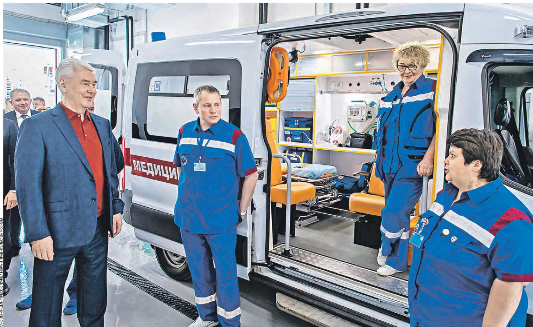
1 июня 13:08 Мэр Москвы Сергей Собянин (слева) общается с врачами скорой помощи на открытии нового детского корпуса больницы в Коммунарке. Глава города отметил, что модернизация системы здравоохранения — приоритетное направление, а помощь в этом оказывают медработники