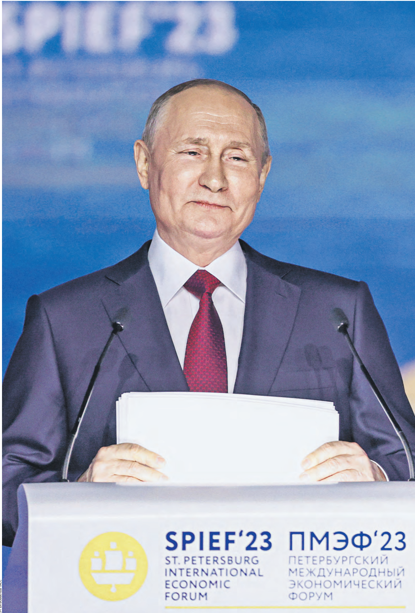
16 июня 2023 года. Президент России Владимир Путин во время пленарного заседания в рамках XXVI Петербургского международного экономического форума

— К сожалению, они не смогли устоять под мощным политическим давлением зарубежных политических элит. Мы никого не выгоняли с нашего рынка, из нашей экономики, даже наоборот, предлагали взвесить все за и против, хорошо подумать о своих российских партнерах и возможных последствиях такого шага. У каждого из наших партнеров было право выбора, — заявил Путин. — Под многими иностранными брендами уже давно продается продукция, которая полностью производится на наших мощностях, по сути, это российские товары — только с зарубежными логотипами. Так что их выпуск с уходом владельцев торговых марок не прекратится — только логотип поменяется. Прибыль от этого бизнеса остается у нас в стране. Будем работать на новых российских собственников, помогать им обеспечивать доходы сотрудников их предприятий, а также смежников и подрядчиков.