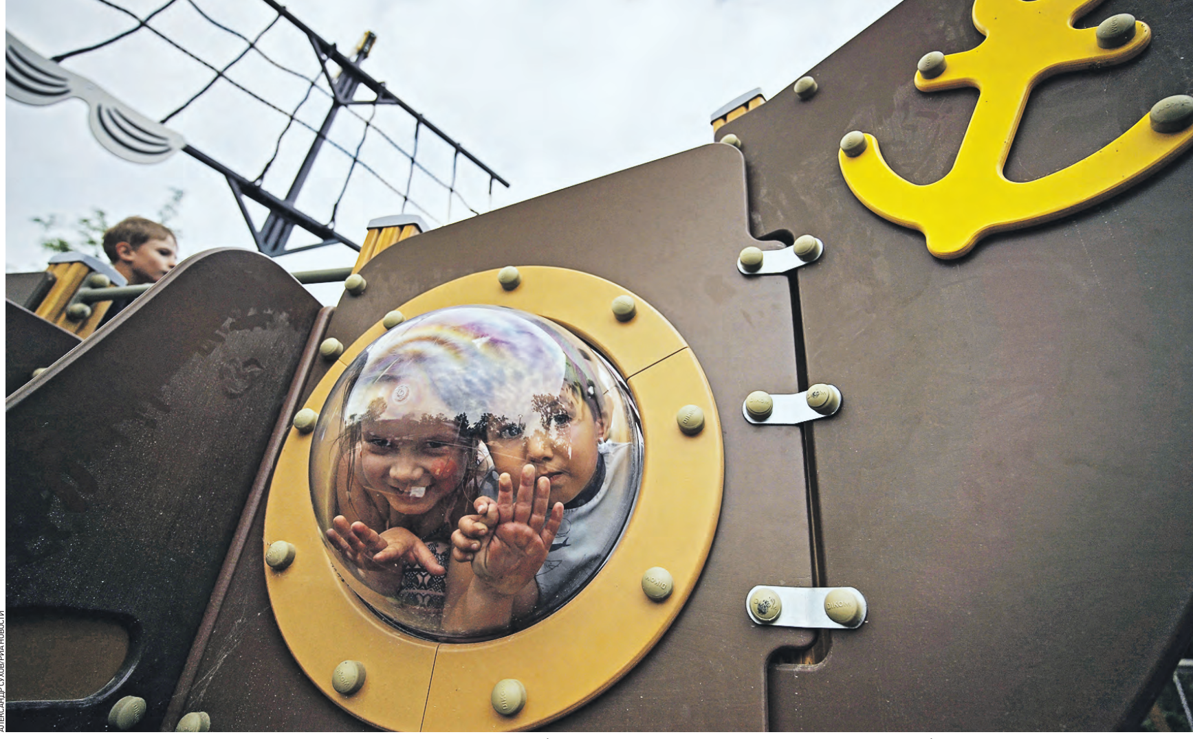
16 июня 19:40 Дети играют на детской площадке в парке 50-летия Победы в Мариуполе. Там заканчиваются восстановление и благоустройство площади в десять гектаров. Завершить работы планируется к концу месяца

— В Шебекинском городском округе из миномета обстреляно село Белынка — зафиксировано 16 прилетов. Никто не пострадал, — сообщил губернатор региона Вячеслав Гладков. — Повреждения получили два корпуса сельхозпредприятия — разбиты фасад, окна, емкости с зерном и водой. По поселку Калининский выпущено шесть минометных