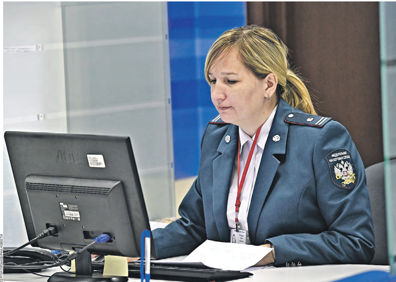
24 апреля 2018 года. Сотрудница инспекции Федеральной налоговой службы РФ на дне открытых дверей ведомства в Москве. На таких мероприятиях можно узнать больше о том, как платить налоги, и избавиться от стереотипов, чтобы не сдавать жилье вчерную

аренда Около 80 процентов недорогих арендных квартир в Москве сдается нелегально: их собственники не платят налоги. «ВМ» узнала, что происходит на рынке аренды жилья.