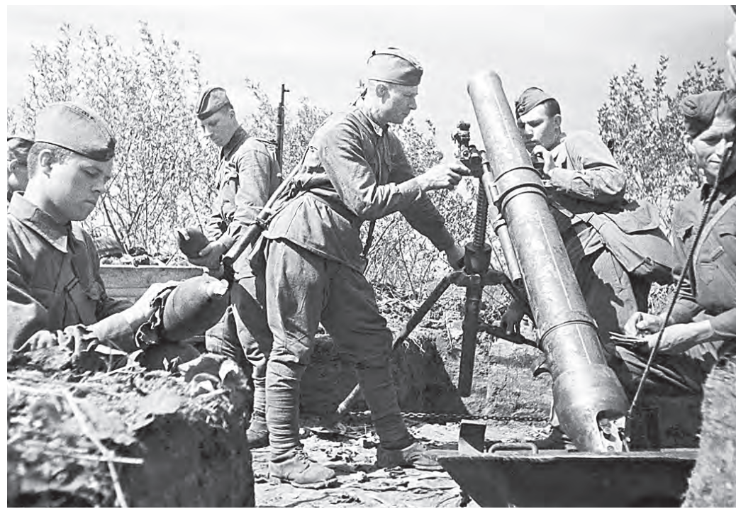
5 июля 1943 года. Советские минометчики сражаются с противником в ходе Курской битвы

— Гитлер и его военное руководство спланировали операцию под названием «Цитадель», начало которой пришлось на 5 июля 1943 года, — рассказывает Борисенко. — Немцы сосредоточили там около 800 тысяч человек, к которым было придано 200 танков и штурмовых орудий, в число которых входили те же «Тигры», «Пантеры» и самоходки «Фердинанд». Но при этом Красная армия к началу битвы уже значительно превосходила противника и в живой силе, и в технике. У нас там были выставлены один миллион 300 тысяч человек, а в резерве стоял Степной фронт, куда входило еще полмиллиона. Он должен был развить наше наступление после того, как будет остановлено немецкое. Кроме того, на 2000 немецких танков пришлось 5000 наших вместе с самоходными орудиями.