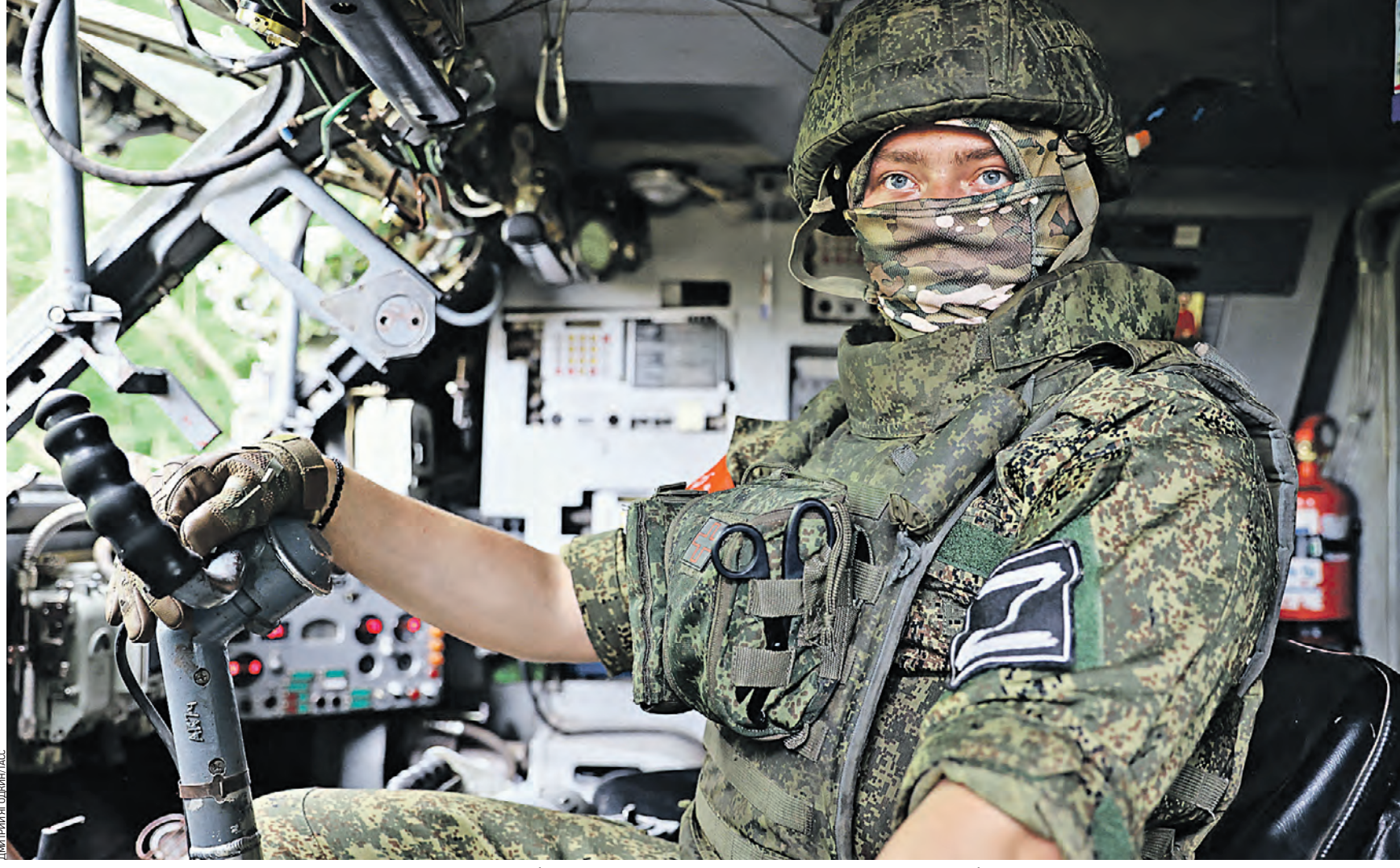
2 июля 2023 года. Российский военнослужащий во время боевого дежурства подразделения противовоздушной обороны 150-й дивизии южной группировки войск на зенитном ракетном комплексе (ЗРК) «Тор-М2»