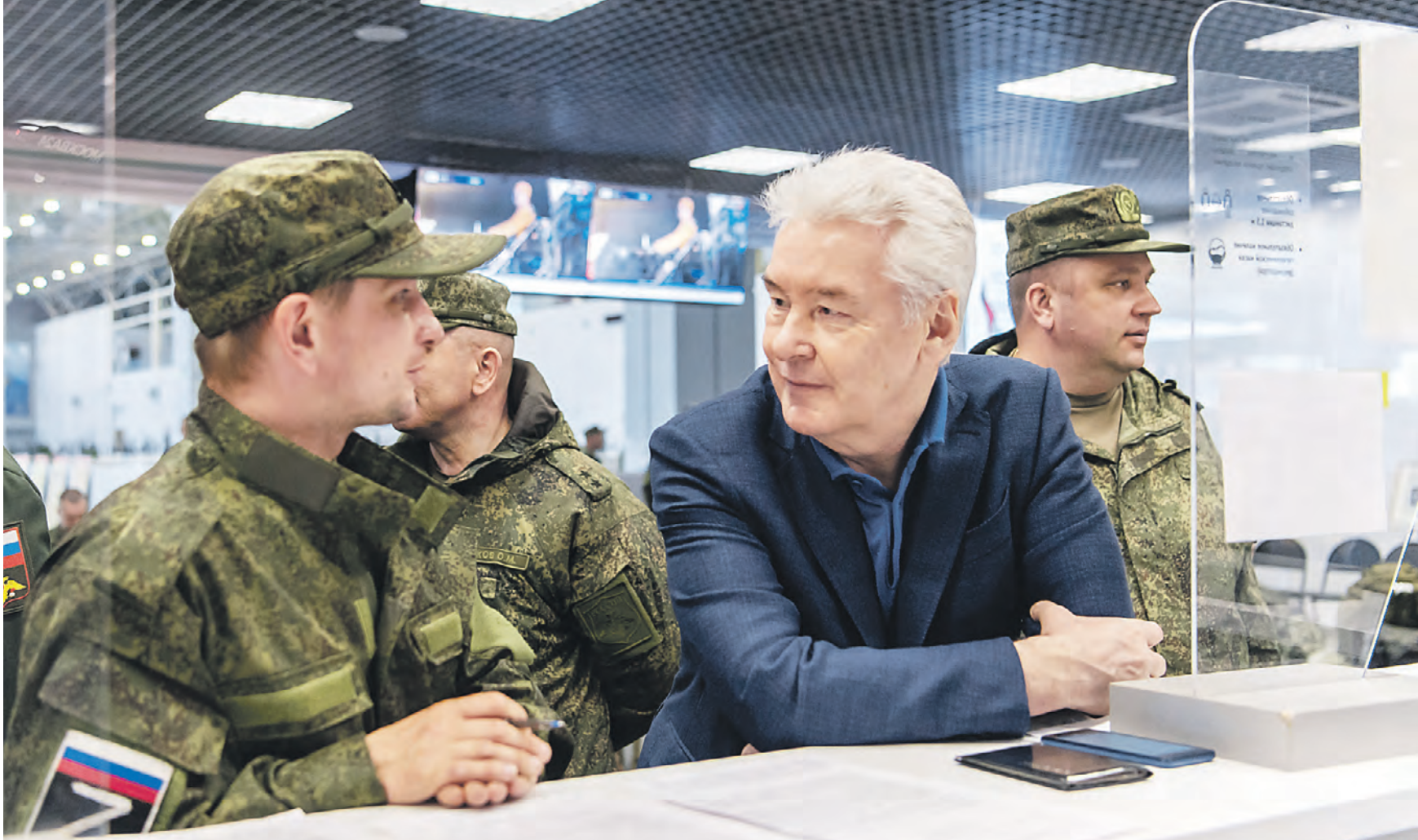
2 мая 2023 года. Мэр Москвы Сергей Собянин (справа) посетил учебно-методический центр «Авангард» и центр «Патриот» Минобороны России. Теперь по распоряжению мэра в городе построят новый современный центр для военно-гражданского комиссариата столицы

Грантовая поддержка Правительство Москвы выделило грант научно-производственному объединению (НПО) «Алмаз» имени академика А. А. Расплетина на совершенствование систем противовоздушной обороны с учетом актуальных вызовов и угроз. Соответствующее постановление на заседании президиума правительства Москвы подписал вчера Сергей Собянин. Документ опубликован на официальном сайте мэра и правительства Москвы mos.ru.