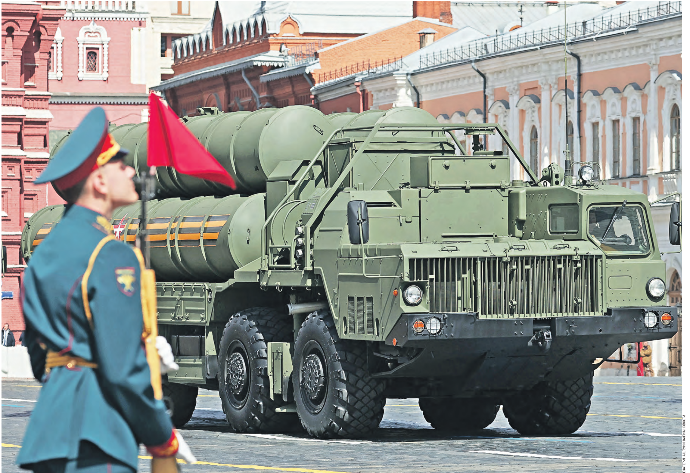
9 мая 2023 года. Зенитная ракетная система С-400 «Триумф» на параде в Москве, посвященном 78-й годовщине Победы. Именно С-400 защищает сейчас столицу. Они сбивают цели на расстоянии до 400 километров

Увы, сразу после немцев нам пришлось защищаться от бывших союзников. — В августе 1945-го американцы уничтожили Хиросиму и Нагасаки, и стало ясно: систему ПВО нужно срочно обновлять, — рассказывает историк. — Ведь американская стратегическая авиация была способна работать на высоте до 12 000 метров. Вот что пишет в своих воспоминаниях легендарный конструктор Павел Куксенко: «Однажды посреди ночи мне позвонили от Сталина и попросили приехать в Кремль. Товарищ Сталин сказал: — Есть такое мнение, товарищ Куксенко, что нам надо незамедлительно приступить к созданию системы ПВО Москвы, рассчитанной на отражение массированного налета авиации противника с любых направлений. Для этого при Совмине СССР будет создано специальное Главное управление по образцу Первого Главного управления по атомной тематике.