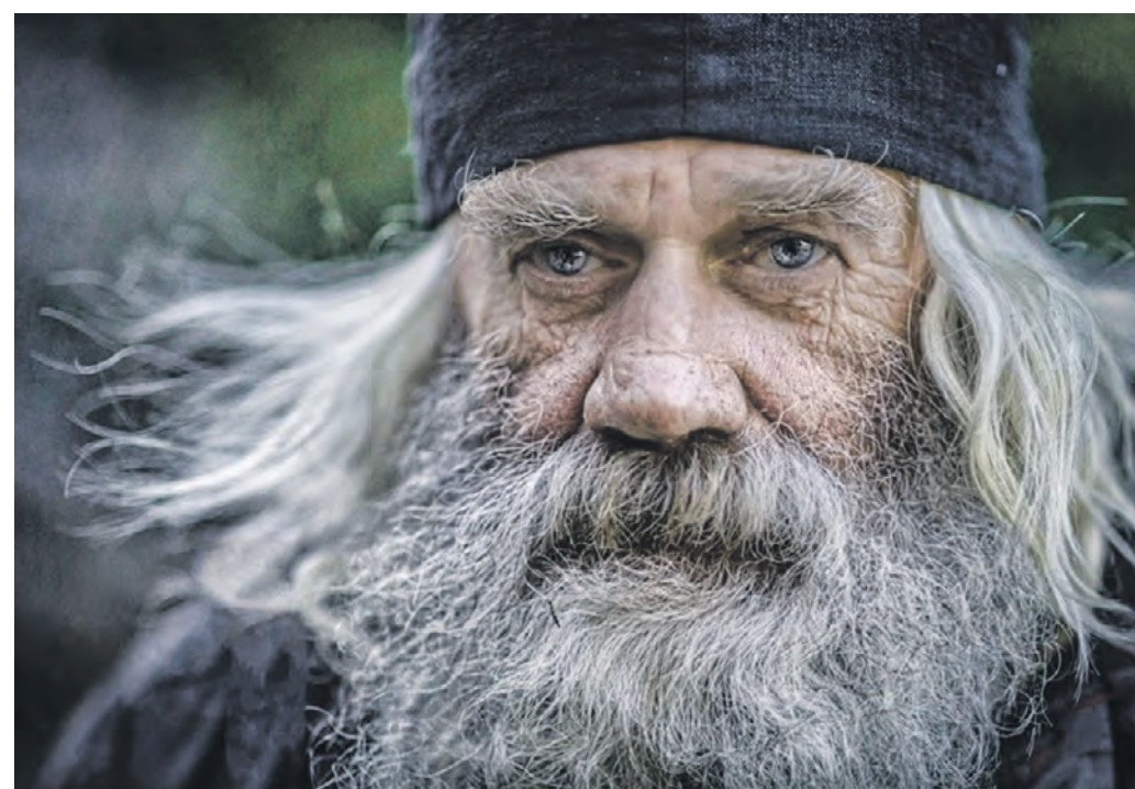
«Послушник Алексий» — фото Олега Семенова, сделанное в Серафимовском мужском монастыре на острове Русский