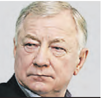
БОРИС ИГНАТЬЕВ РОССИЙСКИЙ ФУТБОЛЬНЫЙ ТРЕНЕР, ЭКС- НАСТАВНИК СБОРНОЙ РОССИИ

Молодые люди должны получать образование, а если говорить про детей — обязательное начальное образование. Ребят надо приобщать к учебе. Мне в юности не хотелось ходить на занятия, потому что там меня не могли заинтересовать. А потом все пошло по-другому. И я увлекся учебой. Так же дело обстоит и с футболом. Начнем с того, что это один из самых доступных видов спорта. Раньше, например, ребятам было достаточно всего четырех кирпичей для ворот. И дети гоняли мяч на любом пустыре. Сегодня повсюду стали появляться секции, строятся стадионы. И современные мальчишки и девчонки увлекаются этой игрой. Я считаю, что ребята обязательно должны идти в этот вид спорта. Футбол развивает детей гармонично во всех проявлениях. Но главное — он учит работать в команде. Ведь вся наша жизнь проходит в коллективе. Где бы мы ни оказались: в транспорте, на работе, на дне рождения, — нас везде окружает коллектив. И надо уметь себя в него встраивать. Если ты к этому не привык, а занимаешься каким-то индивидуальным видом спорта, то развиваешься только сам по себе. И у человека вырабатывается какое-то особое отношение к себе и окружающим. Например, я сильнее, а тот слабее. А в футболе очень интересно и точки зрения эмоций, и с точки зрения коллектива. У мальчишки или девчонки появится понимание, как относиться к своему партнеру по команде независимо от его положения, цвета кожи. Поэтому сегодня шутка про то, что в семье было три сына: двое умных, а третий — футболист, — становится неактуальной.