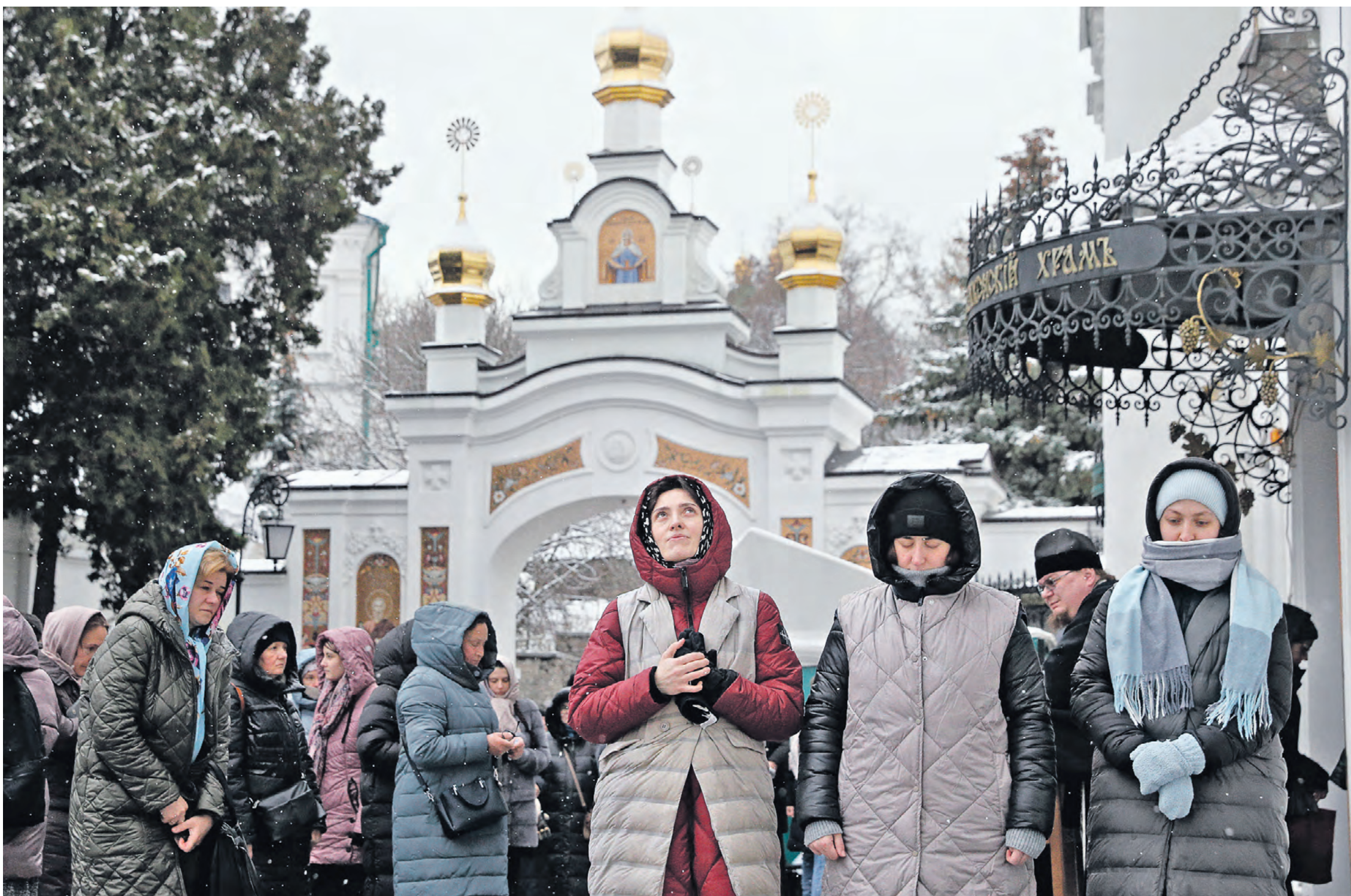
29 марта 2023 года. Киев, Украина. Верующие собрались в Киево-Печерской лавре, когда украинские власти в одностороннем порядке разорвали договор с Украинской православной церковью, а монахов обязали покинуть обитель

— В главном здании Службы безопасности Украины, на улице Владимирской, 33, в центре Киева, целый этаж уже много лет занимают сотрудники ЦРУ, которые курируют, а часто и организуют все, что в СБУ делают, — рассказывает Земцев. — И мне трудно представить, что офицеры ЦРУ станут учить украинский суржик. Разумеется, они общаются с аборигенами на языке, который удобен им. Поэтому английский сотрудникам службы знать нужно. В Главном управлении разведки Министерства обороны Украины, что на Рыбальском острове в Киеве, ровно такая же ситуация: клопы служат на подхвате у сотрудников ЦРУ и британской МИ6. И тоже «разговаривают» по-английски.