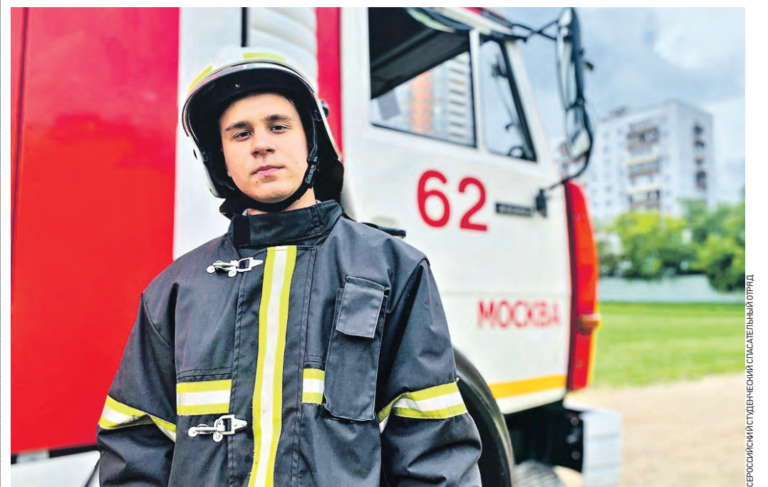
15 июля 11:19 Сотрудник 62-й пожарно-спасательной части проводит для детей Донбасса мастер-класс по боевому развертыванию пожарного рукава

В Государственном университете управления продолжают смены для подростков из новых регионов РФ, которых обучают спасательному делу. Корреспондент «ВМ» узнал, как готовятся ребята из Донбасса.