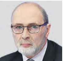
РОМАН ВИЛЬФАНД НАУЧНЫЙ РУКОВОДИТЕЛЬ ГИДРОМЕТЦЕНТРА РОССИИ

Если говорить о центре европейской России, то погода будет по-настоящему замечательная в течение всей недели. Отмечу, что с юга и юго-запада активно перемещаются теплые воздушные массы. Поэтому температура воздуха со вторника поднимется до 25 градусов. При этом уже в пятницу шкала термометра покажет 30 градусов, а на предстоящих выходных показатели и вовсе перевалят за эту отметку. Однако летнюю погоду можно измерять не только по температуре воздуха в течение дня, но и по минимальным значениям. Так, на неделе ночные показатели в Москве будут варьироваться от 13 до 18 градусов выше нуля. Кроме этого, важно отметить, что в условиях потепления климата происходит увеличение амплитуды погодных характеристик, то есть ее изменчивости: только за первую четверть XXI века количество экстремальных явлений увеличилось вдвое. Высокая температура способствует фронтальным разделам: погода может резко поменяться и преподнести неприятные сюрпризы.