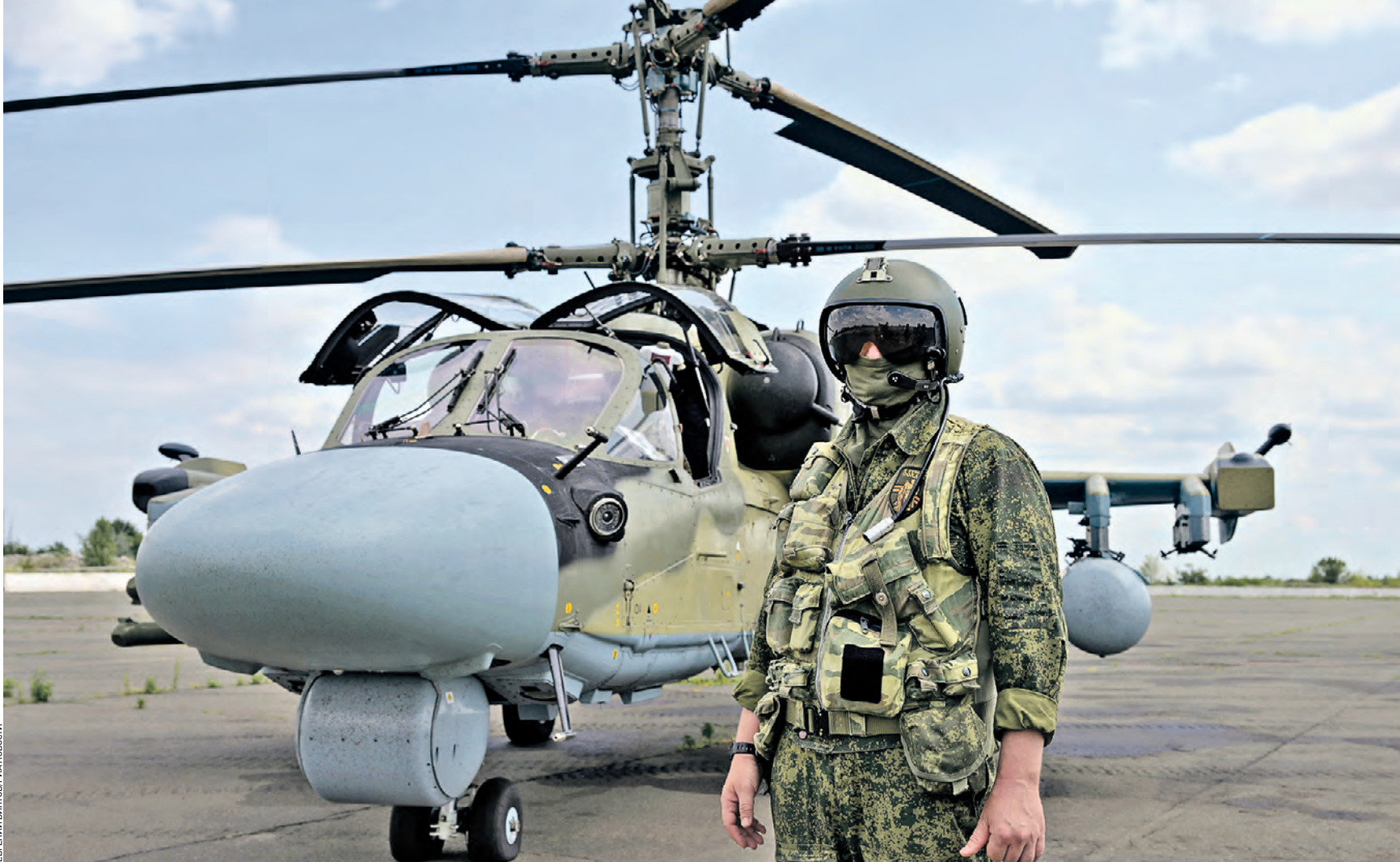
24 июля 2023 года. Российский пилот современного ударного вертолета Ка-52 Вооруженных сил РФ перед очередным боевым вылетом в зоне проведения специальной военной операции

Дмитрий Песков сказал, что это вызывает дискомфорт у западных политиков и налогоплательщиков. Неэффективность использования вооружения НАТО особенно проявляется на передовой. Например, на Южнодонецком и Запорожском направлениях ВСУ потеряли за сутки до 275 националистов, рассказал официальный представитель Министерства обороны России генерал-лейтенант Игорь Конашенков. Более 220 радикалов российской армии уничтожили на Донецком направлении.