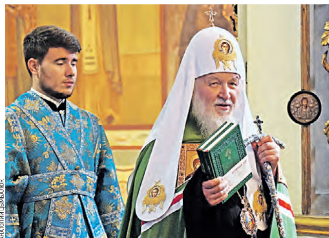
1 сентября 12:27 Патриарх Кирилл (справа) совершает литургию в Большом соборе Донского монастыря в год 430-летия обители

— В 1380 году донские казаки преподнесли икону в дар Дмитрию Донскому в честь победы в битве на Куликовом поле, — рассказывает протоиерей Донского монастыря Филарет. — Войско Мамай было