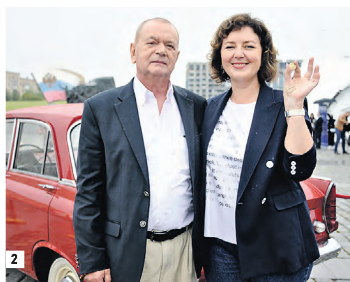
Юлия Казакова — первый заместитель Департамента средств массовой информации и рекламы города Москвы