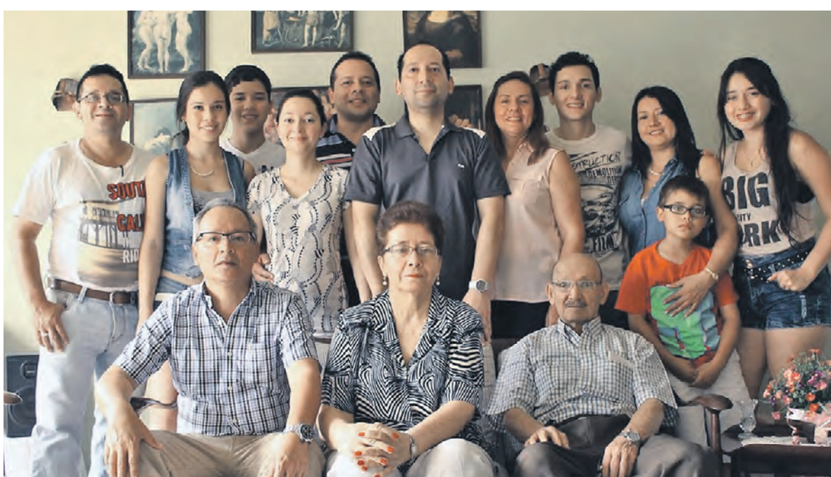
Эктор Исидро Арена Нейра и его большая колумбийская семья на малой родине — городе Сан-Хиль

и посол России в Боготе откровенно и открыто обсудили существующие опасения и согласились с необходимостью восстановить взаимное доверие. Именно в тот момент правительство решило назначить меня послом в России с целью нормализовать наши двусторонние отношения. Это не только большая честь, но и величайший вызов для меня как дипломата с более чем 33-летним стажем на дипломатической