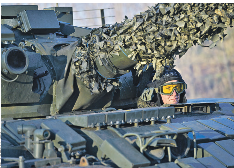
12 ноября. Член экипажа модернизированного танка Т-62 во время боевой стрельбы на полигоне в Запорожской области в зоне специальной военной операции. По данным Министерства обороны России, на этом направлении ВС РФ ударами авиации, огнем артиллерии отразили атаку штурмовой группы 65-й механизированной бригады ВСУ в районе Работино. За минувшие сутки потери противника составили до 40 военнослужащих, два автомобиля.