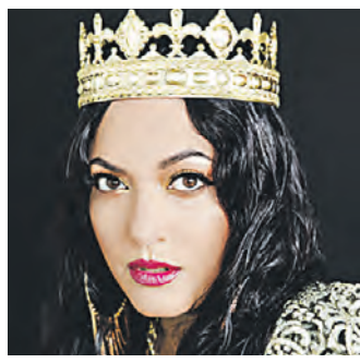
манс. Эта культура завоевала их сердце и голову, и они обогатили его по-своему. Какие композиции вы будете исполнять? Это будут классические романсы: «Хризантемы», «Утро туманное», «Калитка», «Не

добавили ритма русскому романсу, раздвинули его рамки. Мы хотели сделать все с симфоническим оркестром. Но в результате остановились на сопровождении четырех скрипок и контрабаса. Этого «ребенка» мы вынашивали очень долго. И для меня это была чрезвычайно ответственная задача. Чем вас привлекает именно этот жанр? Я — русская цыганка. Меня воспитала русская культура. Цыганского романа как такового не существует. Но цыгане сохранили русский ро-